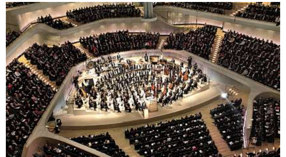
Exklusiv am Sonntag, 8. März in der Elbphilharmonie: das Braunschweiger Staatsorchester