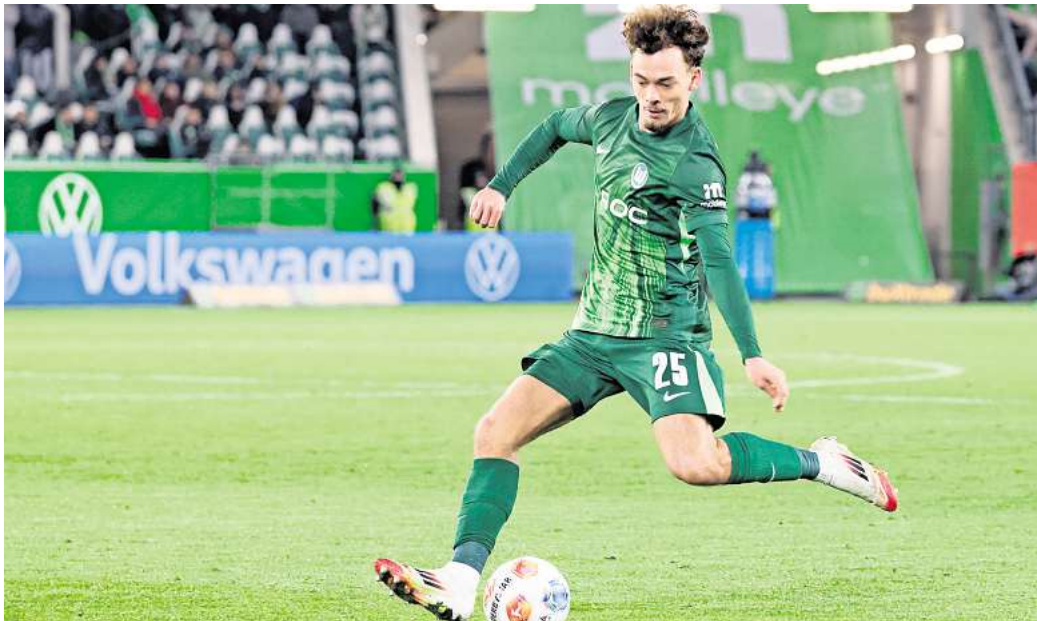
Der VfL hofft im Heimspiel auf ein Befreiungsschlag im Abstiegskampf

Mit lediglich acht Punkten aus elf Spielen rangiert der VfL aktuell auf Platz 15 und damit nur