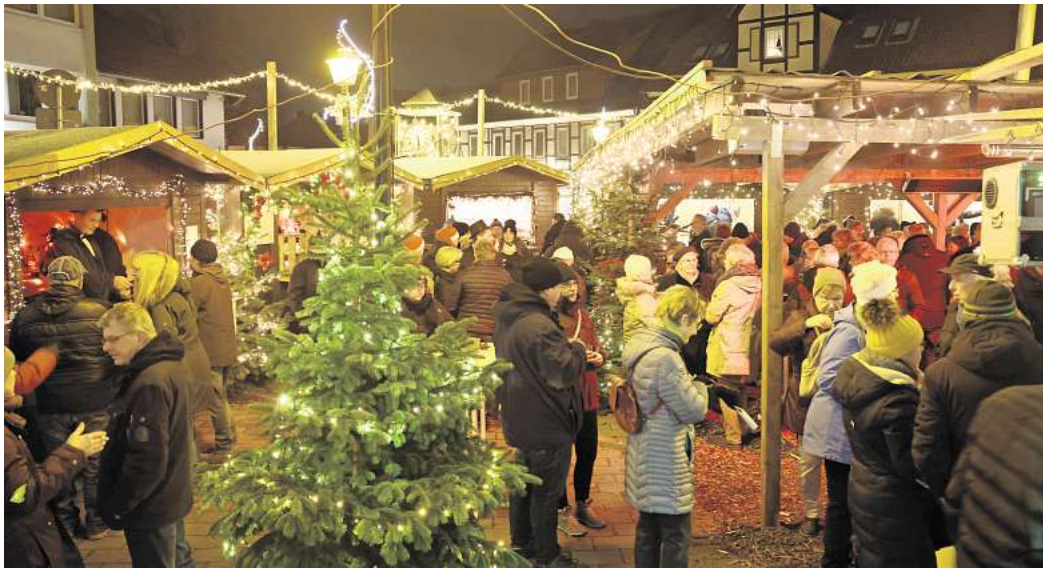
Ein Abstecher zum Weihnachtsmarkt ist für viele ein festes Ritual.

Denn einige fahren jedes Jahr zu ihrer Familie – egal wie weit weg oder wie viel Stress der Besuch auch beinhaltet. Die Familie kommt zusammen und es wird sich richtig schick gemacht. Andere wiederum lieben es, ihre