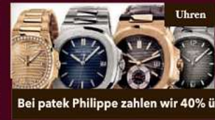
Bei patek Philippe zahlen wir 40% über den Börsen Kurs