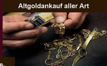
Altgoldankauf aller Art

Antiquitäten- & Goldankauf Gothaer Str. 7 38442 Wolfsburg Ehmen Tel.: 0 163 / 78 78 227