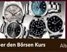
Alte Rolex Uhren ( auch defekt)