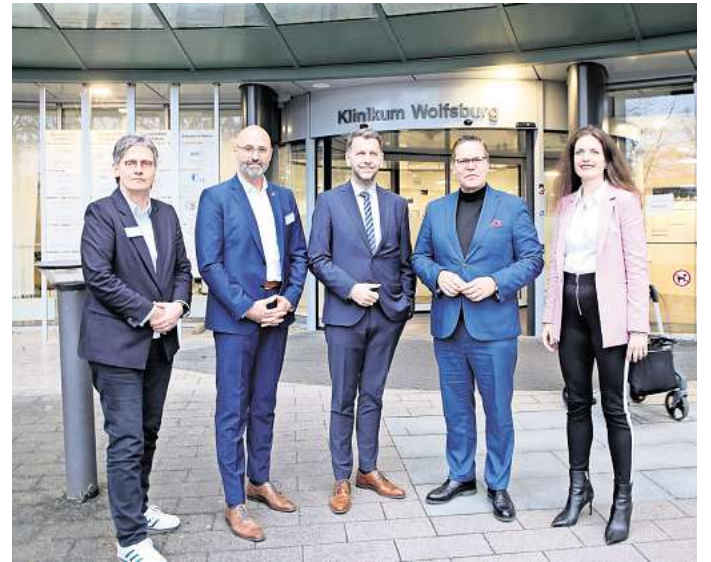
Besuch aus Berlin: Der Parlamentarische Staatssekretär im Bundesministerium für Gesundheit, Tino Sorge (2. von rechts), besuchte das Klinikum Wolfsburg.

Tino Sorge (CDU) führte aus, dass es für Kliniken schwierig sei, die schwarze Null im Geschäftsbericht zu erreichen. Nach seinem Rundgang und den Gesprächen vor Ort konnte er feststellen: „Beim Klini-