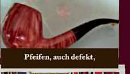
Pfeifen, auch defekt,

Die Spezialisten prüfen Ihre Gegenstände kostenlos auf Echtheit. Unverbindliche Beratung und kostenlose Wertschätzung Ihrer Schätze. Hauptfiliale: 38300 Wolfenbüttel, Harztorplatz 4