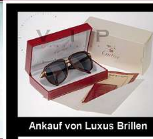
Ankauf von Luxus Brillen