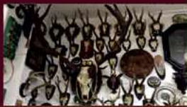
Geweihe mit Höchstpreisen von 1200,-€*

Ankauf von: Pelze, Felle, Mützen, Schals, Lederjacken, Ledertaschen, Dirndl, Trachten, Geweihe, Hummel, Goebel Kristalle, Gläser, Teller, Vasen, Geschirr, Sets, auch einzeln Antike Möbel, Ölgemälden, Bronzen, Porzellan, Puppen, Orientteppiche, Instrument, Piano, Orgel, Trompete Charivari, u.v.m.