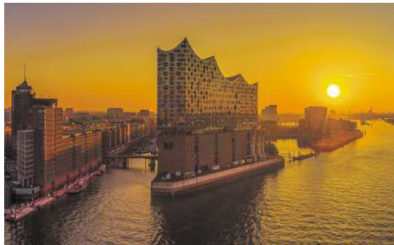
Europas wohl berühmtestes Konzerthaus: die Hamburger Elbphilharmonie.

Tickets schon ab € 70,- inkl. Busanreise Um diesem Ereignis beiwohnen zu können hat DER SCHMIDT verschiedene Reisepakete geschnürt. Ob Tagesfahrt oder mit Übernachtung, ob günstige Einstiegs-kategorie oder Top Tickets: Bereits zu Vorzugskonditionen ab € 70,- kann man das Braunschweiger Staatsor-