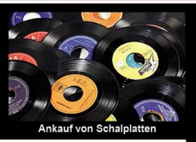
Ankauf von Schallplatten