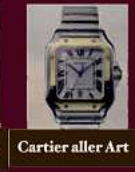
Cartier aller Art