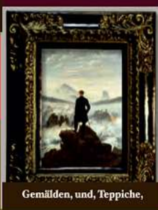
Gemälden, und, Teppiche,