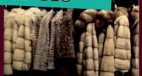
Für Pelze zahlen wir bis zu 12.000€* Alle Ankäufe nur in Verbindung mit Gold

Ankauf von: Goldschmuck, Armbänder, bevorzugt in breiter Form Ketten, Ringe, auch defekt, Zahngold, mit und ohne Zähne, Weißgold, Goldmünzen, Thaler, Medaillen, auch defekte, Münzen, Goldbarren, Nuggets, Schmelzgold, Platin, Schmuck, Münzen, Schmelzplatin, Paladium Modeschmuck, vergoldete defekte Uhren Wir kaufen auch größere Mengen von Nachlässen