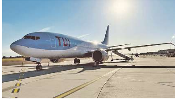
Rundreisen in Europa direkt mit Flug ab Braunschweig: Exklusiv bei DER SCHMIDT

Den Katalog, weitere Informationen und Buchungsmöglichkeit dieser exklusiven Angebote unter www.der-schmidt.de , in den FIRST Reisebüro Schmidt und weiteren Reisebüros der Region oder unter der kostenfreien Buchungshotline T. 05331 / 884 - 222 (Mo-Fr. 9 - 18, Sa. 9 - 13 Uhr).