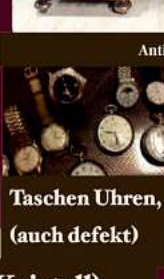
Taschen Uhren, (auch defekt)