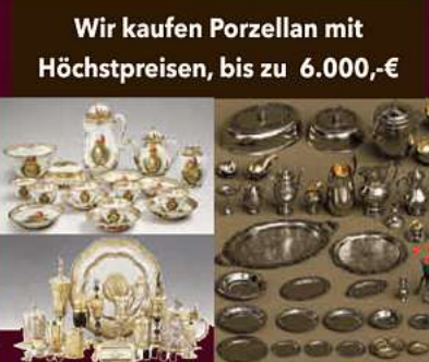
Wir kaufen Porzellan mit Höchstpreisen, bis zu 6.000,-€