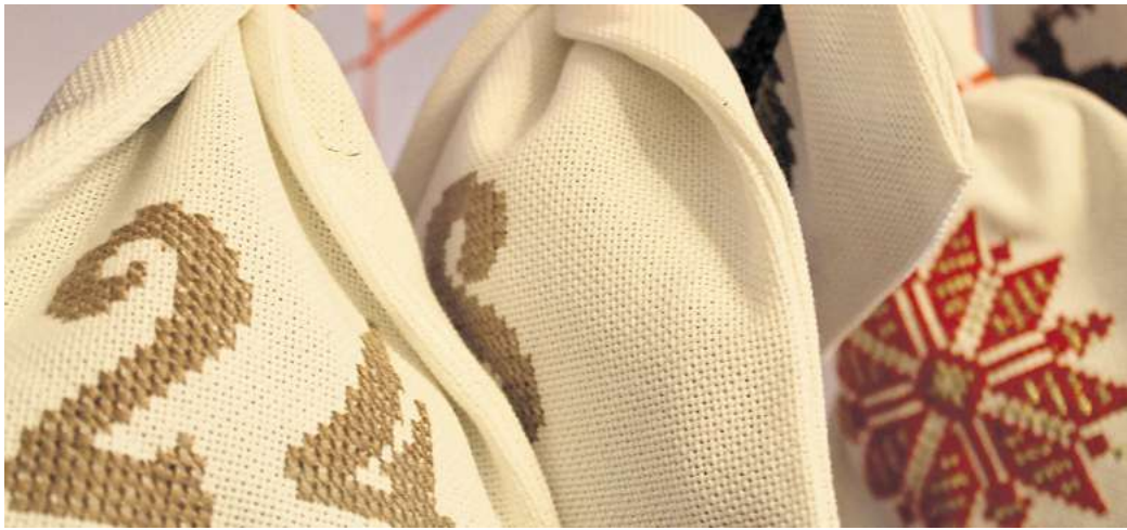
Ein bisschen Adventszauber und vielleicht sogar einen Gewinn verspricht der digitale Adventskalender von WAZ und WMG.

Vom 1. bis zum 24. Dezember öffnet sich unter www.waz-online.de/kalender jeden Tag ein neues, digitales Türchen. Dahinter wartet immer eine WeCard im Wert von 10 bis 50 Euro. Mal klein und charmant, mal ein echtes Highlight – denn der Gutscheinwert wechselt täglich und bleibt bis zum Öffnen geheim.