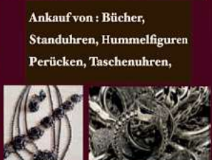
Silber und Trachten Schmuck aller Art

Jetzt neu! Ankauf von Schnupftabakdosen, Eisenbahnen, und Instrumente, zu Höchstpreisen.