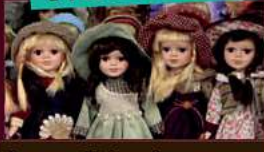
Puppen zu Höchstpreisen von 1500,-€*