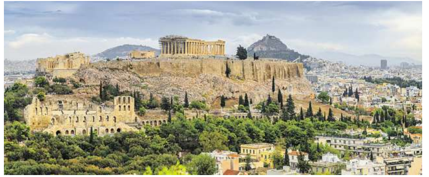
Die weltbekannte Akropolis in Athen kann man auf der Griechenland-Rundreise erleben

Einzigartig ist ganz sicher auch die Rundreise durch Griechenland. Um nur einige Highlights zu nennen: Die Meteora Klöster, Delphi, Epidaurus, der Olymp oder Athen mit der Akropolis gehören sicherlich zu den Orten, die man im Leben gesehen haben muss.