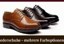
Lederschuhe - mehrere Farboptionen

Wir kaufen Goldschmuck jeglicher Art, auch defekt, ebenso wie Silberschmuck in allen Varianten 90/100/800/925