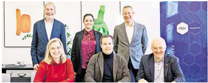
Win-win für Arbeitgeber und Absolventen: Kooperation des Arbeitgeberverbandes mit TU Braunschweig und Ostfalia Hochschule Wolfsburg.

„Durch die Kooperation mit Stellenticket schaffen wir für die Region Braunschweig-Wolfsburg ein weiteres verbindendes Element zwischen Wissenschaft und Wirtschaft. Auf dem Portal können Arbeitgeber kostengünstig und einfach Stellen für Absolventen, Werkstudierende, Abschlussarbeiten und Praktika schalten“,