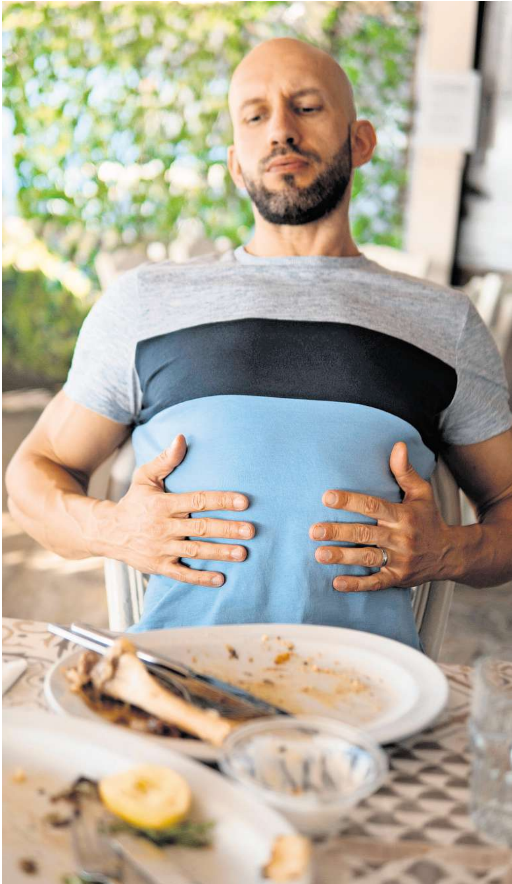
Etwa jeder Zweite erlebt regelmäßig eine lähmende Müdigkeit nach dem Essen.

Am weitverbreitetsten ist unter Fachleuten die Ansicht, dass die innere Uhr beim Mittagstief eine Rolle spielt. Demnach ist das „Suppenkoma“ ein natürliches Tief, das in der Mittagszeit auftritt – unabhängig davon, was man gegessen hat. Es könnte sogar ein bis heute be-