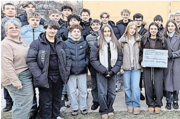
Schülerinnen und Schüler des Kurses Ökonomische Bildung haben ihr erwirtschaftetes Geld an das Hospiz übergeben.