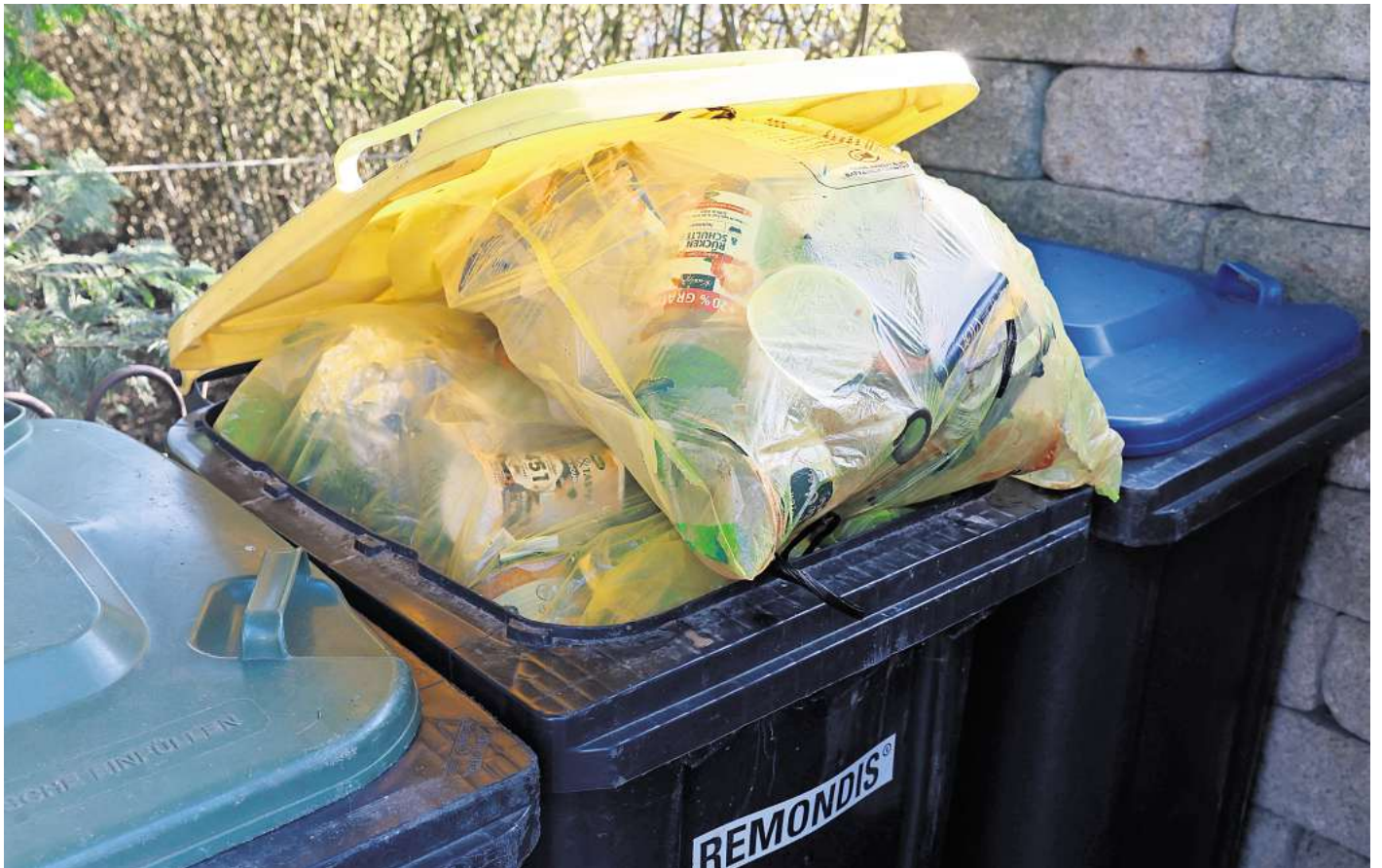
Diese Wertstofftonne quillt bereits über, bevor der Leerungstermin ansteht.

Sowohl die WAS als auch Remondis bitten alle, „das Volumen erstmal an den ersten Abfuhrterminen zu testen“ und über eine gewisse Zeit zu schauen, wie sich der Bedarf einpendele. „Grundsätzlich gilt, dass