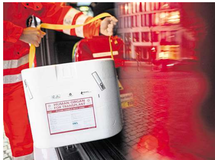
Wer eine Entscheidung zur Organspende getroffen hat, tut gut daran, sie festzuhalten.

Das kann laut „organspende-info.de“ beispielsweise passieren, wenn man einer Organspende zustimmt, aber eine künstliche Beatmung ablehnt. Hintergrund: Nur wenn die zeitweise fortgeführt wird, können Organe ent-