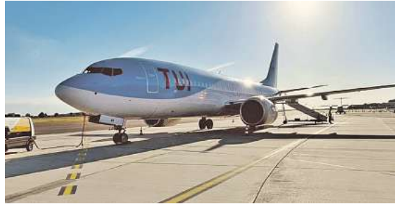
Fliegen ab Braunschweig - exklusiv bei momento by DER SCHMIDT

Die Nachfrage nach „Fliegen ab Braunschweig“ ist riesig. Schon ab € 599,- gibt es Angebote in die Sonne. Mit dem „Boutique VIP Erlebnis“ ab dem neuen Passagierterminal. Den Katalog, weitere Informationen und Buchungsmöglichkeit dieser exklusiven Angebote unter www.fliegen-ab-braunschweig.de , in den FIRST Reisebüro Schmidt und weiteren Reisebüros der Region oder unter der kostenfreien Buchungshotline T. 08 00 / 38 300 38 (Mo-Fr. 9 – 18, Sa. 9 – 13 Uhr).