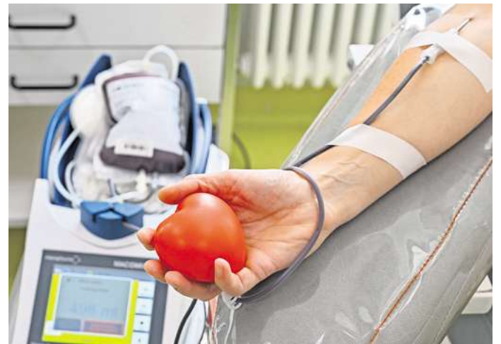
Nach Krankheit, Impfung oder Zahnbehandlung gilt: Erst die vorgeschriebene Pause einhalten, dann Blut spenden.

Gut zu wissen: Jeder Blutspendetetermin beginnt mit einer genauen Prüfung, ob man als Spender oder Spenderin infrage kommt. Wer vorab eine erste Einschätzung haben möchte, kann sich durch einen Check des DRK-Blutspendedienstes West klicken. Generelle Voraussetzungen für die Blutspende sind, dass man mindestens 18 Jahre alt ist und mindestens 50 Kilogramm wiegt. (DPA)