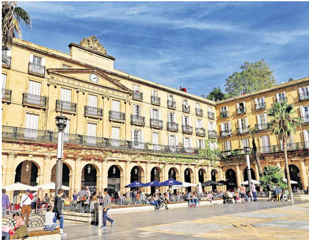
Die Plaza Nueva mit ihren hochgewachsenen Palmen, eingrahmt von Gebäuden neoklassizistischer Architektur, ist ein Besuchermagnet.

In den 90er-Jahren strukturierte sich Bilbao um: zum spanischen Zentrum für Architektur und Kunst. Die Eröffnung des Guggenheim-Museums von Architekt Frank Gehry im Jahr 1997 markierte den Start eines neuen Zeitalters. Das Museum sorgte für einen Touristenan-