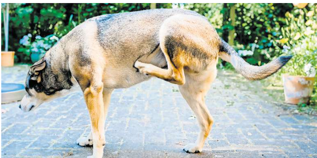
Der Hund kratzt sich unentwegt? Dahinter können Allergien, Entzündungen oder Parasiten stecken.