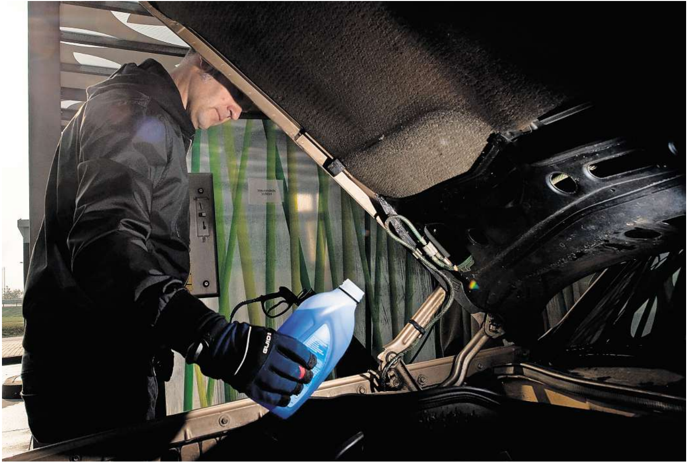
Klare Sicht fein? Jetzt noch den Frostschutz des Kühlsystems checken.

Sind die klaren Scheiben gesichert, lohnt auch ein Blick auf eine andere Stelle des Motorraums - nämlich den Kühlmit-