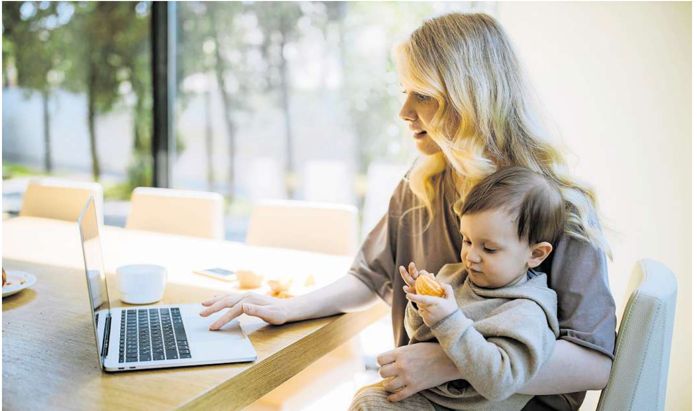
„Funktionierer“ funktionieren auch dann noch, wenn sie eigentlich abschalten sollten.