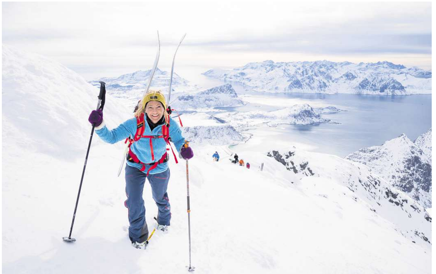
Erhebung Himmeltindan auf der Lofoten-Insel Vestvågøya: Der Aufstieg beim Skitourengehen macht sich bei der Aussicht mehr als bezahlt.

Das Skigebiet in Alaska ist nur etwas für gute Skifahrer und Snowboarder. Wer seine Grenzen vollends ausloten möchte, lässt das Resort bei Anchorage