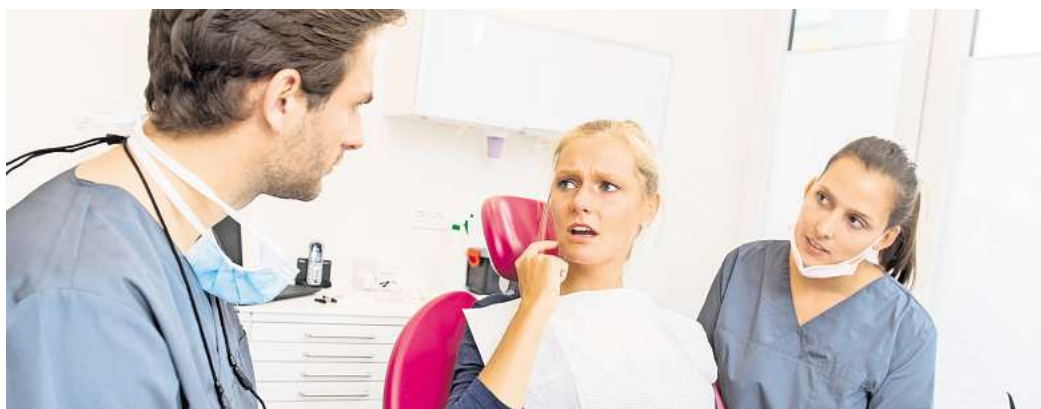
Lockere Zähne können verschiedene Ursachen haben – eine frühzeitige zahnärztliche Untersuchung ist wichtig.

Bei beiden treiben Bakterien des Zahnbelags ihr Unwesen.