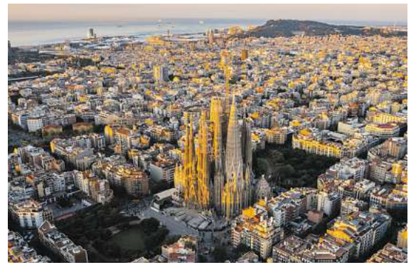
Bereits ab € 499,- geht es als Oster(ferien)angebot nach Barcelona oder Rom

In allen Zielen hat der Gast die Auswahl aus einem vielfältigen Hotelangebot. So kann man vom Flair-Hotel bis zur Luxusherberge,