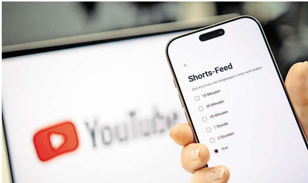
Weniger Endlos-Scrollen: Eltern können die tägliche Nutzungszeit für YouTube Shorts in den Einstellungen begrenzen oder die Shorts ganz abschalten.

Hintergrund: Gerade bei kurzen Videos gerät man schnell ein unkontrolliertes Scrollen - und bei YT Shorts handelt es sich dem Fachportal „heise online“