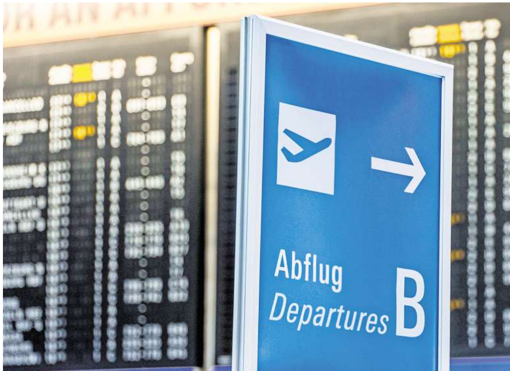
Ohne Visum kein Abflug: Reisebüro musste nach gescheiterter Pauschalreise den Preis erstatten.

Das Gericht gab dem Mann recht. Zum einen bestanden nach der Zeugenbefragung Zweifel, ob die Mitarbeiter im Reisebüro den Kunden tatsächlich umfassend aufgeklärt haben.