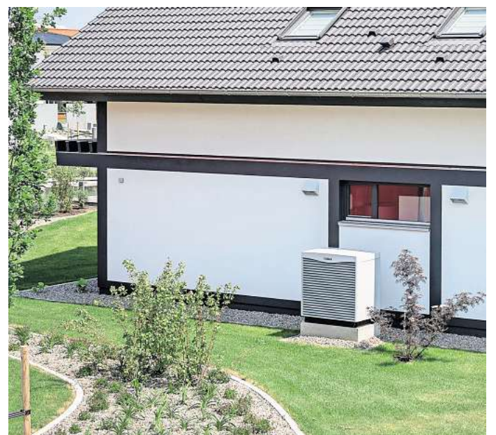
Frist nicht verpassen: Wer den Wärmepumpen-Strom separat misst, kann sich Geld vom Stromanbieter zurückholen.

Der Verbraucherzentrale zufolge halten viele Anbieter dafür entsprechende elektronische Formulare oder Musterbriefe bereit. Der Stromversorger ist dann seinerseits dazu verpflichtet, dem zuständigen Netzbetreiber bis Ende Februar den Befreiungsanspruch anzuzeigen. (DPA)