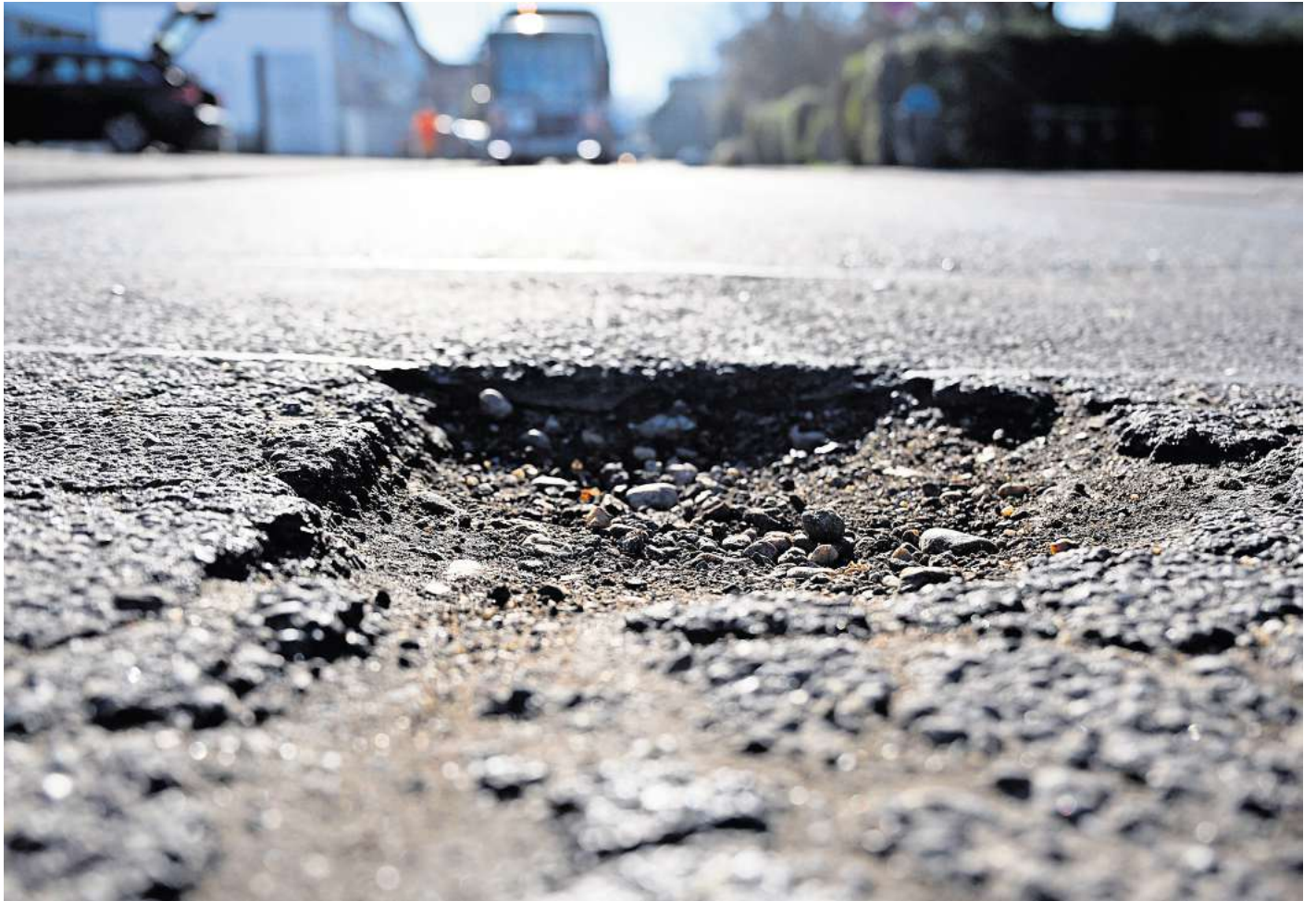
Flickenteppich und Kraterlandschaften: Nicht immer ist der Straßenbelag ideal - welche Pflicht hat die Gemeinde, Gefahren abzuwenden?

Die Bruchstellen wären am rechten Straßenrand gewesen –