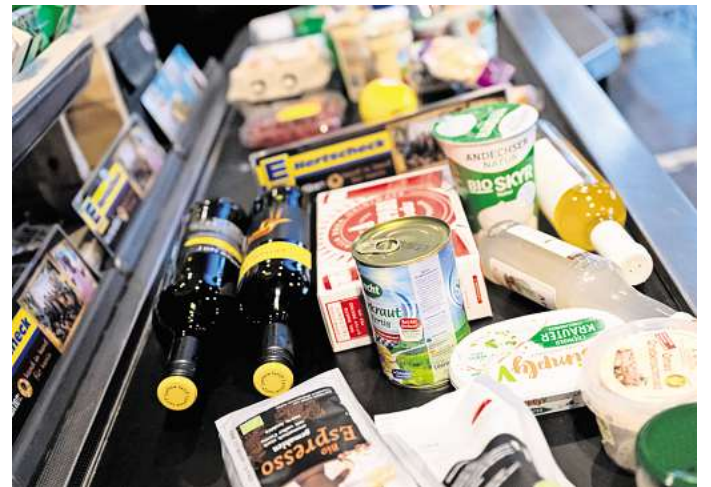
Der Warentrenner sorgt am Kassenband immer wieder für Konflikte.

Am Ende ist der Einsatz eines Warentrenners also vor allem eines: eine Geste des Respekts und eine Einladung zu einem entspannteren Miteinander an der Kasse. Wer diesen kleinen Handgriff vornimmt, macht darum zumindest nichts falsch. (DPA)