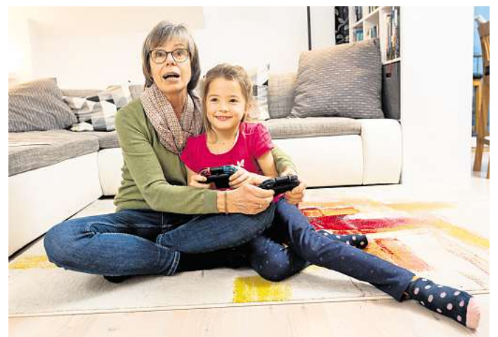
Bei den Großeltern gelten oft andere Regeln - und das ist auch in Ordnung.