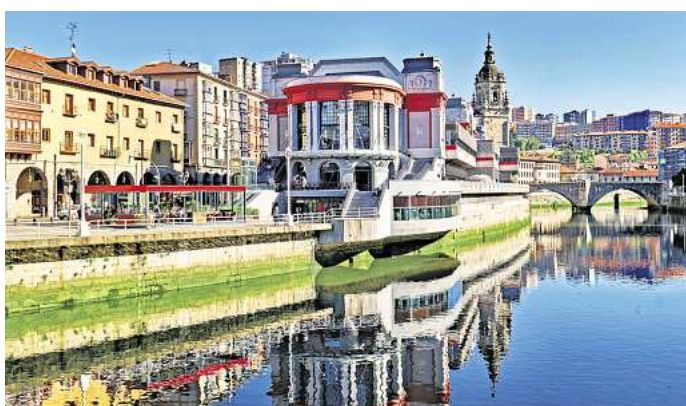
Mercado de La Ribera: Schlemmerparadies am Flussufer.

Hast du nun Lust bekommen auf die Stadt im hohen Norden Spaniens? Bilbao heißt dich mit baskischer Herzlichkeit und seinen vielen Gesichtern willkommen.