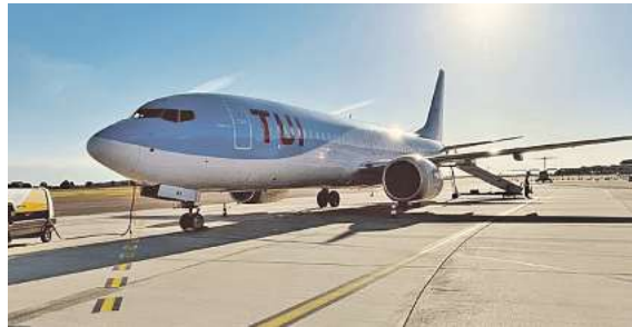
Fliegen ab Braunschweig: Jetzt mit TUIfly

Den Katalog, weitere Informationen und Buchungsmöglichkeiten