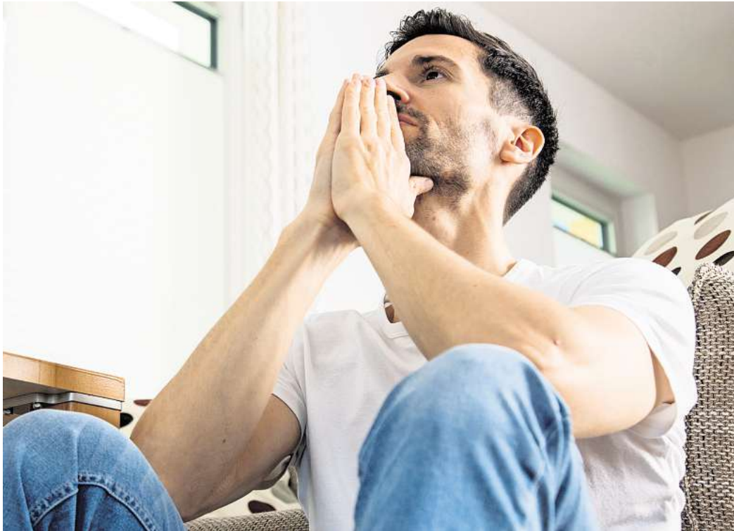
Erst mal den Kopf freibekommen: Wer innerhalb einer gewissen Zeitspanne viele Entscheidungen treffen musste, sollte dem Gehirn Ruhe gönnen.