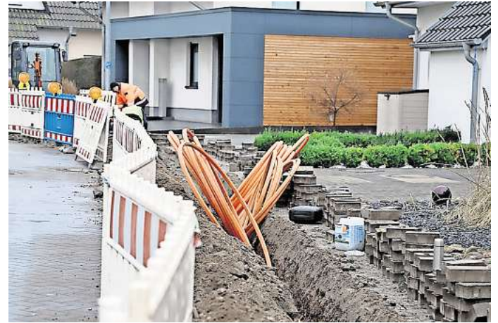
Die obere Meinstraße in Vorsfelde: Die Stadt möchte, dass Anwohner künftig den Winterdienst selbst übernehmen. Die Ortsratspolitiker sind dagegen.