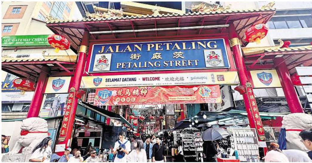
Eingang zum Herzstück von Chinatown: das Tor zur Petaling Street.