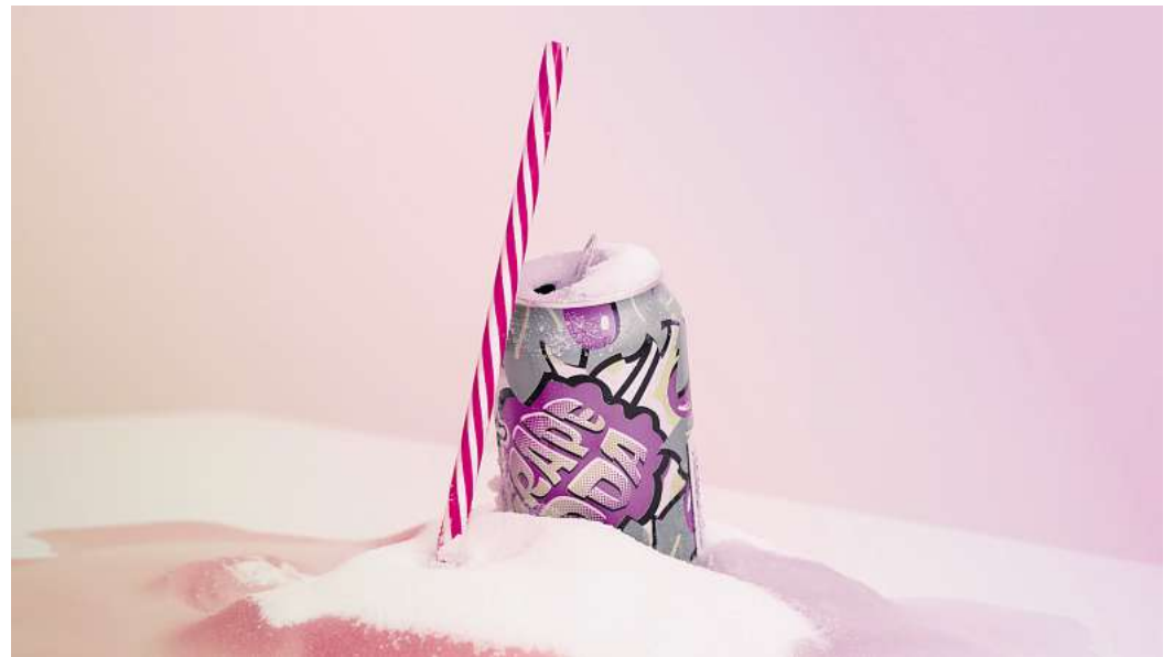
Zuckerhaltige Getränke belasten die Nieren: Fruchtzucker aus Softdrinks und Fertigprodukten kann langfristig Nierenschäden fördern.

Fruktose ist beispielsweise in Softdrinks, Energydrinks, Sportgetränken, Eistees und aromatisierten Wässern zu finden. Auch Fruchtjoghurt, Müs-