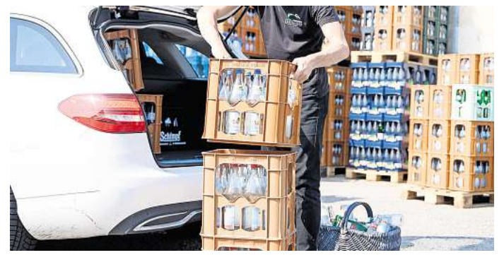
Nachhaltigkeit zählt: Wer ökologisch handeln möchte, sollte Mineralwasser in Mehrwegflaschen kaufen und auf regionale Quellen achten

Wer beim Kauf von sich aus ökologische Aspekte berücksichtigen möchte, sollte Mineralwasser in Mehrwegflaschen kaufen und Quellen aus der Region bevorzugen, so die Verbraucherzentrale. Das reduziere Transportwege und schone Ressourcen. (dpa)