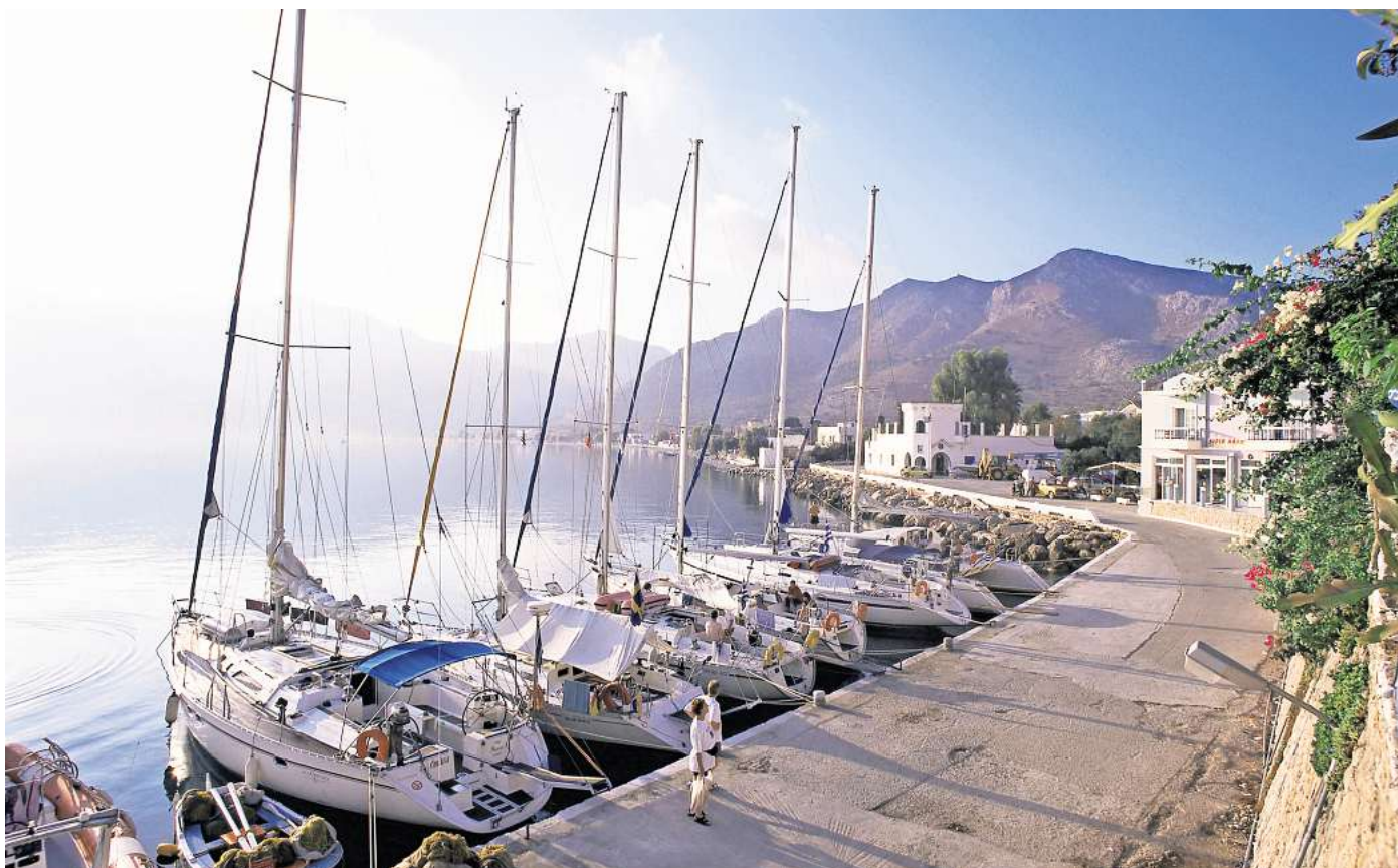
Die Insel Tilos wird auch als Zero-Waste-Insel bezeichnet.

Die Bioabfälle werden zu Dünger verarbeitet, recycelbarer Abfall wird wiederverwertet und nicht recycelbarer Müll