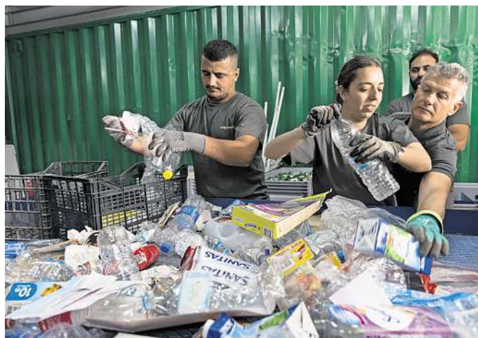
Recycling gehört auf Tilos zum Alltag.

Tilos hat keinen eigenen Flughafen, ist aber prima per Fähre von Rhodos aus zu erreichen. Die Überfahrt dauert rund zwei Stunden und kostet im Schnitt 24 Euro hin und zurück. Vom Flughafen Rhodos erreichst du den Hafen mit dem Bus in einer halben Stunde. Es gibt allerdings nur wenige Überfahrten pro Woche nach Tilos, am besten buchst du rechtzeitig online.