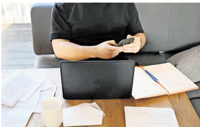
Die Arbeit von zu Hause erledigen: Aus steuerlicher Sicht kann das - gerade bei kurzen Arbeitswegen - durchaus lohnenswert sein. )

Auf der anderen Seite gilt seit 2026 eine einheitliche Entfernungspauschale von 38 Cent pro Kilometer ab dem ersten Kilometer des einfachen Arbeits-