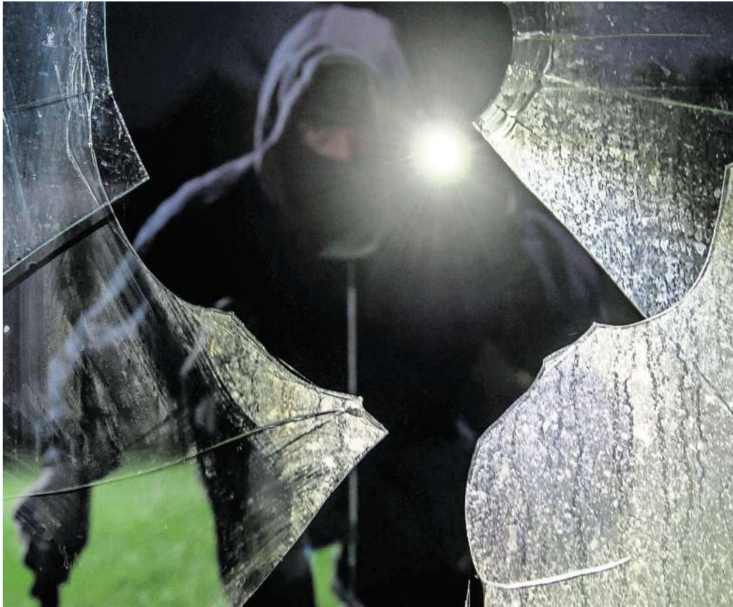
Wie «einladend» Ihr Grundstück für Einbrecher ist, können Sie durch eine bewusste Gestaltung beeinflussen.

Hilfestellung will man den Einbrechern natürlich nicht auch noch geben - keine Kletterhilfen etwa, mit denen sie leichter auf