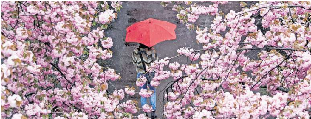
Aktiv werden, damit die Stimmung besser wird: Auch wenn das mit einer Depression nicht immer einfach ist - Bewegung an der frischen Luft kann Betroffenen helfen

Möglicher Auslöser: der Erwartungsdruck, dass es einem jetzt, wo eine schöne Jahreszeit kommt, gut gehen muss. Die