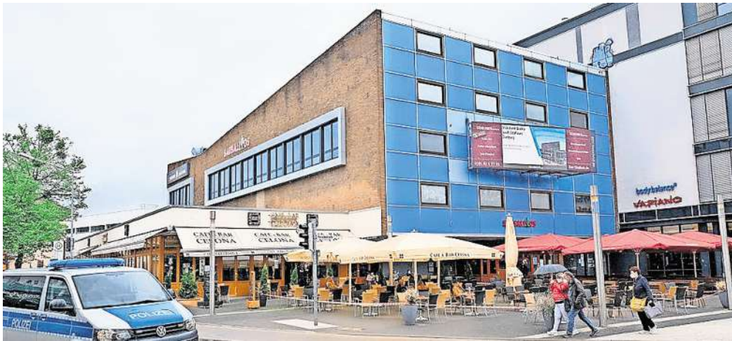
Die Porschestraße soll sicherer und sauberer werden - zu diesem Zweck hat die Verwaltung ein umfassendes Konzept erarbeitet.

„Sicherheit und Sauberkeit sind entscheidende Faktoren für die Lebensqualität in unserer