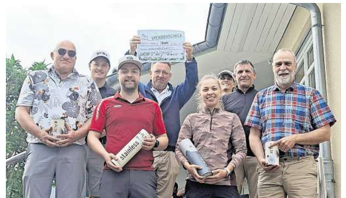
Strahlende Gewinner: Das Benefizturnier des Golfclubs Wolfsburg/Boldecker Land war ein Erfolg für alle Beteiligten.

Die Spendensumme trägt mit dazu bei, die Versorgung von krebserkrankten Menschen in Deutschland weiter zu verbessern. Die Deutsche Krebshilfe setzt die Mittel ein, um die Krebsbekämpfung auf vielen Ebenen voranzubringen. Sie fördert bundesweit den Aufbau moderner Versorgungsstrukturen wie Krebszentren, treibt die Forschung voran und informiert Menschen umfassend über Krebs und Möglichkeiten der Prävention. Das Benefizturnier in Bokendorf trägt entscheidend dazu bei, dass diese Arbeit weitergehen kann. Denn die gemeinnützige Organisation finanziert ihre Projekte ausschließlich aus Spenden und freiwilligen Zuwendungen.