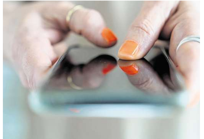
Ein wenig Tipparbeit - aber sie lohnt sich: In den Smartphone-Einstellungen sollte man unbedingt einmal den Bereichen einen Besuch abstatten, die mit Sicherheit und Datenschutz zu tun haben.

Der Browser etwa braucht aber nicht unbedingt Zugriff auf die Kamera, die Scanner-App muss den Standort nicht kennen und die kostenlose Spiele-App zum Zeitvertreib sollte sowieso nicht auf Kontakte, Kamera und Kalender zugreifen können. (dpa)