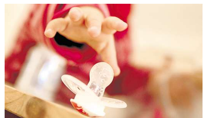
Die Stiftung Warentest hat die Sicherheit von 13 Schnullern unter die Lupe genommen - nicht in allen Fällen mit positivem Ergebnis.