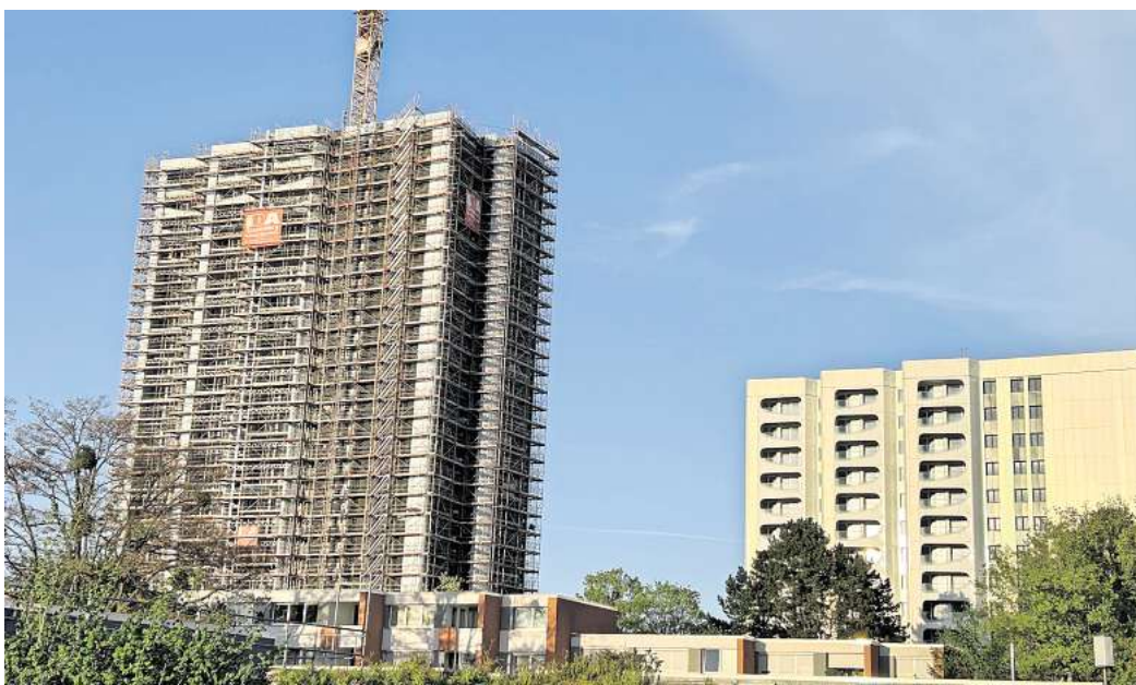
Deutlich sichtbar sind die Fortschritte beim Neuland-Großprojekt Don Camillo und Peppone.

Im vergangenen Jahr investierte die Neuland insgesamt rund 61 Millionen Euro in Neubau, Modernisierung und In-