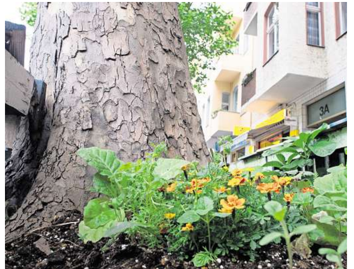
In Großstädten sieht man häufig kleine Beete mit hübschen Blumen um die Straßenbäume herum.

Tipp: Die Pflanzen um den Straßenbaum sollten nicht höher als 50 Zentimeter werden, damit sie die Sicht von Kindern und anderen Verkehrsteil nicht beeinträchtigen. (dpa)