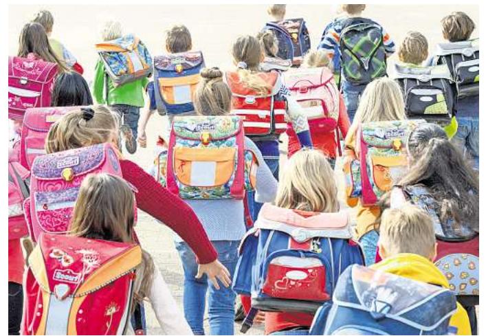
Weg frei für den Ganztags: Bis 2029 sollen alle Schulen in Wolfsburg ein Ganztagsangebot anbieten.

Rat entscheidet am 17. Juni – Umsetzung der Förderrichtlinie soll schrittweise erfolgen