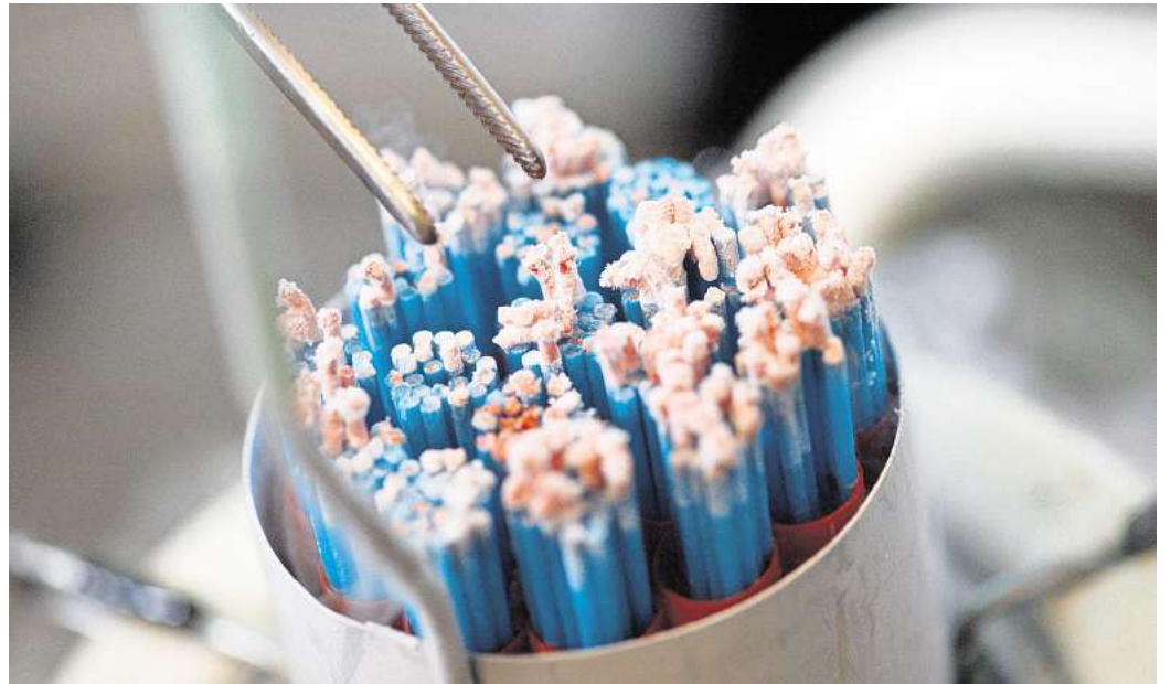
Kühlbehälter, heiß diskutiert: Wie viele Zusatzinfos zur Nutzung einer Samenspende stehen Gezeugten zu?

Auch für ihre persönliche Entwicklung seien die zusätzlichen Angaben nicht entscheidend, da sie bereits wisse, unter welchen Umständen sie gezeugt worden sei und dass es laut ihrer eigenen Recherche vermutlich 33 weitere Kinder gebe.