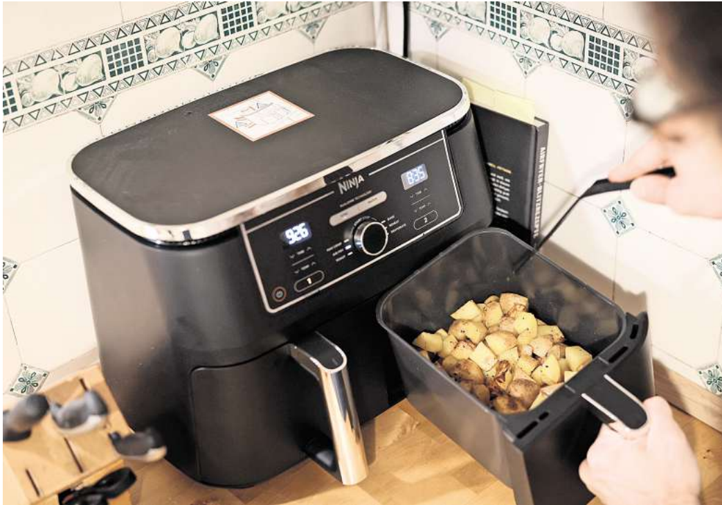
Gewürzmischungen, Schalen, vorgeschchnittene Papiere: Für Airfryer gibt es mittlerweile viele Zusatzprodukte.

Wer das Supermarktregal durchforstet, könne auch immer mehr Airfryer-Zubehör und -zutaten entdecken. Etwa spezielle Back- und Gewürzmischungen, Backpapier-Schalen, Öl-Sprays und sogar Backpulver. Und Aufbackbrötchen gibt es mittlerweile und weitere Sonder-Brötchen und -Brote stehen in den Startlächern. Doch lohnen sich die neuen Extra-Produkte auch für die hei-