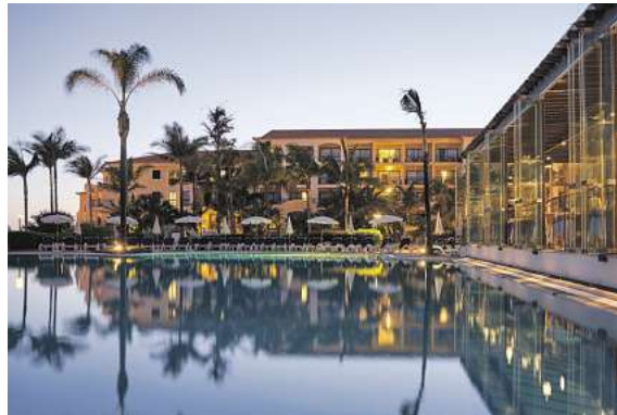
In allen Zielen stehen zahlreiche Hotellebnisse zur Auswahl – wie hier das 4,5* Premium Hotel Porto Mare by PortoBay auf Madeira.

Am Sonntag, 14.06. von 13 bis 18 Uhr auch telefonisch buchen! Tel.: 0531 - 2 43 71 - 0