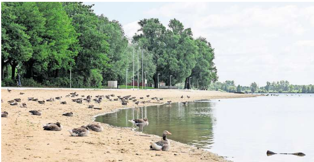
Graugänse hinterlassen an den Wolfsburger Seen ihre Spuren.

Auch am Allersee gehören die Vögel weiterhin zum gewohnten Bild. Doch dort fällt ein Unterschied auf: An den öffentlichen Badestrandabschnitten sind derzeit nur wenige Graugänse zu sehen. Vereinzelt liegt Gänsekot