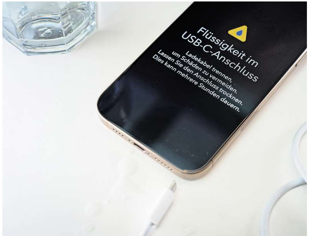
Keine Panik: Erscheint so eine Warnung, ist Geduld gefragt. Denn der Ladeanschluss lässt sich erst wieder nutzen, wenn er vollständig getrocknet ist.

Ist ein Tag vergangen und der Warnhinweis taucht immer noch auf, beziehungsweise die Entwarnung bleibt aus? Dann ist es sinnvoll, nach weiteren hersteller- und modellspezifischen Support-Hinweisen Ausschau zu halten oder gleich den Hersteller-Support zu kontaktieren.