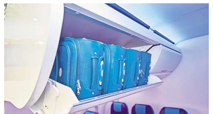
Bei einer Evakuierung muss Handgepäck zwingend im Flieger zurückgelassen werden. Es kann sonst die Notrutschen beschädigen und Passagiere verletzen.