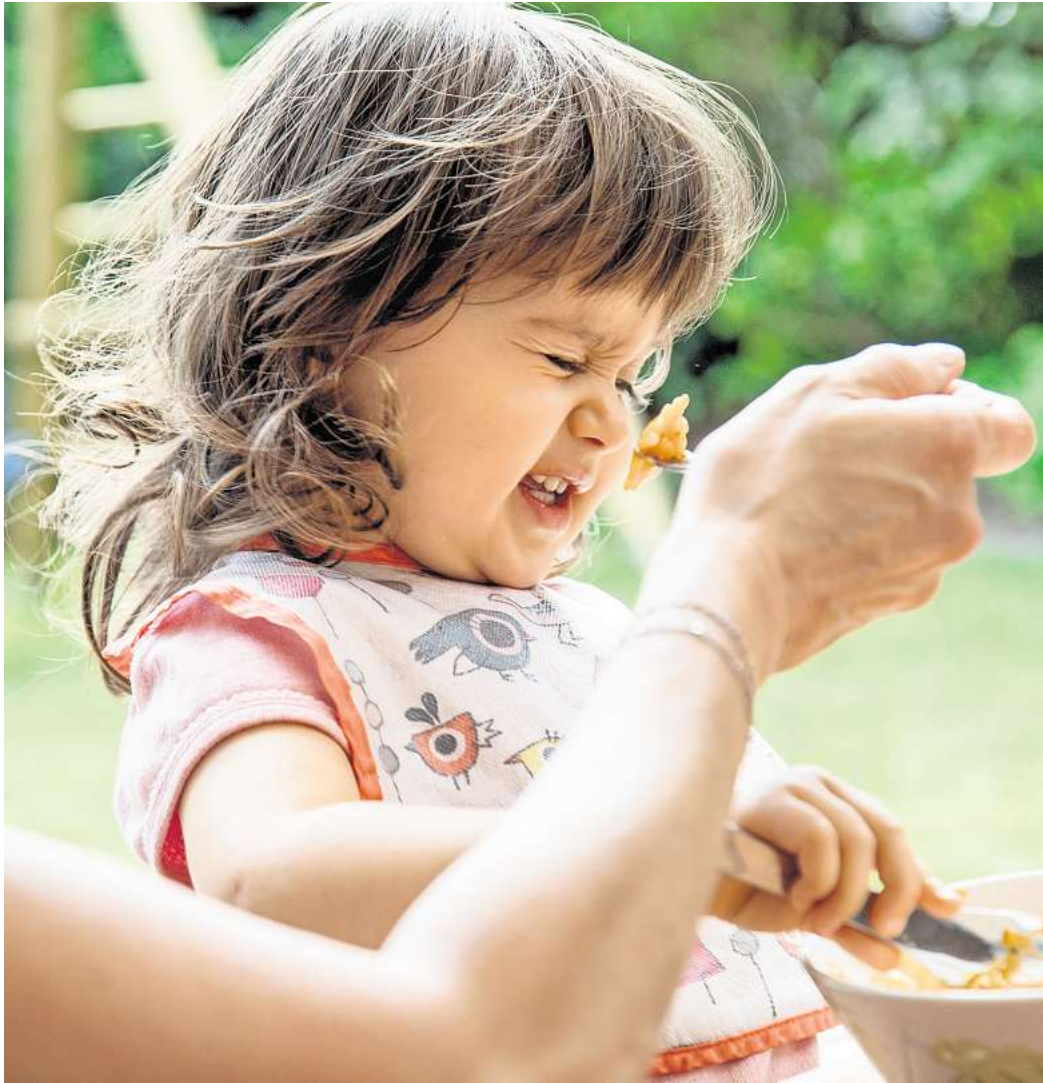
Meist endet die wählerische Essensphase bei Kindern ganz von allein.

Eltern müssen sich in dieser Phase in der Regel keine Sorgen machen, dass ihr Kind nicht genug isst oder zu wenige Nährstoffe bekommt, so das Netzwerk. „Lehnt ihr Kind bestimm-