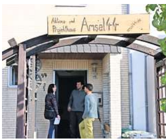
Das Aktions- und Projekthaus „Amsel 44“ in Wolfsburg: Hier hat die Flyer-Aktion ihren Ursprung.

Auf den ersten Blick auf einen der Flyer könnte man meinen, es handele sich tatsächlich um ein Stellenangebot. Das VW-Logo und der Slogan „Zwei Buchsta-