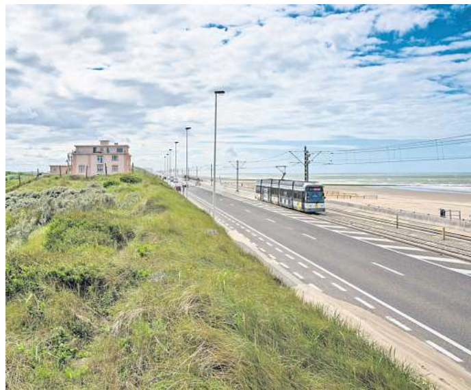
Die Küste Belgiens abfahren: Das geht günstig mit der Kusttram.

Architektur trifft auf Küstencharme: In Oostende lohnt sich ein Stopp, um durch die königliche Galerie zu schreiten, die direkt am Strand liegt. Gebaut wurde der pompöse Gang im Auftrag von König Leopold II. Der 400 Meter lange Prachtweg verbindet