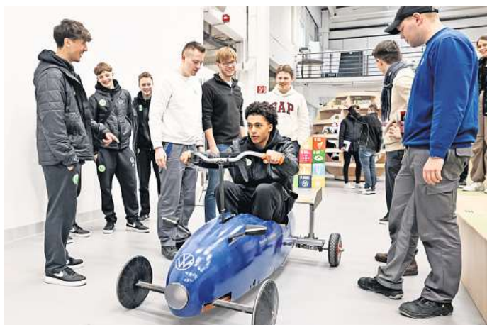
Besuch im Volkswagen-Werk: Die U16-Fußballer des VfL staunten über den Racing-Simulator der VW-Azubis.

Besuch im Volkswagen-Werk – U16-Kicker lernen Möglichkeiten der Berufsausbildung kennen