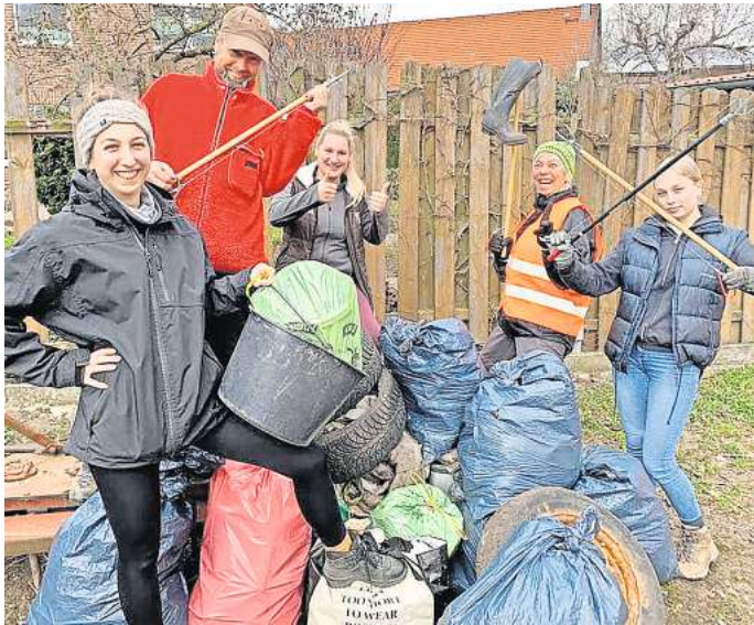
Frühjahrsputz: In Almke und Neindorf sind Bürgerinnen und Bürger zwischen dem 3. und 11. April zum Müllsammeln aufgerufen.

Dabei blickte sie mit großer Freude zurück auf die beiden Jahre, die bezeichnend waren für vorbildlichen Gemeinschaftssinn. „Zwei Wochen standen damals ganz im Zeichen intakter Gemeinschaften“, so die Ortsbürgermeisterin. Und nicht nur die Erwachsenen, sondern auch Scharen von Kindern zogen los, füllten die mitgebrachten Müll-