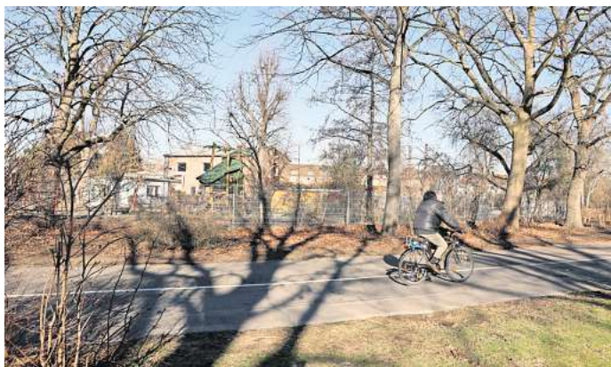
Der Kleistpark nahe der Goethestraße: Anwohner fühlen sich dort besonders in den Abendstunden nicht sicher. Die Politik möchte daher ein umfassendes Sicherheitskonzept.