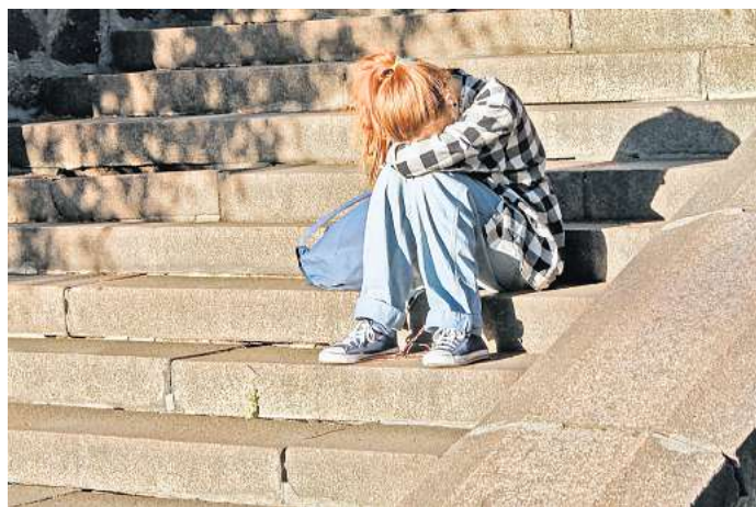
Viele Kinder und Jugendliche sind durch die Pandemie stark belastet.

RND. Finnen: „Von einer Stelle Schulpsychologie für 1000 Schülerinnen und Schüler, die für eine gute Unterstützung der Kinder und Jugendlichen notwendig ist, sind alle Bundesländer meilenweit entfernt.“ Die Spreizung reiche von eins zu 3114 bis zu einem Verhältnis von eins zu 9822.