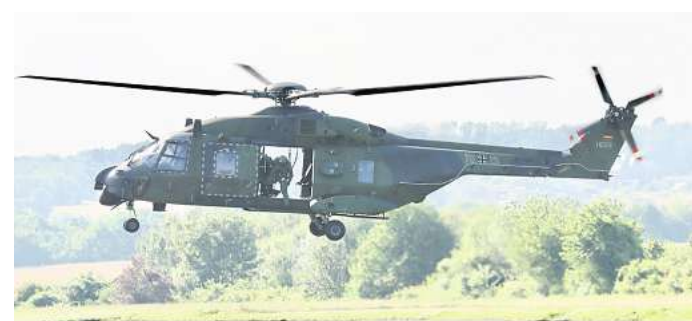
Symbolfoto: Über den USA ist erneut ein unbekanntes Flugobjekt abgeschossen worden. Das Pentagon betonte, noch lägen keine Informationen dazu vor, woher der Flugkörper stammte und was er zum Ziel hatte.

Wolfsburg. Das US-Militär hat am Sonntag ein weiteres nicht identifiziertes Flugobjekt abgeschossen. Das Pentagon betonte, noch lägen keine Informationen dazu vor, woher der Flugkörper stammte und was er zum Ziel hatte. Ominöse Flugobjekte über Nordamerika geben den USA und der Welt seit Tagen Rätsel auf – und sorgen zunehmend für Unruhe. Aus US-Regierungskreisen verlautete, dass das Objekt achteckig gewesen sei und hinabhängende Schnüre gehabt habe, jedoch keine Ladung erkennbar gewesen sei. Es sei in einer geringen Flughöhe von rund sechs Kilometern unterwegs gewesen, sagte eine Gewährsperson der Nachrichtenagentur AP. US-Kampffjets hatten bereits an den beiden Tagen zuvor zwei nicht näher identifizierte Flugobjekte abgeschossen