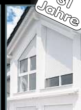
Fenster & Rollläden Schiebeanlagen Faltanlagen

Beratung in der Ausstellung oder bei Ihnen vor Ort, ausschließlich nach Terminvereinbarung mind. 22% RABATT