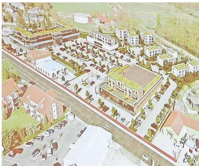
Das sind die Pläne für das Gebiet: „Östlich An der Meine“ in Vorsfelde: Vorn auf dem Bild ist Lidl zu sehen, im Hintergrund der geplante Aldi-Neubau mit der umstrittenen Wohnbebauung am Drömling.