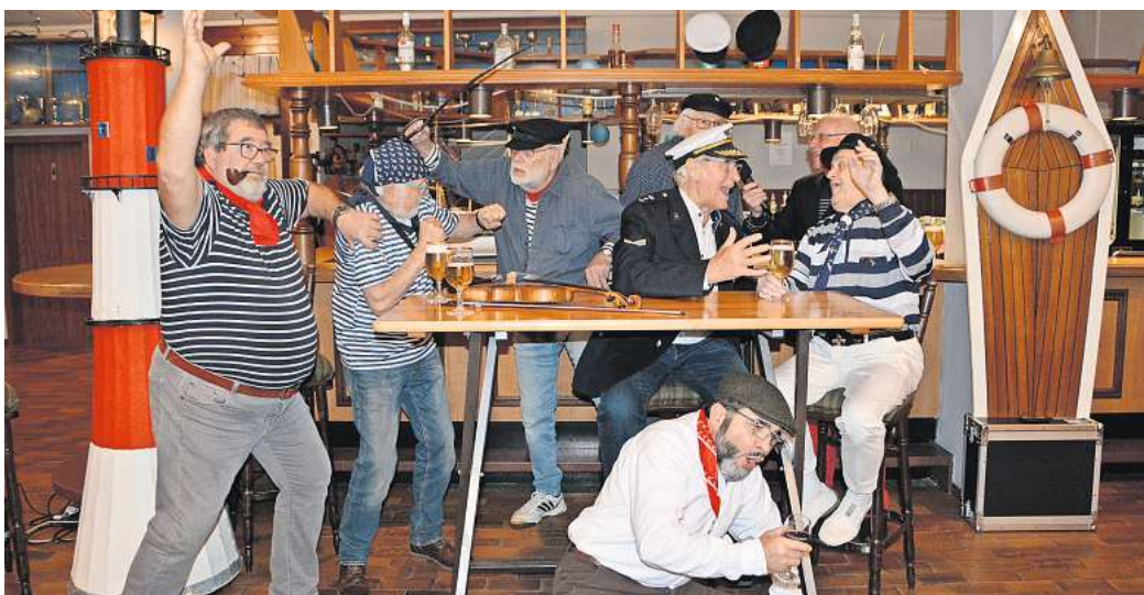
„Geschichten aus der Haifischbar“: Der Maritime Chor Wolfsburg zeigt erstmals ein Musical im Hallenbad.

Bei dem Format werden die Zuschauer in die Atmosphäre von Seemannsgeschichten, Liebe und Leid der Seeleute, garniert mit Witz und Humor entführt. Dafür haben die Wolfsburger die Kulisse einer typischen Hafenkneipe gebaut – angelehnt an die Kultsendung „Die Haifischbar“, die 1962 zum ersten Mal ausgestrahlt wurde.