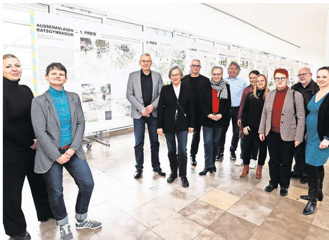
Die Schulhofflächen des Wolfsburger Ratsgymnasiums werden umgestaltet. Die Entwürfe sind in der Bürgerhalle des Rathauses ausgestellt.