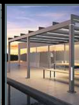
Terrassen- überdachungen Wintergärten Markisen