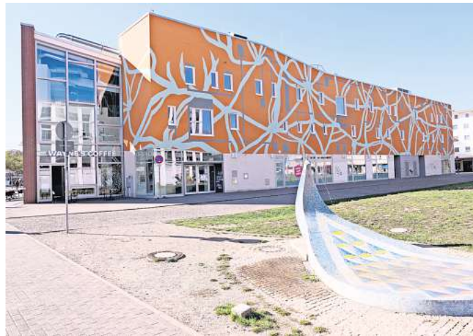
Die Wiese am Pfauenbrunnen: Hier wollen die Aktivisten im Mai campen.

Am Auftakt-Tag wollen die Aktivisten an der „Critical-Mass-Fahrradtour“ teilnehmen. In den Tagen danach sind Vorträge, Workshops, Konzerte und „kreative Aktionen“ geplant. Als Gäste sollen bereits das ehemali-