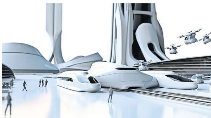
„Future of Motion“: Die Ausstellung in der Autostadt in Wolfsburg gibt einen Ausblick, wie die Mobilität von Morgen aussehen könnte.

Darüber hinaus verkörpern ausgewählte Fahrzeugexponate den Markenkern von „Driven by