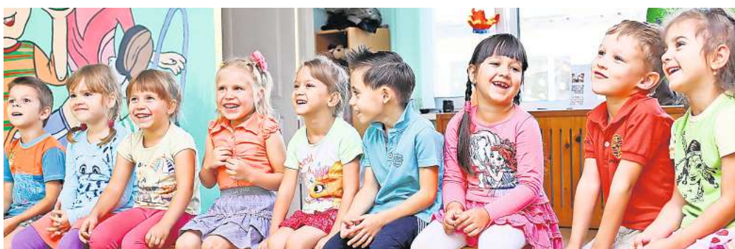
Betreuungsplatz in einer Kita: Bis zum 28. Februar können Eltern ihre Kinder in einer Wunscheinrichtung anmelden. Jedoch ist die Nachfrage nach Betreuungsplätzen hoch.

Aufgrund der hohen Nachfrage nach Betreuungsplätzen wird es gegebenenfalls nicht möglich sein, einen Platz in der Wunsch-Einrichtung zu bekommen. Die Stadt empfiehlt Eltern daher, die