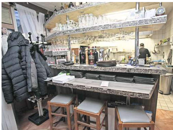
Lange Straße in Vorsfelde: Ein Einbrecher setzte sich in das Restaurant „Dolce Vita“ und trank reichlich Alkohol.

Der Wolfsburger setzte sich dann an den Tresen und trank reichlich Alkohol. „Eine Frau, die in der Nähe geparkt hatte und am Lokal vorbei lief, entdeckte den Einbrecher. Sie informierte dann die Polizei. Der