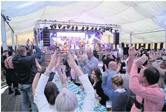
Hoch die Hände: Bei Roth Catering in Isenbüttel gibt's wieder Frühlingswiesn mit der Münchner Zwietracht.

Mittlerweile haben sich die Isenbütteler Frühlingswiesn zum größten Oktoberfest der Region etabliert, und daran dürfte die Band einen nicht unerheblichen Anteil haben: Die Münchner Zwietracht gehört nach eigenen Angaben zu den populärsten Ok-