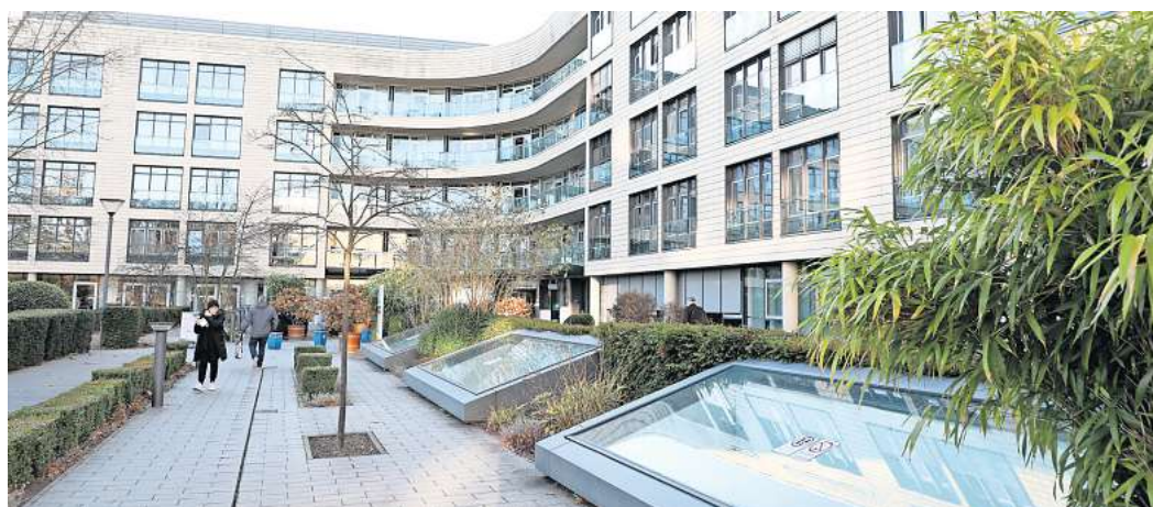
Das Klinikum Wolfsburg prognostiziert ein Defizit von 14,9 Millionen Euro für das Jahr 2023. Gestiegenen Kosten stehen gleichzeitig weniger Patienten gegenüber.