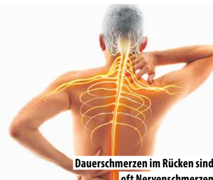
Dauerschmerzen im Rücken sind oft Nervenschmerzen

„Ich hatte Tag und Nacht Beschwerden in beiden Füßen, Brennen und Taubheitsgefühle“, beschreibt eine Schmerzgeplagte ihren Kummer. Ein anderer Betroffener erzählt, er habe mysteriöse „Schmerzen am ganzen Körper“. Wieder andere klagen über Schmerzen in Rücken und Nacken, die sogar nachts zum Problem werden: „Liegen ging gar nicht, ich musste im Sitzen schlafen, weil ich sonst nicht mehr aufkam.“ Auch wenn es so scheint, als würden die Betroffenen unter völlig verschiedenen Beschwerdebildern leiden, so steckt doch meist derselbe Auslöser dahinter: geschädigte oder gereizte Nerven! Die Folge sind sogenannte Nervenschmerzen.