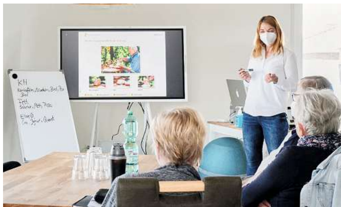
In Weyhausen: Individuelle Diabetes-Kurse.

Effektives Diabetesmanagement basiert auf drei Säulen: dem Wissen über die chronische Stoffwechselerkrankung, einer passenden Lebensweise und der inneren Einstellung. Gerade letzteres wird von Betroffenen zu oft unterschätzt: „Wer aus Unsicherheit mit zu vielen Verboten und Einschränkungen lebt, um seinen Diabetes im Griff zu haben – wer sich zum Beispiel aus Angst vor Unterzuckerung vor sportlicher Betätigung scheut