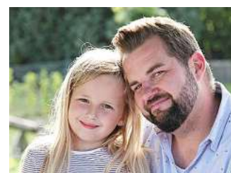
Auch Eltern von Kindern mit Diabetes bekommen hier Hilfe.