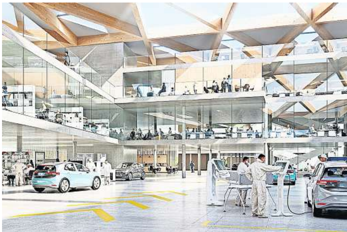
Campus Sandkamp: Auf dieser offiziellen Skizze ist zu sehen, wie verschiedene Abteilungen Hand in Hand an einem Ort arbeiten sollen.

Der neue Tiguan und der ID.3 sollen nach dem Werksurlaub vom Band rollen. Schon vorher will der VW-Vorstand bekannt geben, ob er das Projekt Trinity auf dem jetzigen Werksgelände oder in einer neuen Autofabrik in Warmenau verwirklichen will – Insider berichten, die Tendenz sei klar: Trinity – das Fahrzeug soll neue Maßstäbe mit Blick aufs autonome Fahren, Software und Ladedauer setzen – werde innerhalb des Werks gebaut. Auch