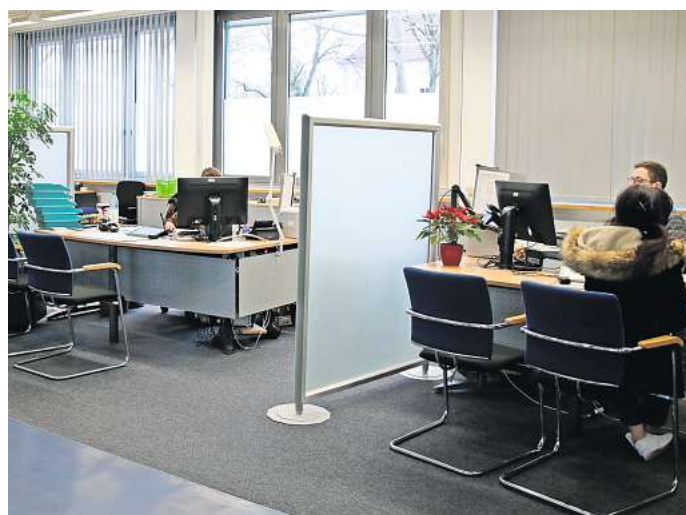
Einen Termin im Wolfsburger Rathaus kann man online buchen.

Wer einen Besuch bei den Bürgerdiensten plant, muss über die Online-Terminvergabe oder über das Service-Center (Rufnummer 115) einen Termin vereinbaren. Für das Anliegen „Kraftfahrzeugkennzeichen wegen Unleserlichkeit oder Beschädigungen ersetzen“ kann die Funktion beispielsweise genutzt werden. Auf der Website werden dann verschiedene Daten vorgeschlagen. Manchmal sind noch Zeiten am nächsten oder übernächsten Tag frei, manchmal aber auch erst in einigen Wochen. Das erlebte ein Leser, der sich bei der WAZ meldete. Er wollte online einen Termin buchen und ihm sei erst ein Termin