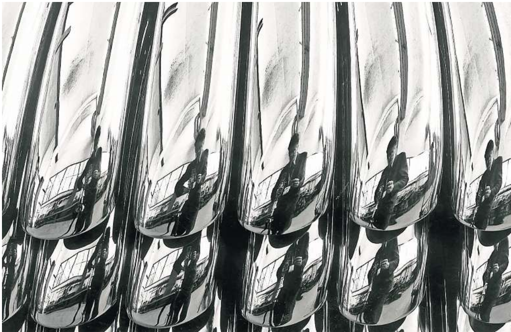
„Eine Woche im Volkswagenwerk“: So heißt die Bildserie von Peter Keetman, die 1953 im Volkswagenwerk entstand. Hier hat sich der Fotograf selbst in den Stoßstangen des Käfers abgelistet.

„Keetman war mit einem Gebrauchsgrafiker befreundet, der zu VW gefahren ist, in der Hoffnung einen Auftrag für Werbung zu bekommen. Keetman ist mitgefahren, weil er im Werk Aufnahmen von der Produktion des Käfers machen wollte“, sagt der Kurator des Kunstmuseums Wolfsburg, Dr. Holger Broeker. Volkswagen habe die Aufnahmen gestattet und dem Fotografen, der im Zweiten Weltkrieg ein Bein verloren hatte, für die Zeit der Aufnahmen einen jungen Mitarbeiter an die Seite gestellt. Keetman selbst berichtete später, dass er sich frei durchs Werk bewegen konnte und nur mit einer Rolleiflex, Filmen und einem Stativ und keinerlei Be-