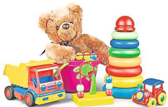
Der Termin für den Kiddy-Markt steht kurz bevor.

Weitere Infos gibt es im Internet unter www.nhvs-events.de .