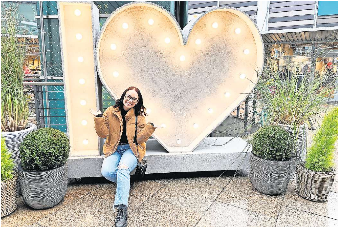
Halten auch Sie Ihren persönlichen Lieblingsplatz in Wolfsburg im Foto fest.

Direkt zur Aktion: Einfach den QR-Code mit dem Handy scannen.