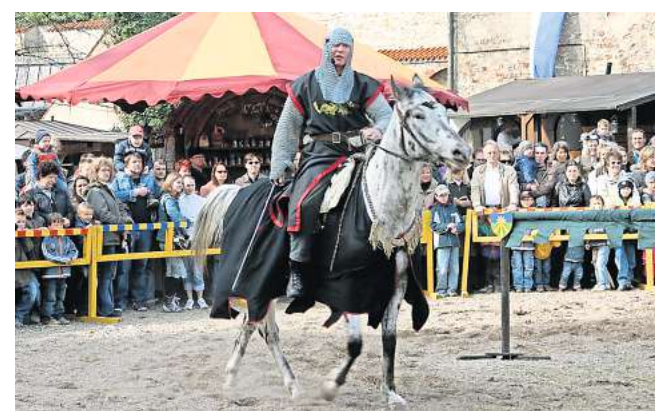
Beinahe wie im Mittelalter: Kostümierte Ritter werden ihre Kampfkünste in Shows präsentieren.