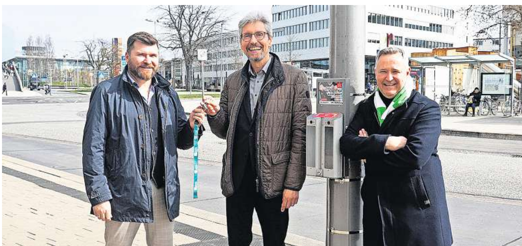
„Ballot Bins“: Sie sollen die Wolfsburger dazu animieren, die Innenstadt sauberer zu halten.

Verunreinigungen durch geworfene Zigaretten sind – nicht nur in Wolfsburg – ein großes Problem für die Umwelt, da die enthaltenen Giftstoffe zum Beispiel durch Regen ausgespült werden und so in das Grundwasser und die Gewässer gelangen. Dem will die WMG mit einer kreativen Idee begegnen: Die kompakten Zigarettenkästen verfügen über zwei getrennte Kammern, in die Zigarettenstummel eingeworfen werden können. Gleichzeitig werden Ab-