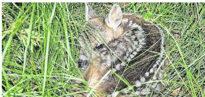
Die Brut- und Setzzeit bezeichnet den Zeitraum, in dem wildlebende Tiere wie etwa Rehe ihren Nachwuchs bekommen und aufziehen.

• Hunde an die Leine: Hunde werden von anderen Tieren immer als Bedrohung wahrgenommen und können für Jungtiere zu einer tödlichen Gefahr werden. In Niedersachsen gilt während der Brut-, Setz- und Aufzuchtzeit in der freien Landschaft eine Leinenpflicht für Hunde. Auch das Aufsammeln der Hinterlassenschaften und die Entsorgung der Tüte im Mülleimer sollte eine Selbstverständlichkeit sein.