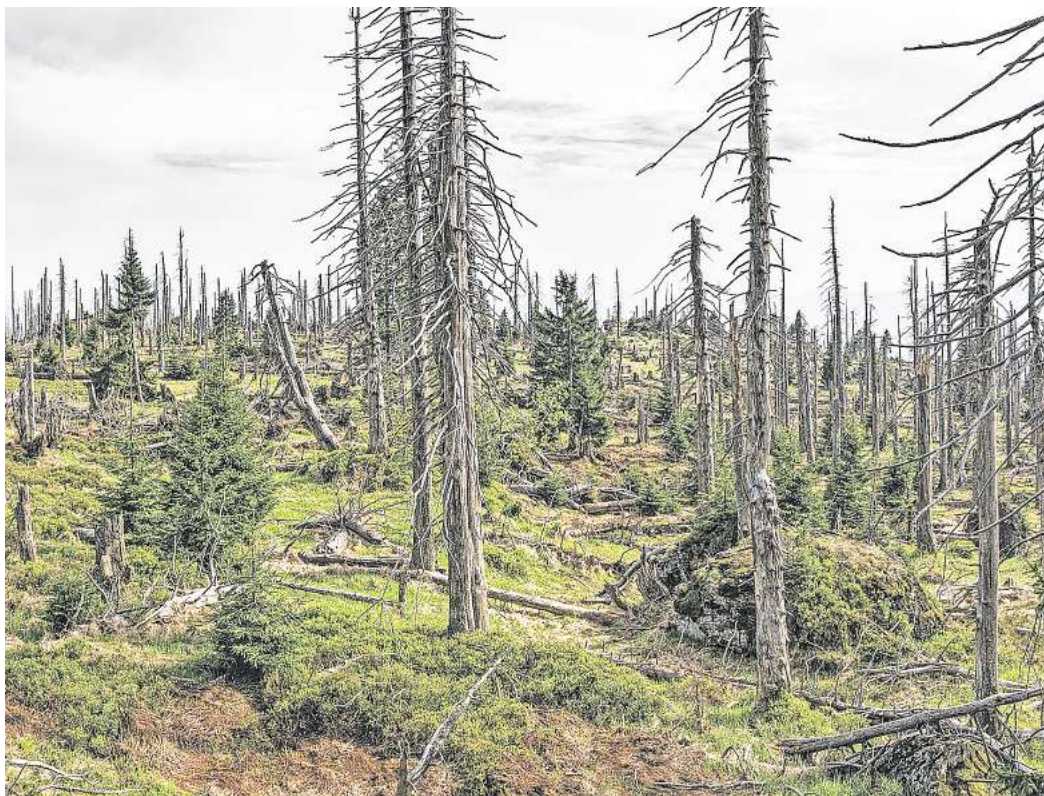
Der Zustand der deutschen Wälder bleibt angespannt. Wie besorgniserregend die Situation ist, zeigt die neue Waldzustandserhebung.

gleichen können. Die Erhebung wird laut Ministerium seit 1984 jährlich von den Ländern über ein Netz von Stichproben vorgenommen. Dabei wird der Zustand der Kronen taxiert und vier „Schadstufen“ zugeordnet. Das bundeseigene Thünen-Institut rechnet die Länderdaten zu einem deutschlandweiten Ergebnis hoch. Wald bedeckt rund ein Drittel der Fläche Deutschlands.