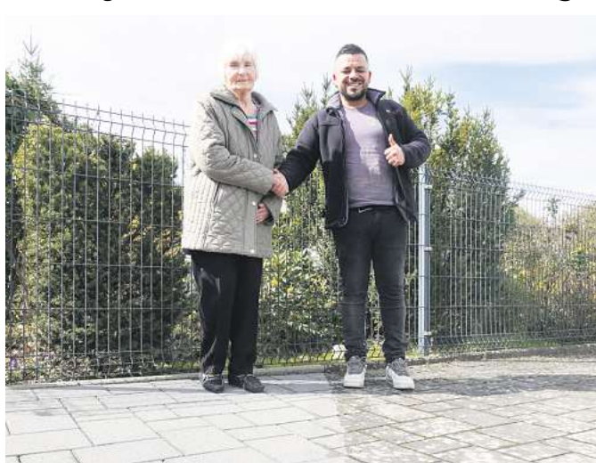
Eine mit dem Steinfresh®-Verfahren sanierte Pflasterung. Das geniale Pflegesystem verhindert Flechten und Schwarzalgen.