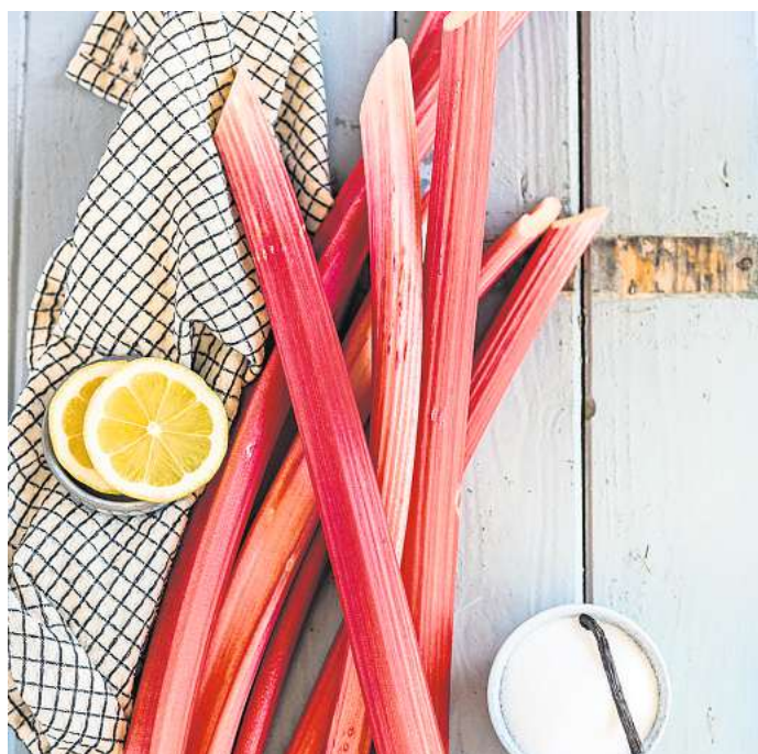
Sauer macht lustig: Rhabarber ist im Frühjahr ein beliebtes Saisongemüse.