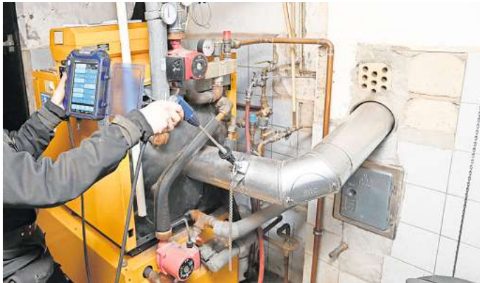
Das schrittweise Aus für Öl- und Gasheizungen ist beschlossene Sache: Was halten Sie davon?

Umfrage: Mitmachen und einen 50-Euro-Gutschein von Media Markt gewinnen