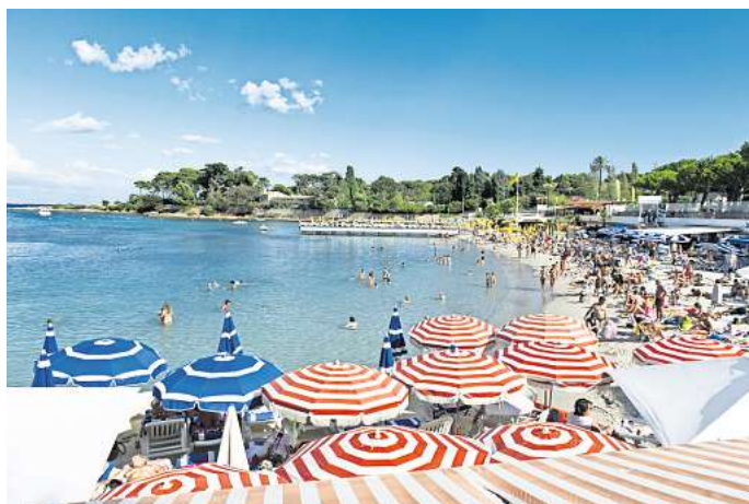
Der Plage de la Garoupe in Südfrankreich.

Wie aus einer Informationsbroschüre des Tower of London hervorgeht, sind Selfies im Martin Tower, in den Royal Chapels