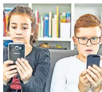
Kinder kommen immer früher mit digitalen Medien in Berührung. Eltern sollten sie bei der Mediennutzung begleiten und auch Vorbilder sein.

Kinder kommen heute immer früher mit digitalen Medien in Kontakt. Die Corona-Pandemie mit geschlossenen Kitas und Homeschooling hat diese Entwicklung vorangetrieben. Spielerisch ahmen sie Erwachsene und größere Geschwister nach. Schnell finden sie sich auf dem Tablet oder Smartphone zurecht, oft lange bevor sie in der Schule lesen, schreiben und rechnen lernen. Doch Vorsicht: Nachahmung ist nicht gleichzusetzen mit Beherrschung. Entscheidend