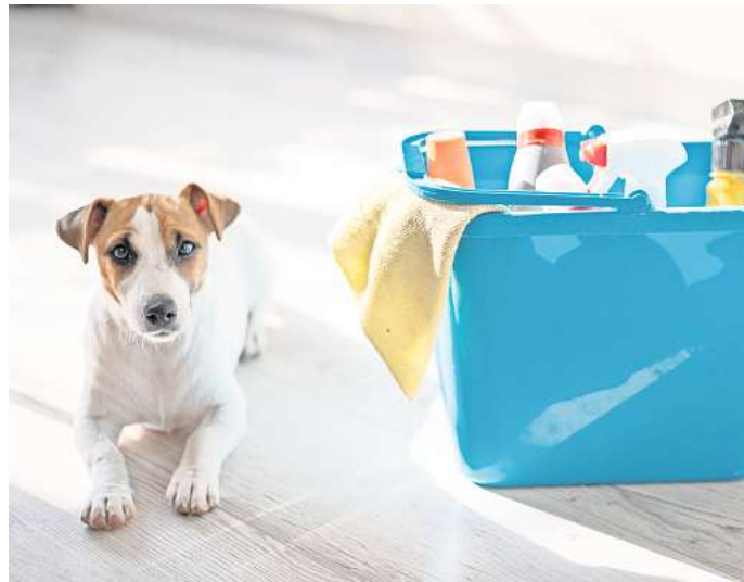
Fast jedes Putzmittel stellt eine potenzielle Gefährdung für Hunde dar.