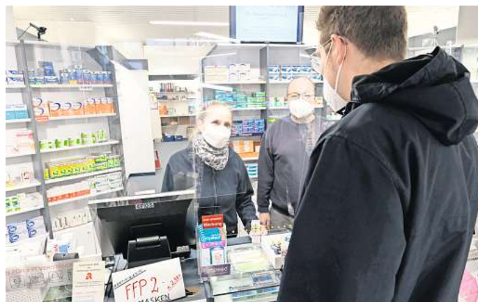
Wolfsburg: Auch in der Sonnen-Apotheke sind die Antibiotika knapp.

Dem Bundesverband der Pharmazeutischen Industrie (BPI) zufolge stammen 80 Prozent der hierzulande verwendeten Antibiotika aus China. Aktuell gebe es in Deutschland nur noch einen Hersteller, der Antibiotika-Säfte produziert. Die Produktion sei nicht mehr produktiv gewesen, daher hätten