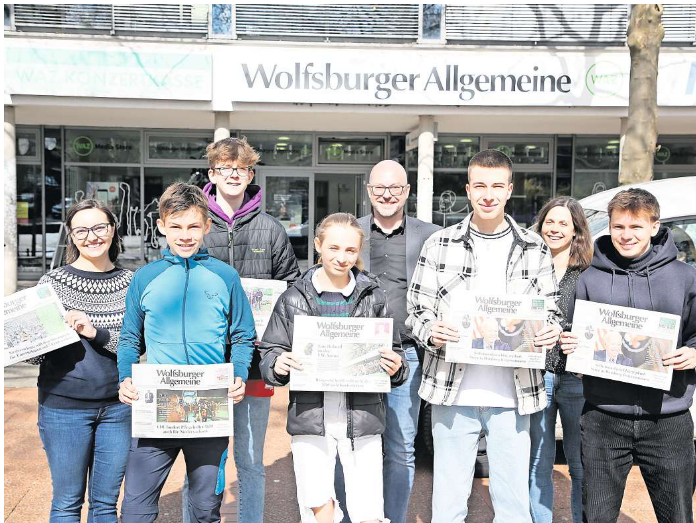
Zukunftstag bei der WAZ: Fünf Jugendliche besuchten die Lokalredaktion und bekamen einen Einblick.