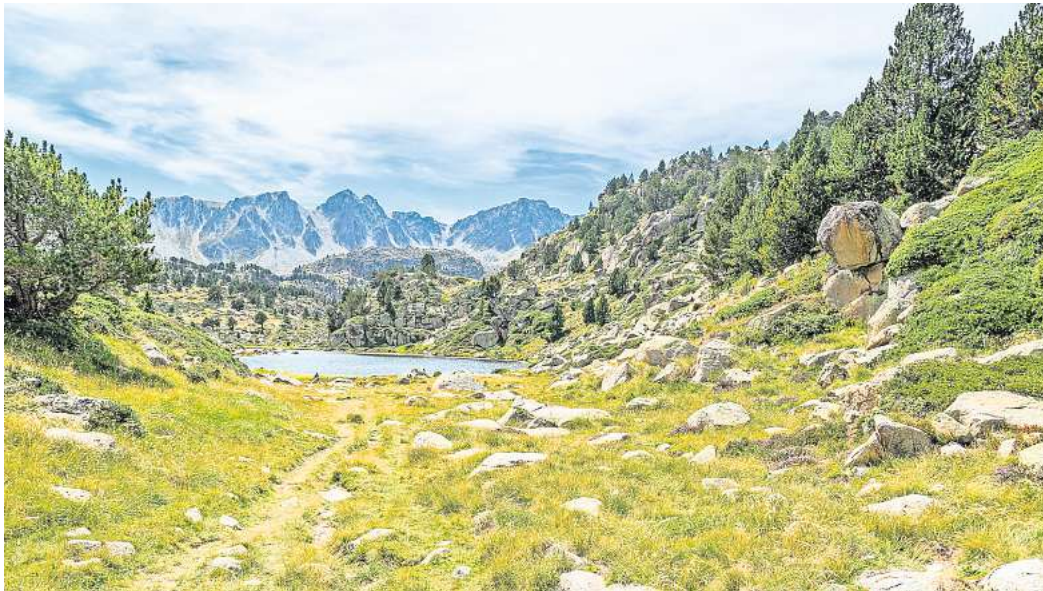
Malerische Pyrenäen: Im Zwergstaat Andorra gibt es großartige Berglandschaften.

Das wiederum macht Andorra als Wohnsitz für viele wohlhabende Menschen attraktiv. Und Reisende freuen sich über die ge-