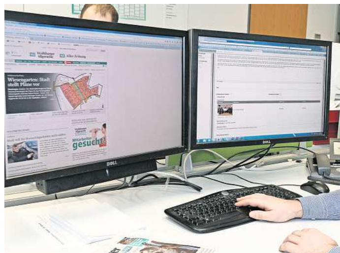
Würden Sie gerne in einer Vier-Tage-Woche arbeiten?

Direkt zur Umfrage: Einfach den QR-Code mit dem Handy scannen.