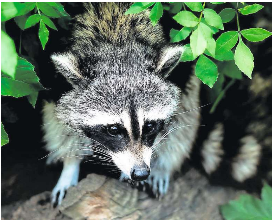
Problem Waschbär: Auch wenn er putzig aussieht, gefährdet er doch heimische Arten.