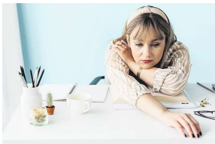
Auch im privaten Kontext gibt es das Gefühl des „Ausgebranntseins“.