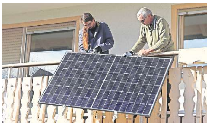
Photovoltaik ist auch in Wolfsburg ein großes Thema. Inzwischen gibt es auch Lösungen für Mieter und Wohnungseigentümer.

Diese sogenannten Mini-PV-Anlagen verfügen über bis zu vier Solarmodule, eine Leistung