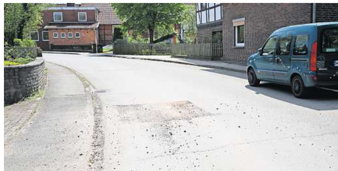
Geflickte Straße: Die Spuren des Glasfaser-Ausbaus sind in Mörse noch zu sehen.

damit nicht so recht überzeugen. Es gebe in Kästorf und Warmenau bereits eine zeitliche Verschiebung um ein Jahr wegen „Missverständnissen“. Stadt und Deutsche Glasfaser würden sich dabei gegenseitig die Schuld geben. „Bis Ende des Jahres sollten wir Glasfaser haben, das sehe ich noch nicht so“, sagte Garippo. Hofschröder versprach, das Thema in einer der nächsten Sitzungen des Strategieausschusses noch einmal aufgreifen zu wollen.