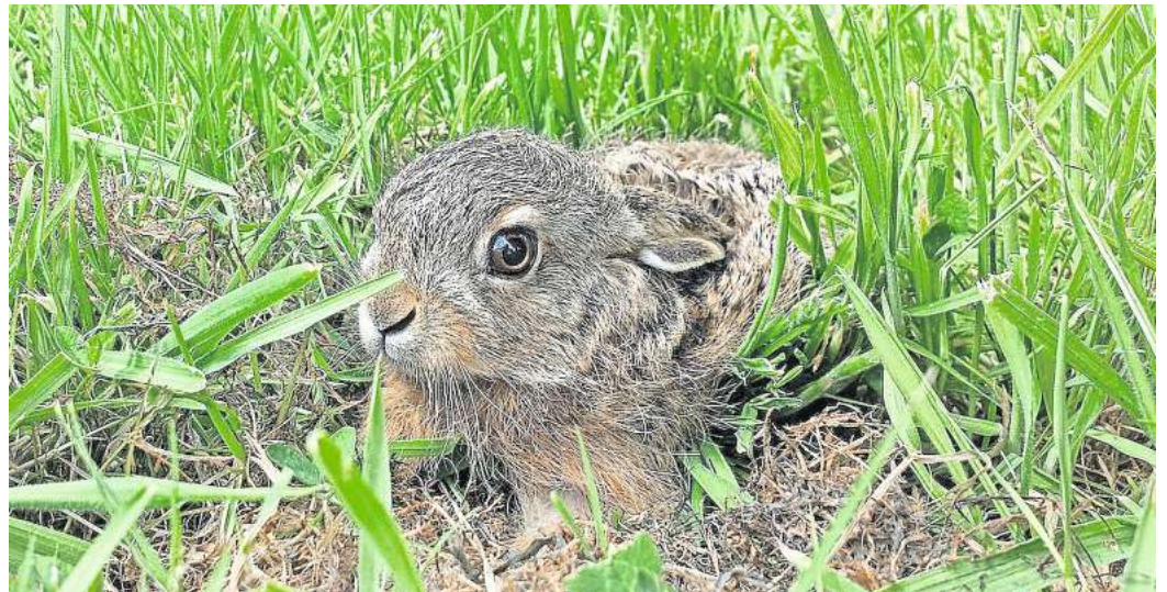
Hasenkinde kommen vollständig entwickelt zur Welt.

Die voreilige Hilfeleistung vieler Menschen bedeutet aber nicht sofort, dass das Hasenkind dadurch zum Waisen wird, weil die Mutter sie aufgrund ihres veränderten Geruchs abstößt. „Hasen können sogar noch am Folgetag