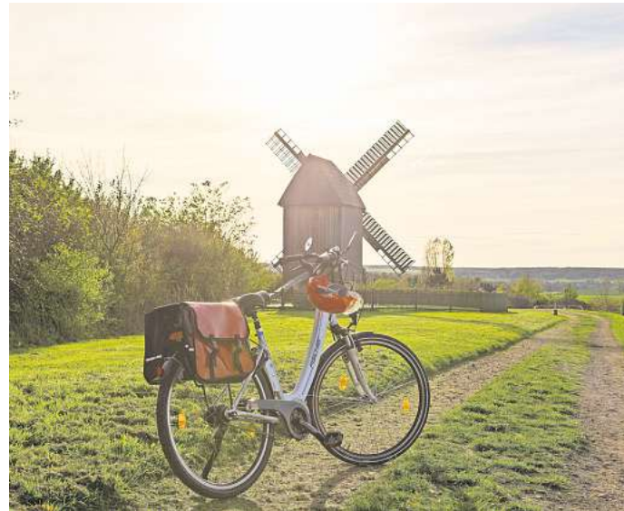
Neue Orte mit dem Fahrrad entdecken? Das geht in Deutschland ganz hervorragend!