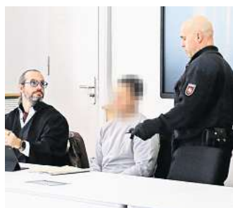
Ein 18-jähriger Wolfsburger stand vor Gericht.

Im Vorfeld hatte es in dem Verfahren auch ein psychiatrisches Gutachten gegeben. Die Staatsanwaltschaft hatte sechs Jahre und neun Monate Jugendstrafe und keine Unterbringung gefordert. Das Urteil ist noch nicht rechtskräftig. Der junge Mann hatte im November 2022 versucht, seinen besten Freund und dessen Freundin mit einem Messer im Schlaf zu töten.