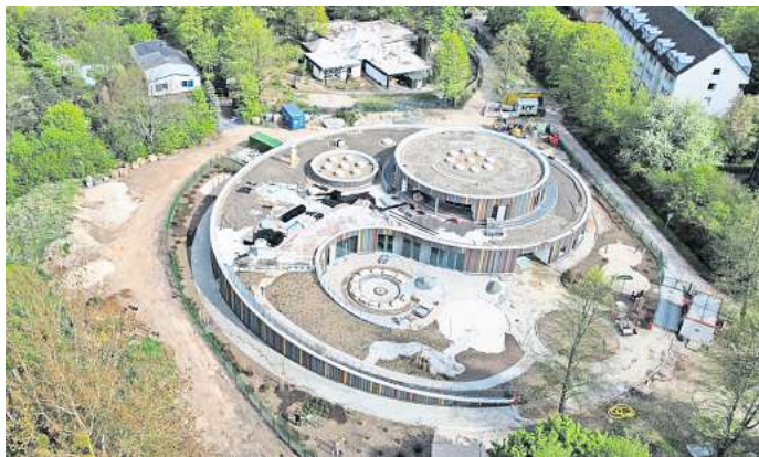
Die Arbeiten am neuen Domizil der Vorsfelder St. Petrus-Kita laufen auf Hochtouren.