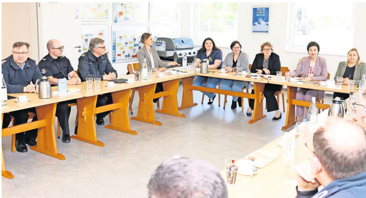
Blau-licht-Konferenz: Innenministerin Daniela Behrens unterhielt sich mit den Feuerwehrkameraden aus Wolfsburg.

Die Innenministerin kennt die Problematik. „Die Zuteilung war keine gute Entscheidung. Zudem wurden während der Pandemie viele Lehrgänge digital angeboten und daher müssen auch noch einige nachgeholt werden“, berichtete Behrens.