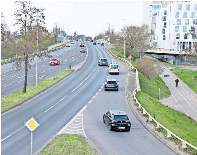
Berliner Brücke: Die Politik will einen funktionalen Anbau mit besserer Verkehrsanbindung.

Wie eine solche Vollsperrung verhindert werden soll, erläuterte Oliver Iversen, Leiter des Geschäftsbereichs Straßenbau. Die neue Brücke soll aus zwei getrennten Überbauten bestehen. Zunächst soll auf der Seite der Autostadt die erste Hälfte der neuen Brücke gebaut werden. Währenddessen soll die alte Berliner Brücke weiterhin nutzbar sein. Sobald die erste Hälfte der neuen Brücke steht, soll der Verkehr „auf kurzem Weg“ auf den Überbau umgeschwenkt werden. Im nächsten Schritt will die Stadt die alte Brücke abreißen und an der Stelle den zweiten Teil der neuen Brücke bauen. Sobald dieser fertig ist, will die Verwaltung die zuerst gebaute Hälfte an die zweite Hälfte herschieben. Der Verkehr soll wie derzeit über