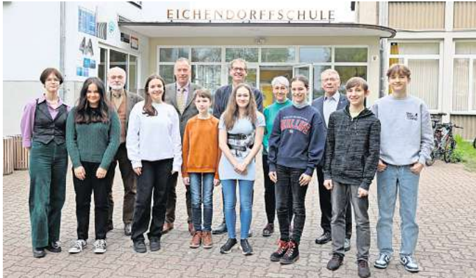
Eine Schülergruppe der Eichendorffschule besuchte Irlands einzigen deutschen Soldatenfriedhof. Mit angebrachten QR-Codes möchten sie auf einzelne Schicksale der dort Begrabenen aufmerksam machen.