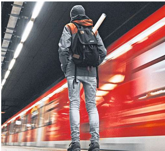
Vor allem für Pendler könnte sich das Deutschlandticket lohnen.

Deutschlandticket ist eine Subvention von unten nach oben.“ Es verbillige vor allem die bestehenden Nahverkehrsabos von Gutverdienern aus den Vororten. Wer von dort mit dem Auto zur Arbeit fahre, werde sich zudem nicht umstellen. „In diesen Kreisen heißt es: Wenn ich nicht direkt im Einzugsbereich eines Schnellbahnhofs wohne, fahre ich lieber mit dem Auto zur Arbeit. Auf jeden Fall nicht mit dem Bus zum Bahnhof“, sagte Böttger dem Blatt.