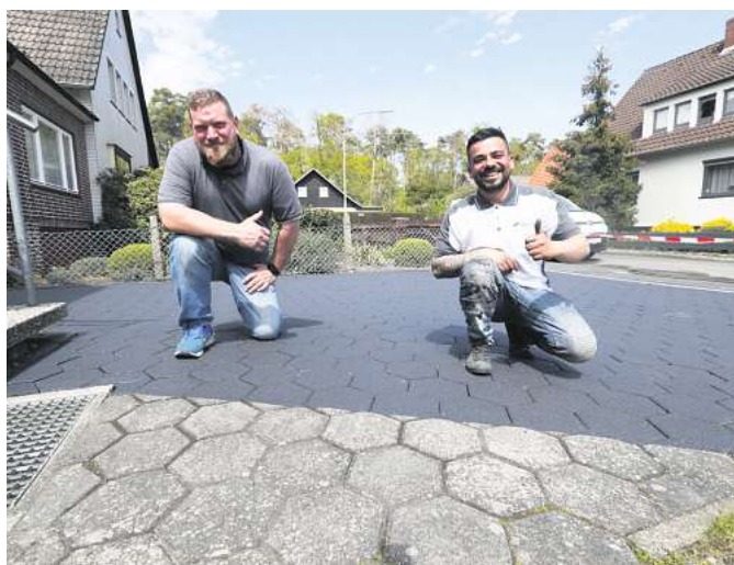
Eine mit dem ‚Steinfresh®‘-Verfahren sanierte Pflasterung. Das geniale Pflegesystem verhindert Flechten und Schwarzalgen.