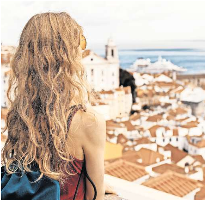
Erschwingliche Hauptstadt: Laut einer Analyse ist Lissabon die günstigste europäische Stadt für einen Kurztrip.

Dazu gehören unter anderem die Preise für eine Tasse Kaffee, eine Flasche Bier, ein Drei-Gänge-Menü für zwei Personen mit einer Flasche Hauswein, zwei Übernachtungen in einem Drei-Sterne-Hotel für zwei Personen, Ticket für den Nahverkehr und Eintrittspreise für die Top-Touristenattraktionen. Aus den zusammengerechneten Kosten