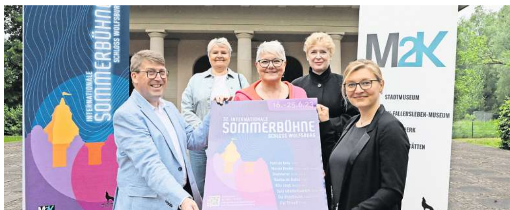
Internationale Sommerbühne im Barockgarten: Die Veranstalter und Unterstützer haben das Programm vorgestellt.

Selbstverständlich darf er nicht fehlen: Einen besonderen Zauber entfaltet am 18. Juni der Auftritt von fast 500 Kindern aus 26 Kindertagesstätten in Zusammenarbeit mit der Musikschule der Stadt Wolfsburg. Der Eintritt zum Konzert „Kita singt“ ist frei.