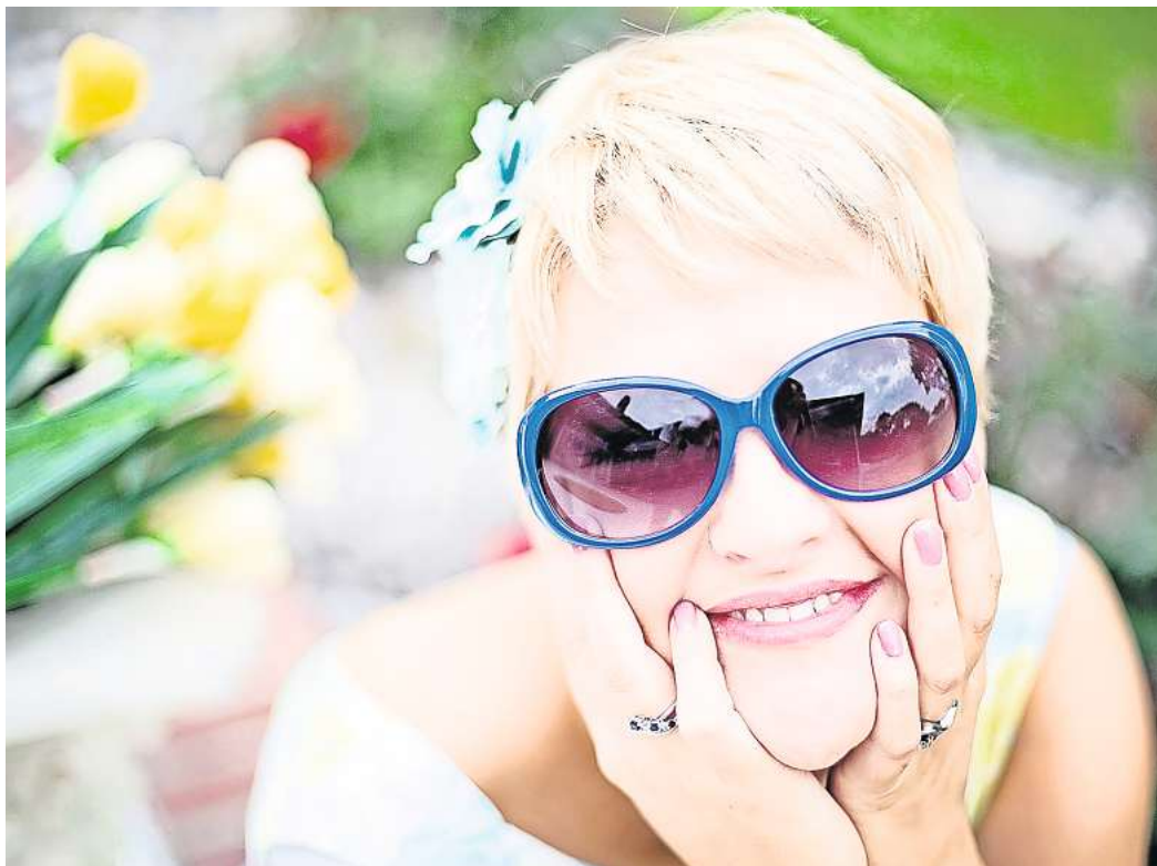
Ein cooler Look reicht nicht: Eine gute Sonnenbrille muss mehr können, als das Gesicht zu schmücken.

Nicht zuletzt erhöht auch eine gute Passform den Schutz. Im Idealfall sitzt die Brille gut und deckt die Augen ab, reicht bis zu den Augenbrauen und seitlich bis zum Gesichtsrand. Wer auf Nummer sicher gehen möchte, sollte seine Sonnenbrille im Fachhandel kaufen. Hier können auch ältere Modelle vom Optiker auf ihre Schutzwirkung vor UV-Strahlen überprüft werden.