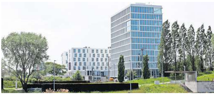
Neuer Mieter im „Berliner Haus“: Der IT-Dienstleister T-Systems zieht in den Maybachweg.

Im Mai 2020 wurde der Grundstein für das Immobilienprojekt auf dem früheren Billen-Grundstück gelegt, die Stadt sprach gar von einem neuen Wolfsburger Wahrzeichen. Beim Richtfest im Juni 2021 hieß es, das Hochhaus solle nur der Anfang für ein gänzlich neues Erscheinungsbild der Dieselstraße sein. Unter anderem ist in der