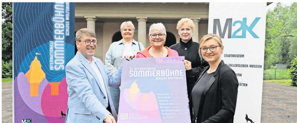
Internationale Sommerbühne im Barockgarten: Die Veranstalter und Unterstützer haben das Programm vorgestellt.

Selbstverständlich darf er nicht fehlen: Einen besonderen Zauber entfaltet am 18. Juni der Auftritt von fast 500 Kindern aus 26 Kindertagesstätten in Zusammenarbeit mit der Musikschule der Stadt Wolfsburg. Der Eintritt zum Konzert „Kita singt“ ist frei.