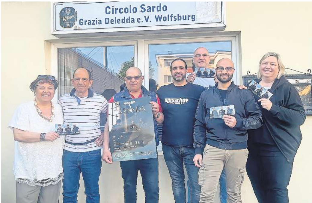
Hier spielt die Musik: Im Musikhof Wolfsburg tritt am 3. Juni die italienische Band Tazenda auf.

Tazenda ist eine Band aus Sardinien, die einen sehr melodischen Rock mit anspruchsvollen, zum Teil kritischen, vor allem aber sehr poetischen Texten in sardischer und italienischer Sprache spielt. Dabei fusioniert die Gruppe Elemente der traditionellen sardischen Musik mit Rock und zählt so zu den individuellsten Vertretern der italienischen Rockmusik. Bekannt aus den berühmten Festivals von Sanremo gilt die Band mittlerweile als das musikalische Aushängeschild Sardinien. Auch für das leibliche Wohl ist gesorgt: Italienische Speisen gibt es direkt im Musikhof von Mary's Catering.