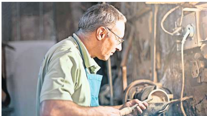
Ist das Rentensystem langfristig finanzierbar?