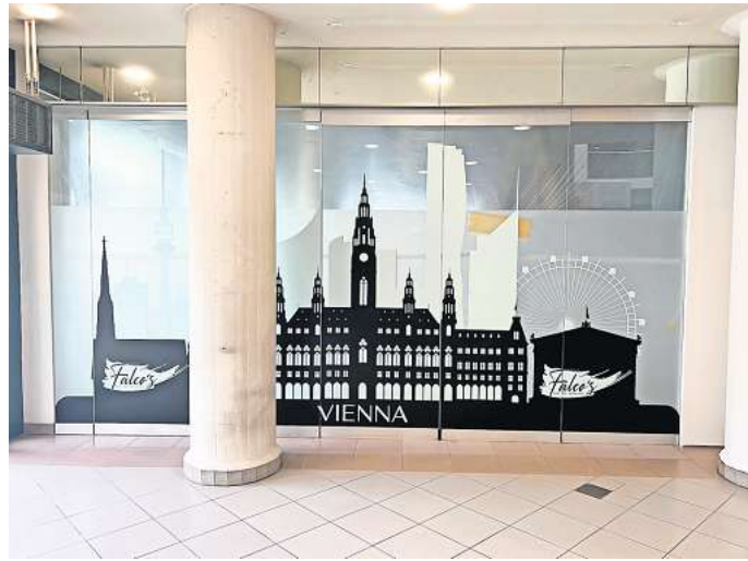
Ein bisschen Wien in Wolfsburg: Am 17. Juni eröffnet das Falco's im Südkopf-Center.

Ein besonderes Highlight soll das „Falco's-Menü“ werden – ein