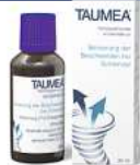
Abbildung Betroffenen nachempfunden

TAUMEA. Wirkstoffe: Anamirta cocculus Dil. D4, Gelsemium sempervirens Dil. D5. TAUMEA wird angewendet entsprechend dem homöopathischen Arzneimittelbild. Dazu gehört: Besserung der Beschwerden bei Schwindel. www.taumea.de • Zu Risiken und Nebenwirkungen lesen Sie die Packungsbeilage und fragen Sie Ihren Arzt oder Apotheker. • PharmaSGP GmbH, 82166 Gräfelfing