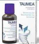
Abbildung Betroffenen nachempfunden

TAUMEA. Wirkstoffe: Anamirta cocculus Dil. D4, Gelsemium sempervirens Dil. D5. TAUMEA wird angewendet entsprechend dem homöopathischen Arzneimittelbild. Dazu gehört: Besserung der Beschwerden bei Schwindel. www.taumea.de • Zu Risiken und Nebenwirkungen lesen Sie die Packungsbeilage und fragen Sie Ihren Arzt oder Apotheker. • PharmaSGP GmbH, 82166 Gräfelfing