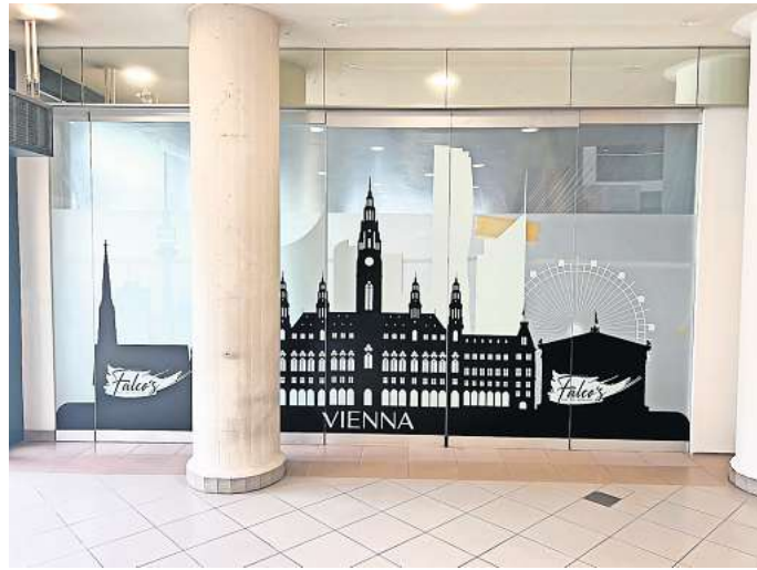
Ein bisschen Wien in Wolfsburg: Am 17. Juni eröffnet das Falco's im Südkopf-Center.

Ein besonderes Highlight soll das „Falco's-Menü“ werden – ein