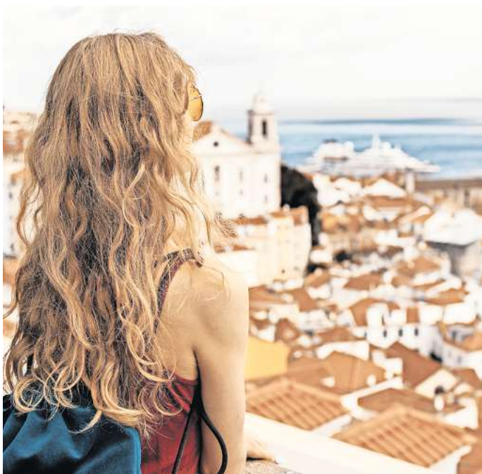
Erschwingliche Hauptstadt: Laut einer Analyse ist Lissabon die günstigste europäische Stadt für einen Kurztrip.

Dazu gehören unter anderem die Preise für eine Tasse Kaffee, eine Flasche Bier, ein Drei-Gänge-Menü für zwei Personen mit einer Flasche Hauswein, zwei Übernachtungen in einem Drei-Sterne-Hotel für zwei Personen, Ticket für den Nahverkehr und Eintrittspreise für die Top-Touristenattraktionen. Aus den zusammengerechneten Kosten