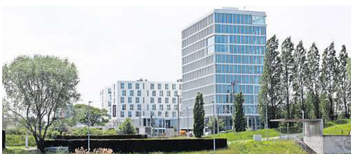
Neuer Mieter im „Berliner Haus“: Der IT-Dienstleister T-Systems zieht in den Maybachweg.

Im Mai 2020 wurde der Grundstein für das Immobilienprojekt auf dem früheren Billen-Grundstück gelegt, die Stadt sprach gar von einem neuen Wolfsburger Wahrzeichen. Beim Richtfest im Juni 2021 hieß es, das Hochhaus solle nur der Anfang für ein gänzlich neues Erscheinungsbild der Dieselstraße sein. Unter anderem ist in der