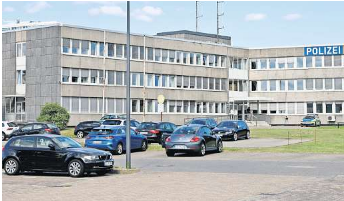
In die Jahre gekommen: Das 1971 errichtete Gebäude der Polizeiinspektion Wolfsburg-Helmstedt ist marode.

Für die Sanierung der Inspektion Wolfsburg-Helmstedt wären laut des niedersächsischen Finanzministeriums 1,725 Millionen Euro notwendig. Die sogenannten „Baubedarfsnachweise“ für die Polizeireviere in Niedersachsen summieren sich auf insgesamt 186 Millionen Euro. Zuerst abgearbeitet werden die Gebäude mit dem höchsten Sanierungsbedarf. Allein für das marode Kommissariat in Peine hat der Landtag jüngst zehn Millionen