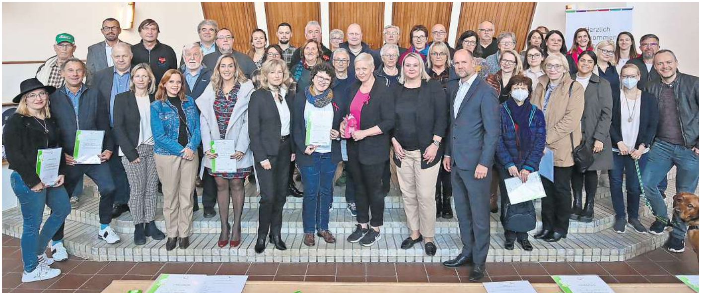
Gewonnen hatten sie am Ende alle: Glückliche Gesichter gab es bei den Vertretern der teilnehmenden Projekte bei „Gemeinsam helfen 2022“ im Rahmen der Preisübergabe in der Heilig-Geist-Kirche.