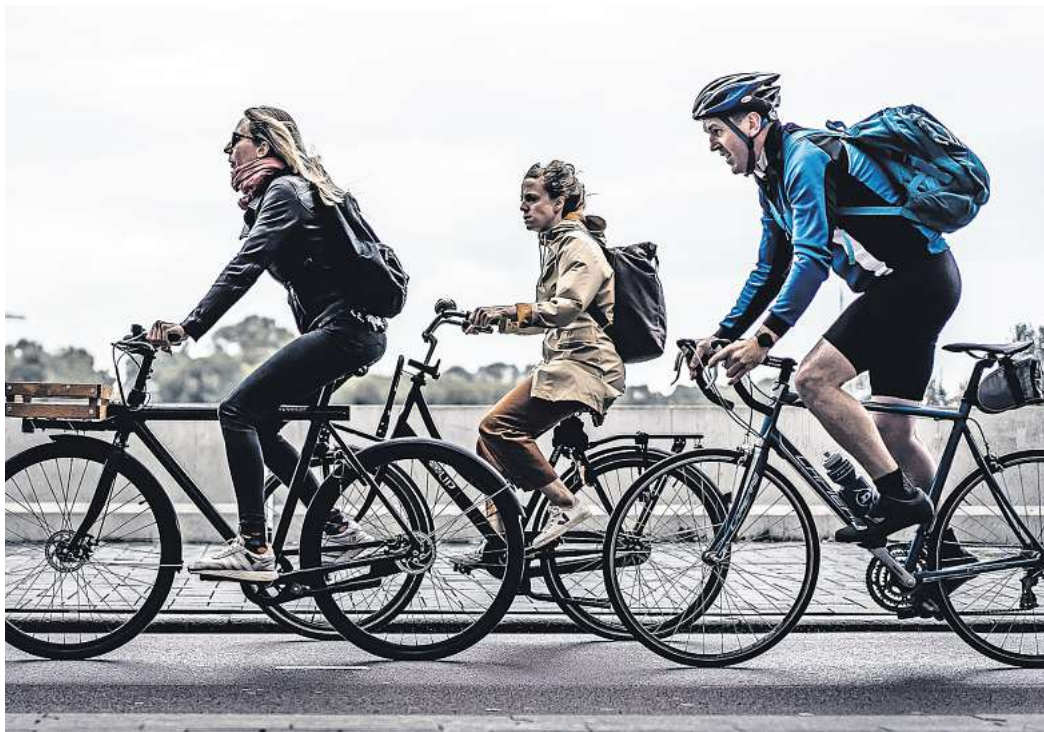
Die gravierenden Lieferengpässe im Fahrradhandel sind allmählich Geschichte – die hohe Nachfrage allerdings auch.

Vor allem bei E-Bikes und Lastenrädern seien die Aussichten gut, sagt der Verbandssprecher. „Im Bereich Mountainbikes sind aktuell 90 Prozent der verkauften Räder E-Mountainbikes.“ Bei Lastenrädern wirke zwar zunächst der Anschaffungspreis hoch, die laufenden Kosten seien aber deutlich geringer als etwa bei einem Auto.