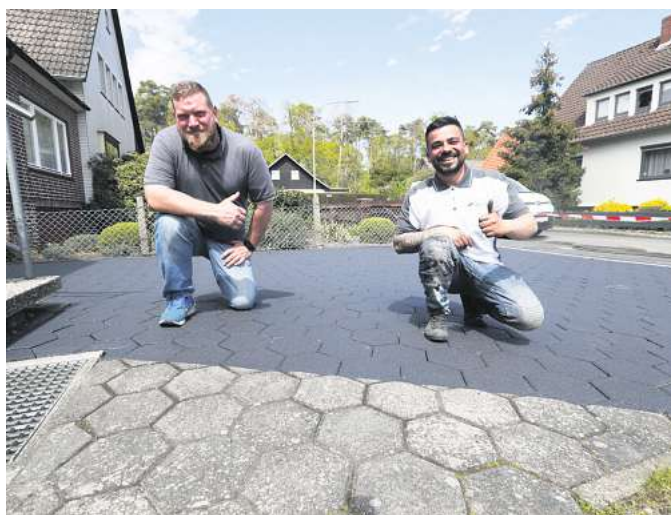
Eine mit dem ‚Steinfresh®‘-Verfahren sanierte Pflasterung. Das geniale Pflegesystem verhindert Flechten und Schwarzalgen.