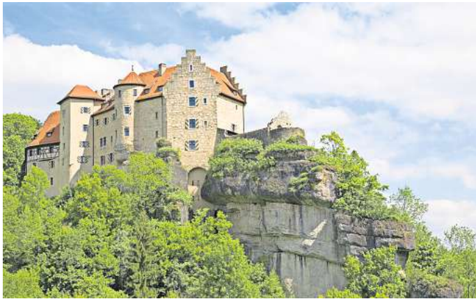
Auf Burg Rabenstein werden die alten Gemäuer bei zahlreichen Veranstaltungen zum Leben erweckt. Im integrierten Hotel kannst du übernachten.

Am Teufelsloch, das Einheimische gern als Tor zur Unterwelt bezeichnen, geht es in den Berg hinein. Mit einer Gesamtlänge von 3000 Metern ist die Teufelshöhle bei Pottenstein eine der größten Höhlen der Fränkischen Schweiz. In der Unterwelt der Schauhöhle warten imposante Höhlenräume, die durch schmale Gänge miteinander verbunden sind. Aufregend wird es in der Bärenhöhle, wo Knochenreste von Höhlenbären und der imposante Skelettnachbau eines Exemplars zu bestaunen sind. Vor mehr als 30.000 Jahren lebten diese Tiere hier. Bei einer Führung durch die Tropfsteinhöhle besichtigen die Besucherinnen und Besucher auch den gewaltigen Tropfstein-