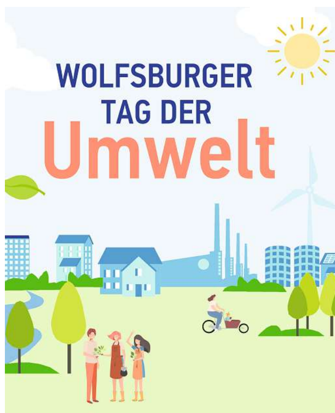
Ein buntes Programm mit Aktionen, Experimenten, Informationen und Spielen gibt es beim Tag der Umwelt am 24. Juni.

Mit Experimenten oder Bastelangeboten sind das Phaeno, die VfL Wolfsburg Fußball GmbH und das Jugendzentrum Haltestelle vertreten. Die Natur-