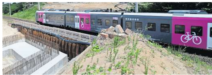
Bauarbeiten an der Weddeler Schleife sorgen für Zugaussfälle.

Zur besseren Orientierung sind die einzelnen Buslinien farblich unterschiedlich gekennzeichnet. Auch in den Bussen können Fahrgäste auf Schildern gleich erkennen, um welche SEV-Linie es sich handelt. Trotzdem