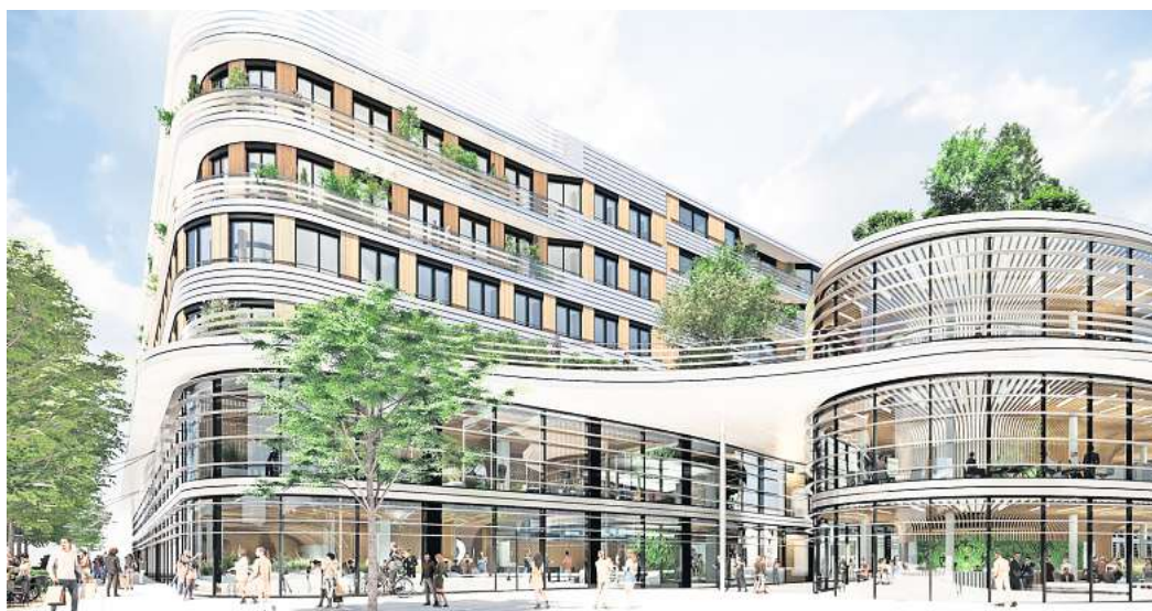
Grafikentwurf: So sollen die BraWo Arkaden in der Wolfsburger Innenstadt aussehen: Die Volksbank Braunschweig Wolfsburg plant den Umbau der Schiller-Galerie.

Die Planer und die Stadt Wolfsburg wollen mit den BraWo Arkaden neue Maßstäbe in der Innenstadt setzen, und das in mehrfacher Hinsicht: Bessere Aufenthaltsqualität durch viel Grün – ringsherum, möglicherweise an der Fassade, auf dem Dach und am Meckauerweg. „Dort kommen wir weg von der Hinterhofsituation, hin zu einer attraktiven Wohnlage mit einer ansprechenden Passage“, so Architekt Jürgen Schubert vom Büro StructureLab aus Düsseldorf. Neue Sichtachsen sollen durch die „Verkleinerung“ des Pavillons entstehen: freier Blick von der mittleren Porschestraße