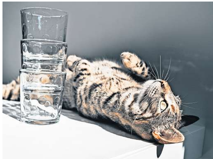
Wasser ist für Katzen völlig ausreichend zum Trinken.

Aufgrund des vorherrschenden Wassermangels hat es die Natur so eingerichtet, dass die schnurrenden Vierbeiner ihren Flüssigkeitsbedarf fast ausschließlich aus ihrer Nahrung beziehen. So wie jeder lebende Organismus, bestanden auch die Beutetiere der Samtpfoten zu 80 Prozent aus Flüssigkeit. Sie nahmen daher, zum Beispiel über das Blut, genügend Flüssigkeit auf. Wegen ihrer Abstammung haben Samtpfoten auch sehr leistungsstarke Nieren. Im Gegensatz zum Menschen oder zu Hunden benötigen sie daher nur sehr wenig Wasser, um Giftstoffe aus dem Körper auszuwaschen. Pro Kilo Körpergewicht benötigt eine Samtpfote nur circa 50 Milliliter Flüssigkeit pro Tag. Dieser Wasserbedarf schwankt jedoch immer ein wenig. Witterungsbedingungen, Alter und Flüssigkeitsverlust durch Putzverhalten, Erbrechen