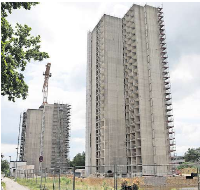
Hochhaus-Baustelle: Bei Wasserstrahlarbeiten in Don Camillo entsteht Lärm – jetzt gibt es eine Ruhepause.

Bürger aus Detmerode sehen die Situation unterschiedlich, sie wollten bei der WAZ-Umfrage anonym bleiben. „Mal ist Ruhe, mal ist Krach, das ist eben so!“, meint schulterzuckend einer der Bewohner in der Häuserreihe hinter „Don Camillo und Peppone“. Ein anderer sagt: „Der Bau-ärm ist eigentlich in einem erträglichen Maß, nur wenn die Strahlarbeiten laufen, sollte man nicht unbedingt auf dem Balkon sitzen.“ Eine weitere Anwohnerin ist von dem Lärm zeitweise schon genervt: „Man kommt von der Arbeit und möchte sich hinlegen, aber es ist sehr laut.“ Ein