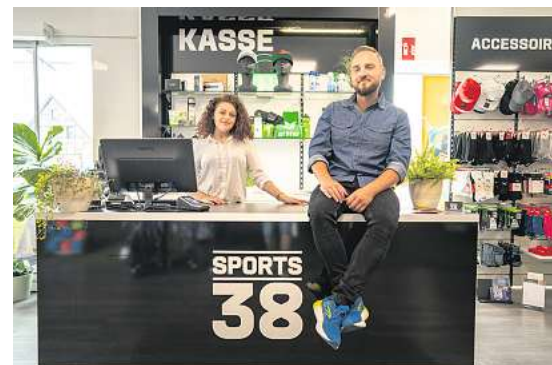
Sports38 ist ein Paradies für Sportbegeisterte.