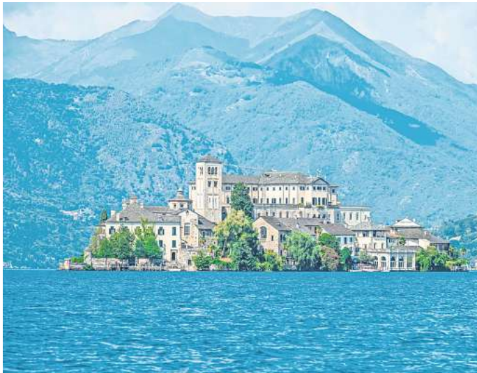
Noch ein echter Geheimtipp: der Ortasee im Piemont in Italien.

Weitaus unbekannter sind dagegen die kleineren „Geschwister“, darunter der Idrosee und der Lago di Varese. Doch das vielleicht am meisten unterschätzte Mitglied ist der Ortasee, der in der Größenordnung der „Gletschersee-Familie“ in Norditalien an sechster Stelle steht. Ein Beleg für den vergleichsweise bescheidenen Auftritt des Ortasees findet sich in der schimmernden