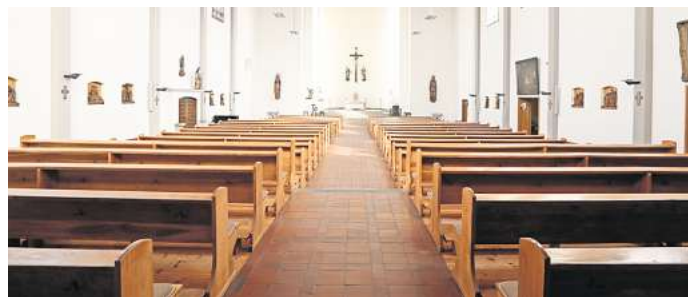
St.-Christophorus-Kirche in Wolfsburg: Sie könnte bald bei Hitze öffnen.