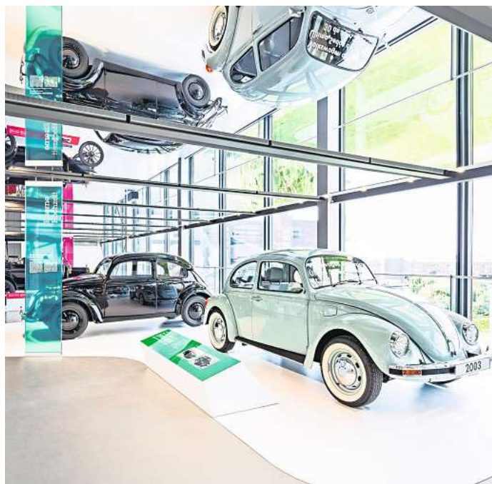
20 Jahre Produktionsende: Der Volkswagen Käfer mit der Fahrgestellnummer B84M905162 lief am 30. Juli 2003 um 9.05 Uhr im mexikanischen Puebla vom Band und ist jetzt in der Autostadt zu sehen.

Mit insgesamt 21.529.464 hergestellten Fahrzeugen trug der Volkswagen Käfer entscheidend zur Demokratisierung der Mobilität bei, war in vielen Ländern zu Hause und etablierte sich zu einem wichtigen Botschafter und Sympathieträger Deutschlands.