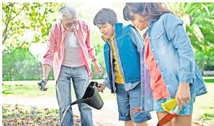
Theoretisches und praktisches Wissen verbindet sich beim Gärtnern.

schiedene Gründe. So ist für einen Schulgarten und seine Finanzierung der Schulträger verantwortlich, also eine Kommune oder ein Landkreis. „Der Schulträger schaut dann ganz genau, was notwendig oder was gesellschaftlich gefordert ist“, erklärt Goldschmidt. „Letzteres ist im Moment Digitalisierung. Deshalb werden jetzt überall Smartboards aufgestellt.“ Zudem koste es Geld und Zeit, den Garten zu pflegen. „Und das ist allein über AGs, den Unterricht und Elterninitiativen nicht schaffbar.“