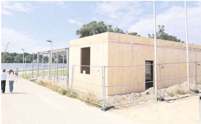
So sah das im Bau befindliche Restaurant am Allersee Anfang Juli aus. Der Rohbau ist fertig. Der Eröffnungstermin wird noch bekanntgegeben.

Rückblick: Nach dem Spatenstich im vergangenen Sommer wurde im November 2022 die Betonplatte gegossen. In diesem Jahr folgte der Bau der Rück-