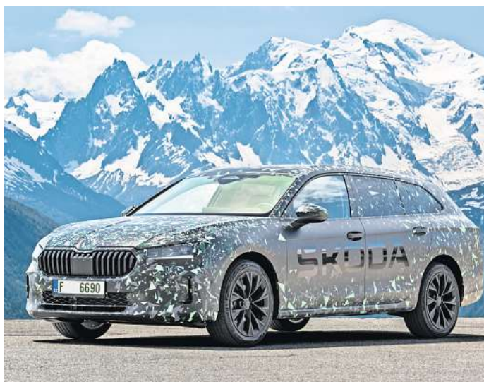
Größer und sparsamer: Skoda stellt erste Details des neuen Superb vor.

Die beiden Steckdosen-Stromer leisten 150 kW/204 PS oder 200 kW/272 PS und sind für mehr elektrisches Fahren denn je gerüstet. So hat Skoda nicht