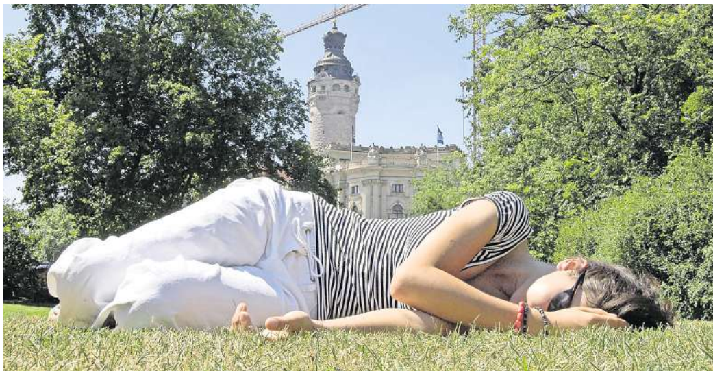
In südlichen Ländern gibt es sie schon, nun regen Amtsärzte sie auch für Deutschland an: die Siesta.

Derzeit forderte das Vorstandsmitglied des Deutschen Gewerkschaftsbundes (DGB), Anja Piel, alle Arbeitgeber auf, während der Sommermonate regelmäßig Hitzegefährdungsbeurteilungen zu erstellen. Sie pocht auf Abkühlungs- und Sonnenschutzmaßnahmen ab einer Temperatur von 26 Grad.