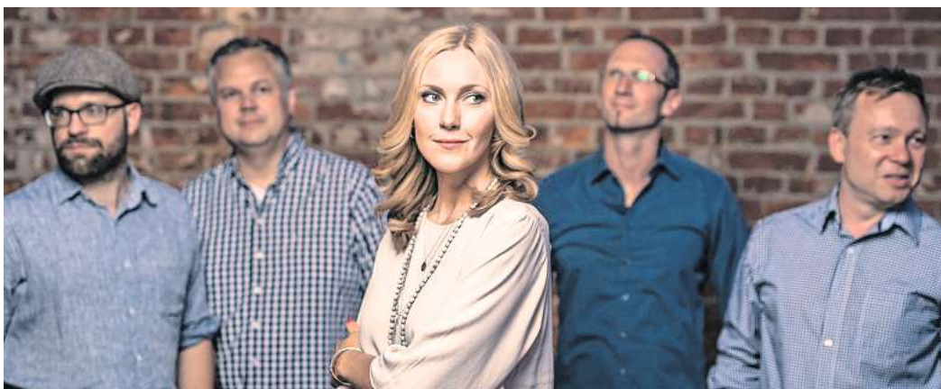
Die Band Ellingtones präsentiert einen Mix aus Pop-Jazz-Klassikern.

Die Jazzband Ellingtones aus Hannover ist zum dritten Mal bei Jazz & more dabei und wird mit Jazz, Swing, Latin, Pop und Lounge-Musik für beste musikalische Unterhaltung sorgen. Die Ellingtones haben sich nicht nur der Musik des großen Duke Ellington mit Klassikern des Jazz und Swing verschrieben. Die Profimusiker widmen sich darüber hinaus den unterschiedlichsten musikalischen Gefilden und stellen große Hits