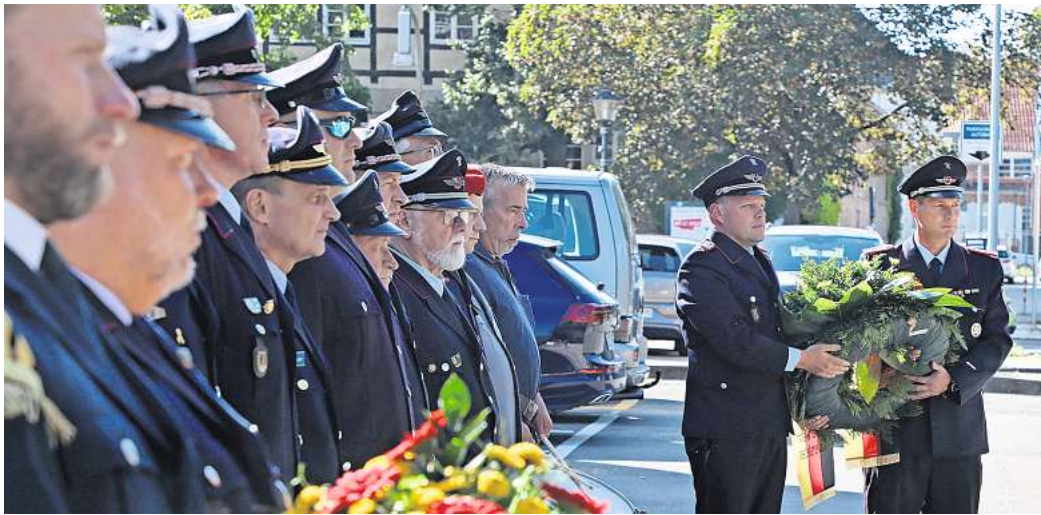
Gedenkveranstaltung in Fallersleben: Die Feuerwehr erinnerte an fünf Einsatzkräfte, die bei der Waldbrand-Katastrophe im Jahr 1975 ums Leben kamen.

Verheerende Waldbrände gab es auch im Jahr 2023, zwar nicht in unmittelbarer Umgebung, dafür auf dem Brocken, in Brandenburg oder auf der griechischen Insel Rhodos – zwei Piloten eines Löschflugzeugs kamen dort ums Leben. „Schauen wir in die heutige Zeit, werden wir schnell an die Tage und Wochen in 1975 erinnert und wünschen uns, dass niemand zu Schaden kommt“, so Schlichting. „Als langjähriges aktives Mitglied dieser Feuerwehr weiß ich, was in einem Feuer-