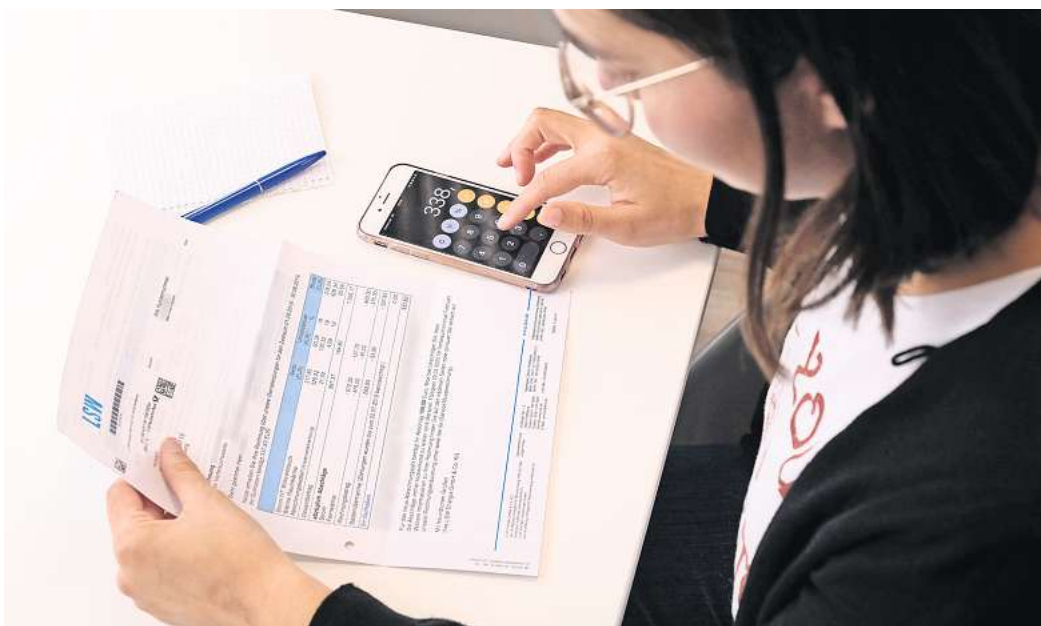
LSW verschickt Jahresabrechnungen: Nachrechnen kann nicht schaden.

Die Mehrzahl der LSW-Kunden zahlt per Bankabbuchung.