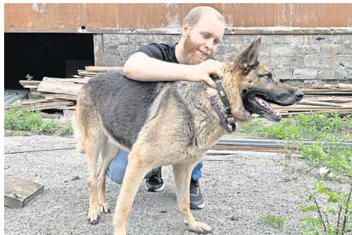
Die praktische Nothilfe für Tiere macht nicht an den Landesgrenzen halt.

Müller weiter: „Deswegen arbeiten wir auch mit Tierheimen in Deutschland zusammen und unterstützen sie, weil es uns wichtig ist, den Inlandstierschutz zu stärken. Und wir holen auch nicht wahllos irgend-