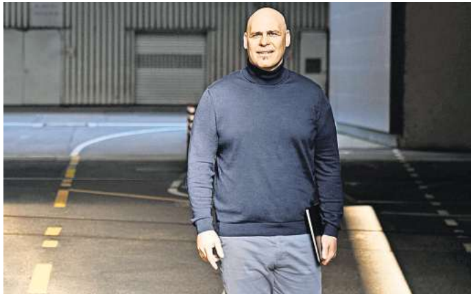
Mitarbeitende von Audi sollen mit ihren Karrieren und Lebensgeschichten Fachkräfte ansprechen.

Volkswagen-Tochter will gleichzeitig die ganze Marke in diese Richtung positionieren