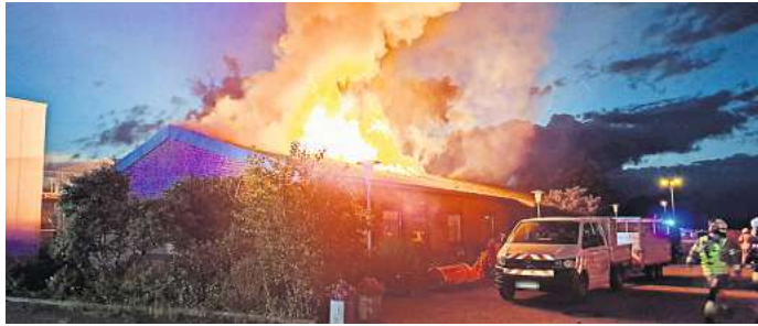
Brand im Gewerbegebiet: Die Feuerwehr war gut fünf Stunden mit den Löscharbeiten beschäftigt.