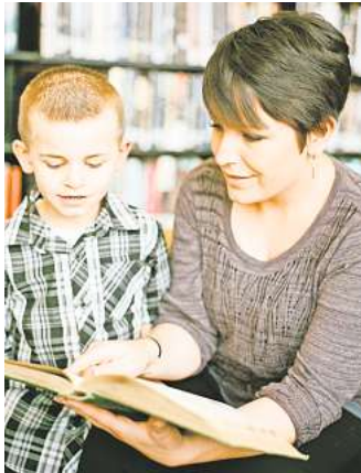
Laut einer Untersuchung lernen längst nicht alle Kinder wirklich lesen.