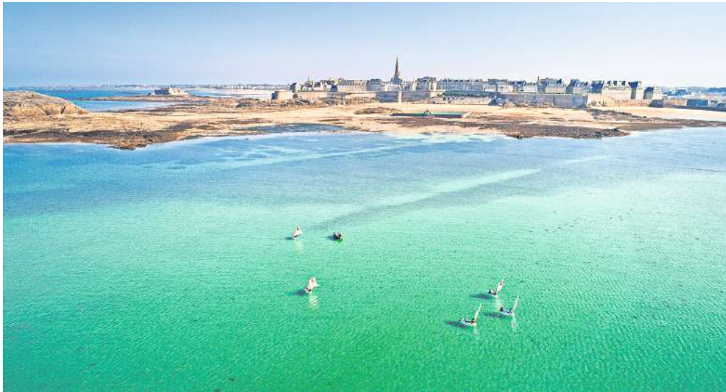
Saint-Malo hat den bedeutendsten Hafen an der bretonischen Nordküste.

Saint-Malo wurde Mitte des zwölften Jahrhunderts gegründet. Wegen der Seefahrer und Kaufleute, die von dort nach Indien, China, Afrika und Amerika aufbrachen, mauserte sich die Hafenstadt „Bretagne.com“ zufolge im 17. und 18. Jahrhundert zu