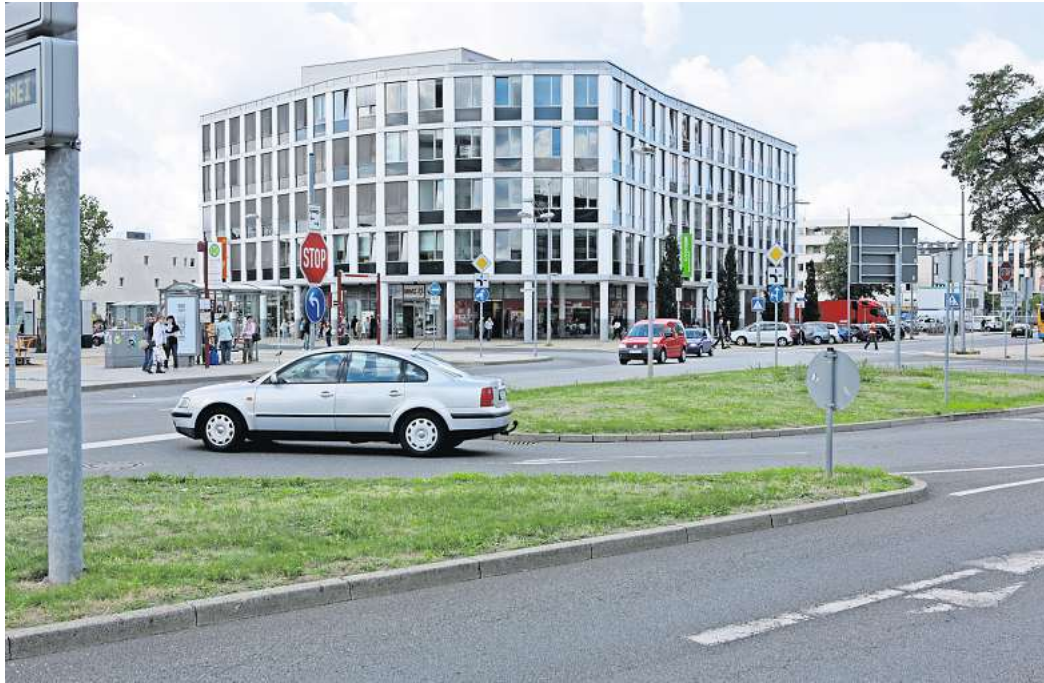
Wochenumfrage: Wir würden gerne von Ihnen wissen, ob Sie der Meinung sind, dass sich Arbeit in Deutschland noch lohnt.