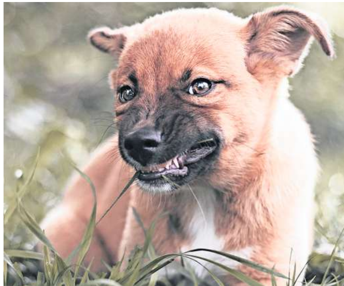
Hunde können bei vielen Menschen Angst und Panik auslösen.

„Der tut nichts, der will nur spielen“ – dieser weit verbreitete Satz hilft Menschen, die unter einer solchen Phobie leiden, nicht weiter. Sie bekommen Panik, wenn sich eine Fellnase schnell nähert, hochspringt, bellt oder sie zum Spielen auf-