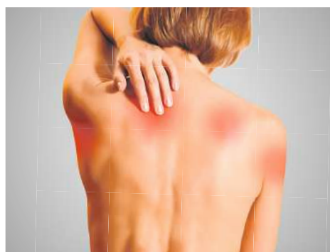
Nervenbedingte, muskelkaterartige Schmerzen?

Was Betroffene oft nicht wissen: Bei Nervenschmerzen zeigen viele Schmerzmittel nur wenig Wirkung, denn sie bekämpfen meist Entzündungen. Bei Nervenschmerzen handelt es sich hingegen häufig um geschädigte oder gereizte Nerven. Mit dem Ziel, Nervenschmerzpatienten zu helfen, entwickelten Experten ein wirkungsvolles Arzneimittel speziell zur Behandlung von Nervenschmerzen: Restaxil (Apotheke, rezeptfrei).