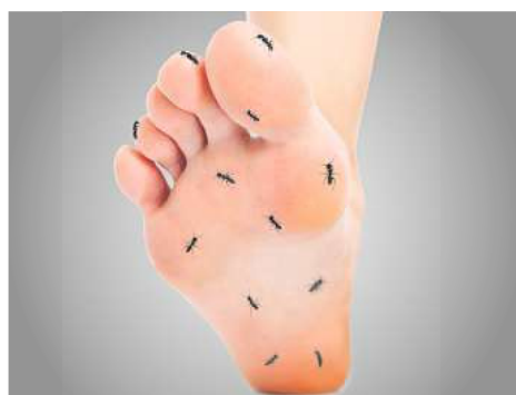
Kribbelnden Füße infolge von Nervenschmerzen?