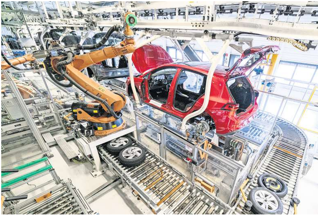
Kurzarbeit und Produktionsausfall: Auch im Wolfsburger Stammwerk kommt es aufgrund fehlender Teile ab dem 11. September zu Schichtausfällen.

Hintergrund für die jetzt aufgetretenen Probleme: In Folge des Hochwassers in Slowenien ist ein Unterlieferant für Motorcomponenten zurzeit nur eingeschränkt lieferfähig. Im Norden