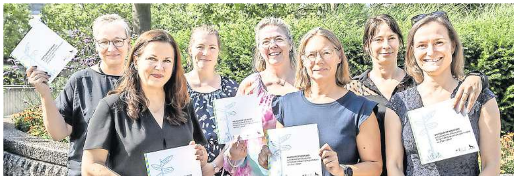
Der "Wolfsburger Wegweiser" soll Familien von Kindern mit Beeinträchtigung bei der Suche nach passenden Beratungs- und Bildungsangeboten unterstützen.