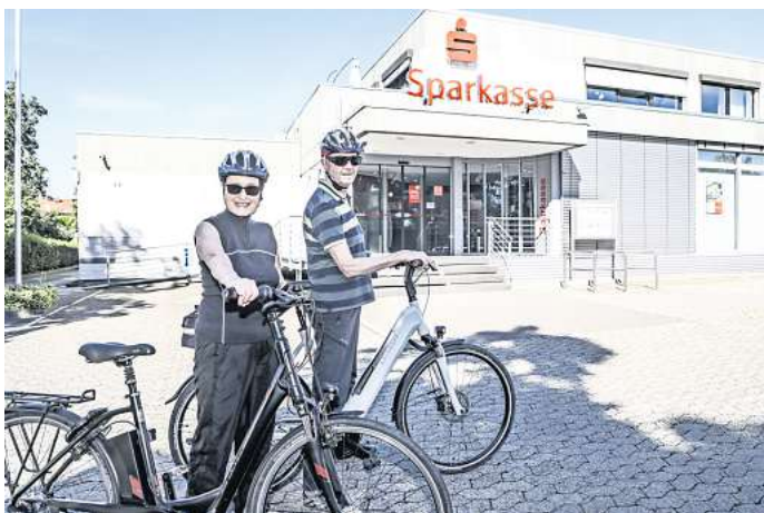
Die Geldautomaten in der Sparkasse Ehmén wurden gesprengt. Die Kunden freuen sich, dass die Filiale wieder geöffnet ist.

Beide Filialen wurden der Sparkasse zufolge zunächst aufgrund der enormen Gewalteinwirkung und der daraus resultierenden Instandsetzung vorübergehend geschlossen. „Terminierte Beratungsgespräche konnten glücklicherweise wieder zeitnah vor Ort angeboten werden. Der vollumfängliche Service beider Filialen wurde im März 2022 wieder hergestellt“, teilte Sprecher Eike Fromhage mit. Allerdings gibt es in Ehmén seit Januar 2023 aus-