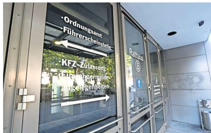
Die Kfz-Zulassungsstelle befindet sich in Wolfsburg im Rathaus B.

Die Kosten für den Online-Service sind in ganz Deutschland einheitlich. Die Online-Gebühr beträgt 27,90 Euro. In der Zulassungsstelle des Rathauses