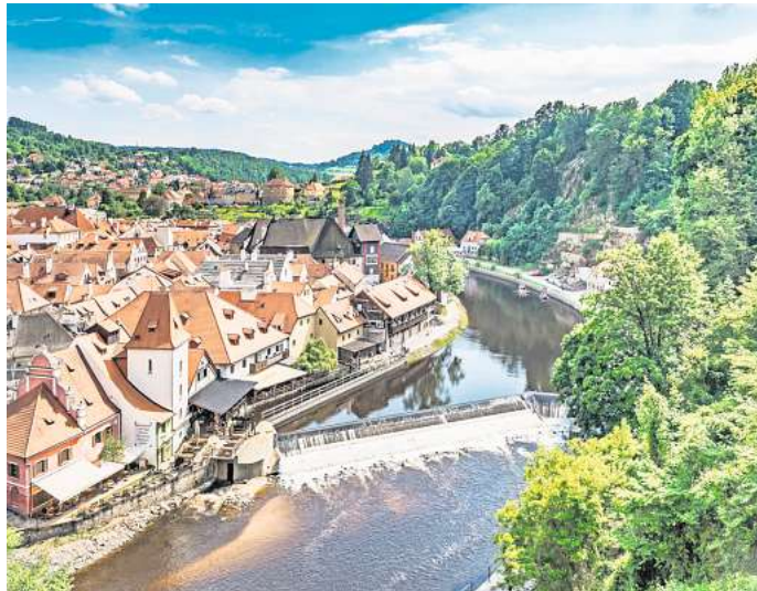
Die alte Mühle Krumlov Mill bietet nicht nur einen Traumblick, sondern gilt auch als bedeutende kulinarische Adresse.

Am besten beginnst du deine Erkundungstour durch Český Krumlov mit einem Bummel durch die kopfsteingepflasterten Altstadtgassen mit ihren farbenfrohen historischen Gebäuden. Auch wenn du dich einfach treiben lässt, wirst du früher oder später den alten Marktplatz Náměstí Svornosti erreichen, den du sofort an seinem Brun-