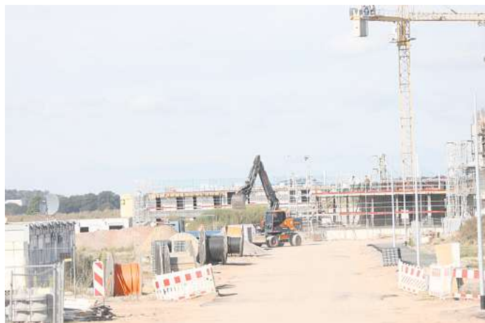
Baugebiet Sonnenkamp: Hier sollen hunderte neue Häuser und Wohnungen entstehen.

sieht mehrere Gründe für die schleppende Vermarktung. Neben der derzeitigen Problematik der Baufinanzierung weist er darauf, dass die Stadt mit eingeschränktem Personal die Reihenfolge der Bewerbungen abarbeiten müsse. Beim Thema Finanzierung verweist Meiners auf das Familienförderprogramm der Stadt. „Leider wirbt die Stadt so gut wie gar nicht für diese Möglichkeit“, kritisiert er. Der Link www.wolfsburg.de/leben/bauen/wohnen/wohnraumfoerderung sei nur schwer auffindbar.