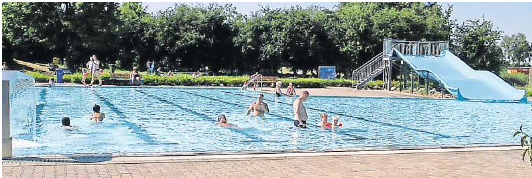
Personalmangel: Das Freibad Fallersleben konnte zu Beginn der Saison nur eingeschränkt öffnen.

Insgesamt haben in dem Zeitraum 29. April bis 17. September 157.256 Gäste die Wolfsburger Freibäder besucht. Mit 73.535 Erwachsenen, Kindern und Jugendlichen war damit das Freibad Fallersleben das besucherstärkste Bad. Im Vorjahr war dieses noch das VW-Bad mit 93.820 Badegästen. Im Vergleich zum Vorjahr mit 193.490 Besuchern verzeichnete die Stadt insgesamt