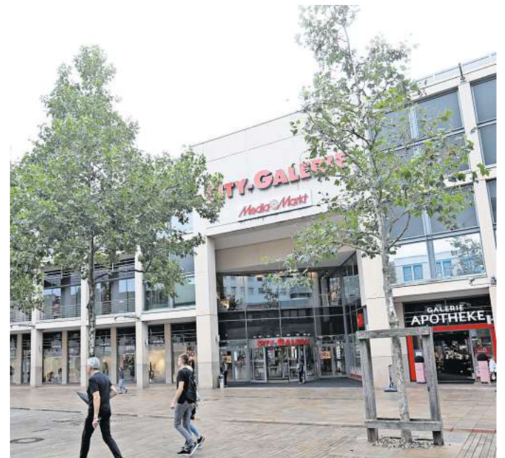
City-Galerie in Wolfsburg: Für den Einzug eines neuen Ankermieters sollen einige Läden die Plätze tauschen.