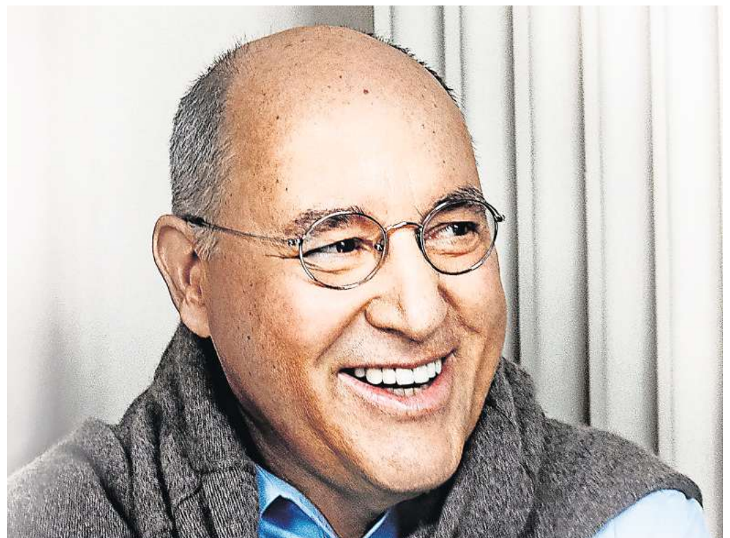
Gregor Gysi stellt im CongressPark seine Autobiografie vor.