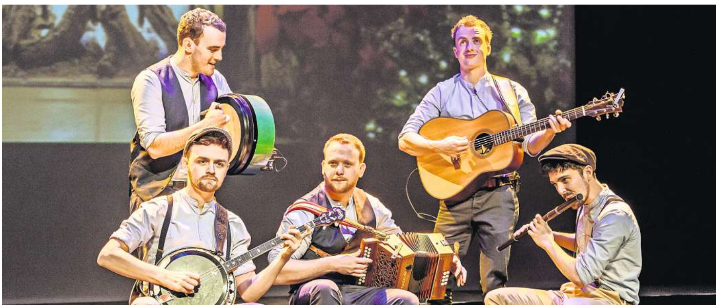
Das irische Ensemble bietet einen hörens- und sehenswerten Mix aus traditioneller Musik, weihnachtlichen Songs und gesellschaftlichem Tanz.

Das Konzert steht unter der Leitung des renommierten irischen Komponisten Carl Hession und stellt neben den traditionellen Songs auch neue Kompositionen und Arrangements von ihm vor. „The Celtic Spirit“ verbindet traditionelle Melodien und zeitgenössische Rhythmen und verwebt die Geschichte mit dem musikalischen Erbe der Insel Irland. Das Ensemble lässt