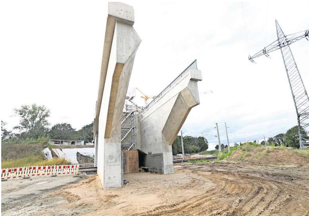
Schacht II: Die Brücke des Wirtschaftswegs über die Bahnstrecke Weddeler Schleife ist fertig – der Straßenbau verzögert sich jedoch.

Die Brücke der Calberlaher Straße (L292) in Sülfeld sollte ursprünglich bis Ende September 2023 gesperrt bleiben. Tatsächlich wird es deutlich länger dauern. Zunächst wurde die Freigabe auf Anfang November 2023 verschoben, weil starke Regenfälle immer wieder Sand und Kies abtrugen und den Zeitplan bei den Erdarbeiten zurückwarfen. Doch selbst dieser Termin ist nicht mehr haltbar, teilte die Bahn auf Nachfrage mit. „Zum einen waren noch umfangreiche Abstimmungen mit der Niedersächsischen Landesbehörde für Straßenbau und Verkehr zur Freigabe der Ausführungsplanung für den Straßenbau erforderlich“, teilte eine Bahnsprecherin mit. „Zum anderen muss ein