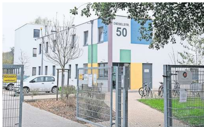
Anlaufpunkt für Asylsuchende in Wolfsburg: Das Flüchtlingsheim in der Dieselstraße.

In der vergangenen Woche wollten wir wissen, ob Sie sich ein weiteres Mal gegen Corona impfen lassen würden. Über 1300 Leserinnen und Leser haben an der Umfrage teilgenommen. Die große Mehrheit von 82,8 Prozent der Teilnehmenden sprach sich gegen eine weitere Corona-Impfung aus („Auf keinen Fall!“). 8,5 Prozent wollen sich „auf jeden Fall“ noch einmal impfen lassen. 5,6 Prozent machen es davon abhängig, ob sich die Situation noch einmal verschärft und 3,1 Prozent wissen es noch nicht.