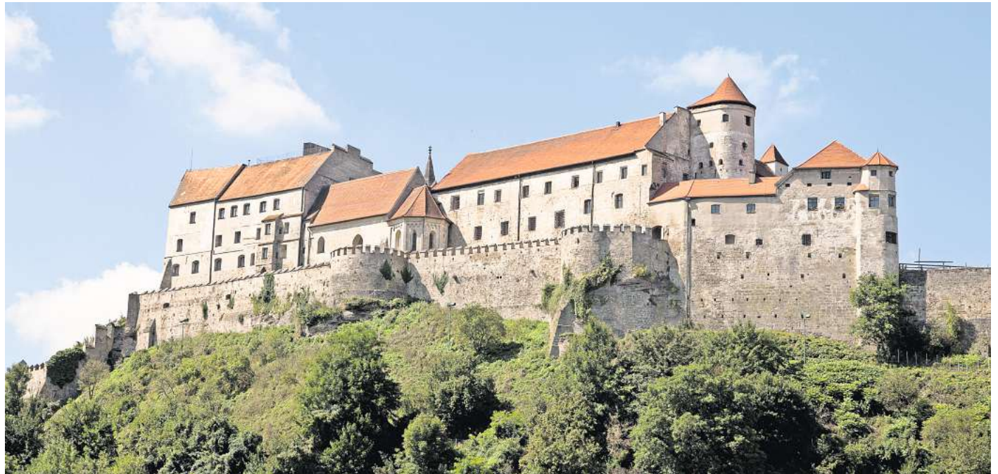
Die Burg thront hoch über der Stadt Burghausen.

Im Inneren findest du mehrere Museen und Ausstellungen, hin und wieder finden auch Theater und Konzerte statt. Wenn nicht gerade Burgfest ist, kannst du die Burg rund um die Uhr besuchen und der Eintritt ist sogar frei. Die alten Gemäuer haben bereits Jahrtausende an sich