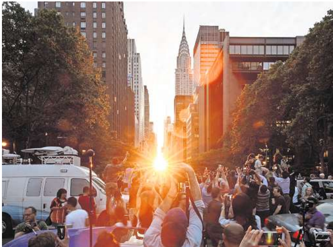
New Yorks Großstadtphänomen Manhattanhenge, aufgenommen am 11. Juli 2016.

In den Ost-West-Straßen des Straßenrasters von Manhattan kannst du das Event am besten beobachten. Dadurch, dass die Querstraßen der Riesenstadt fast vollständig gerade sind, fällt