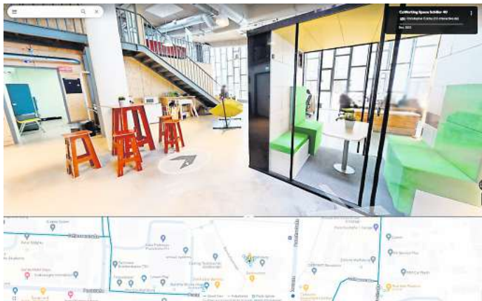
Trendige Büros: Auf Google kann man sich durch die Räume der Programmierschule 42 in Wolfsburg klicken.

Besonders viele davon finden sich zum Beispiel beim Phaeno: Besucherinnen und Besucher können sich schon einmal vorab durch die Ausstellung klicken – was natürlich nicht den Spaß am Experimentieren in der Realität ersetzt.