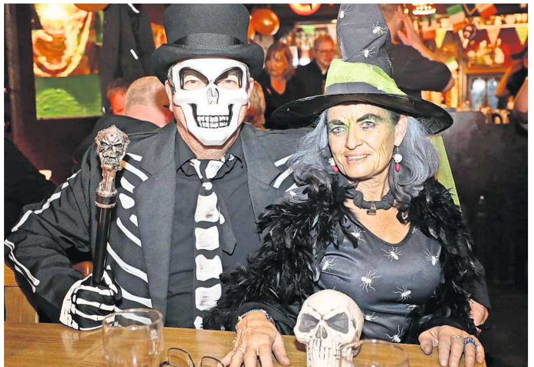
Bald geht es wieder los: Die nächsten Halloween-Partys stehen vor der Tür.

Tickets an allen bekannten VVK-Stellen und in der Geschäftsstelle der WAZ www.eventim.de Tel. 01806 / 57 00 70