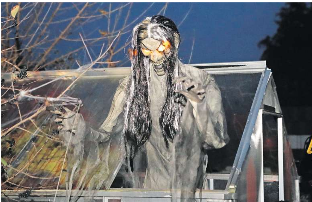
Am 31. Oktober ist Halloween. Haben Sie mal überlegt, fern der Heimat zu feiern?

Die Bahn- und Busreiseplattform Trainline hat ausgewertet, wohin die Deutschen im Zeitraum vom 27. bis zum 31. Oktober die meisten Zugverbindungen gebucht haben – Auf Platz 1 steht dabei Paris. Die Stadt bietet in der Halloween-Zeit einige spannende Aktivitäten und Möglichkeiten für Gruselfans. So findet am 31. Oktober zum Beispiel eine Halloween-Boots-tour auf dem Fluss Seine statt. Auch Wien ist ein beliebtes Reiseziel. Dort ist das Drag-Theater in der malerischen Kulisse des