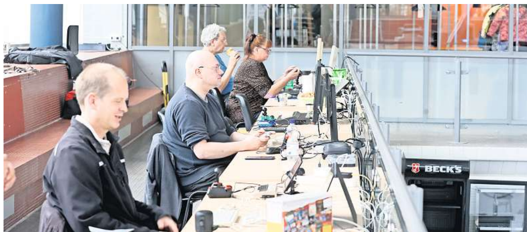
Beim Gameday im Hallenbad war für jeden Besucher die richtige Konsole dabei.

Stand, bei dem Besucher Pokémon-Sammelkarten untereinander tauschten.