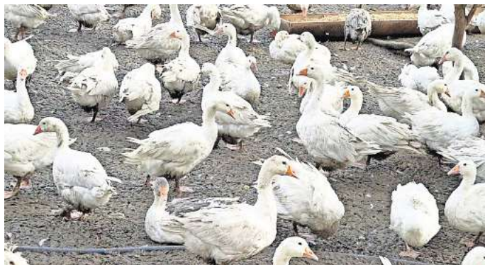
Gänsehaltung in Polen.

Doch noch immer gibt es Pelzfarmen. In kleine Käfige gepferchte Füchse, Nerze, Chinchillas, die am Ende ihres leider-