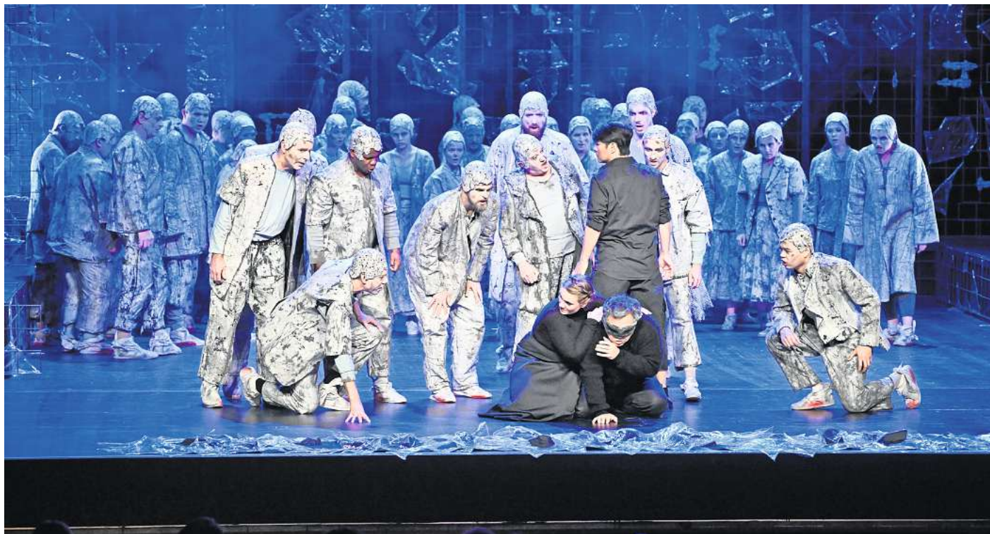
Im Wolfsburger Scharoun Theater wurde Giacomo Puccinis Oper „Turandot“ aufgeführt.

Ferner ist die Auswahl eines Märchenstoffs für Puccini ungewöhnlich. Als Vertreter des Verismus, hat er in seinen Werken stets Geschichten aus dem „wahren Leben“ auf die Bühne gebracht. Das dramatische Mär-