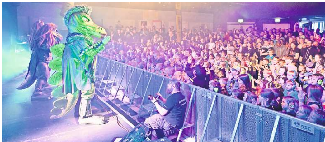
„Heavysaurus“ im Hallenbad: Die Dino-Band rockte mit Kindern und Eltern.

Der Sänger ist ein Tyrannosaurus Rex und der Songwriter der Band. „Milli Pilli“ sucht immer nach neuen Sounds, und „Komppi Momppi“ ist groß und laut – und das zeigte er auch auf der Bühne. Die Urzeitwesen sind bekannt und beliebt bei den Kids. Das Konzert in Wolfsburg war ausverkauft. Auf den Social-