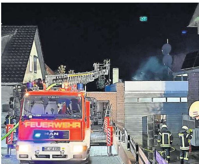
In Lehre musste die Feuerwehr am 3. November eine große Halle löschen.

wolke war über Lehre aufgestiegen. Die enorme Rauchentwicklung machte es den Einsatzkräften zunächst schwer, die genaue