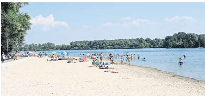
Entspannung am Strand: Mitarbeitende einer Klinik in Hannover erhalten ab Januar 15 Tage mehr Urlaub.

Wir würden gerne von Ihnen wissen, wie Sie das Programm der Klinik finden. Machen 45 Urlaubstage einen Arbeitgeber für Sie attraktiver? Oder ist Ihnen das Gehalt bei der Entscheidung wichtiger? Machen Sie mit bei