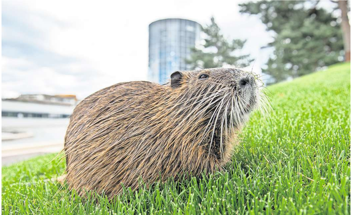
Vermehrungsfreudiger Schädling: Ein Nutria auf einer Wiese bei der Autostadt in Wolfsburg.

Die eigentlich in Südamerika beheimateten Nager wurden