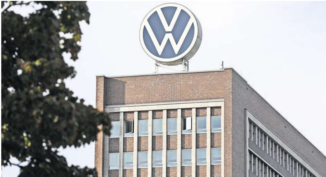
Volkswagen: Der Markenvorstand will den „Tarif Plus“-Bereich nicht ausufern lassen.

Interessant dabei: Volkswagen selbst hat die „Tarif Plus“-Stufe ins Leben gerufen, um Geld zu sparen. Denn: In früheren Zeiten gab es viele Führungskräfte und Spezialisten, die regelmäßig Überstunden gemacht haben oder machen mussten – die VW natürlich extra bezahlt hat. „Da gingen manche Leute mit einem zweiten Monatsgehalt nach Hause“, berichtet ein Insider der AZ/WAZ. Ein zweiter Insider erklärt: „Um Geld zu sparen, hat VW damals Tarif Plus eingeführt – in dieser Bezahlung sind Überstunden quasi schon enthalten.“ Plus Boni und Dienstwagen-Berechtigung. Das Ergebnis: Eine Zeitlang habe VW tatsächlich durch