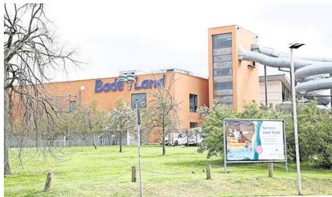
Soll fit gemacht werden für die Zukunft: Das Badeland in Wolfsburg muss saniert werden.

Seit seiner Eröffnung werde das Bad ohne große Schließzeiten betrieben. In den vergangenen Jahren habe sich durch den Dauerbetrieb ein immer größerer Sanierungsbedarf ergeben. Die Nutzerzahlen von teilweise mehr als 700.000 Badegästen im Jahr hätten ihr Übriges getan, denn die erfreulich starke Aus-