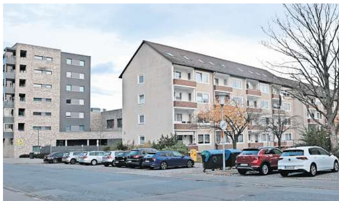
Der Schlesierweg am Laagberg: Die Stadt Wolfsburg hat einen Mietspiegel erstellt.

Der Grundbetrag liegt bei 6,35 Euro pro Quadratmeter. Für eine alte, mittelgroße Wohnung mit Denkmalschutz, einer schlechten Ausstattung und Lage, die nicht modernisiert ist, liegt die Gesamtmiete bei 6,47 Euro pro Quadratmeter. Anderes Beispiel des Mietspiegelmodells: Mieter in einer neuen kleinen Wohnung