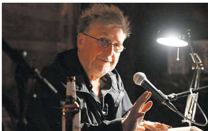
Lesung: Martin Semmelrogge erzählte wilde Geschichten aus seinem Leben.

Sein Vater Willy Semmelrogge, ebenfalls Schauspieler, war 1967 in Venedig und drehte mit Peter Lilienthal „Verbrechen mit Vorbedacht“. Der elfjährige Martin hatte sich trickreich den Zweitschlüssel für Papas BMW besorgt