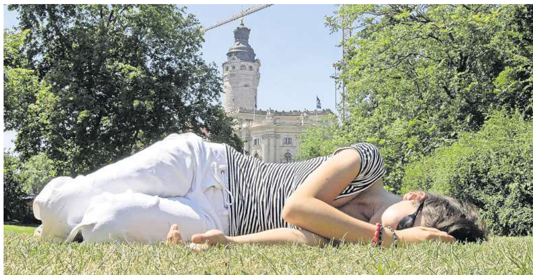
In südlichen Ländern gibt es sie schon, nun regen Amtsärzte sie auch für Deutschland an: die Siesta.