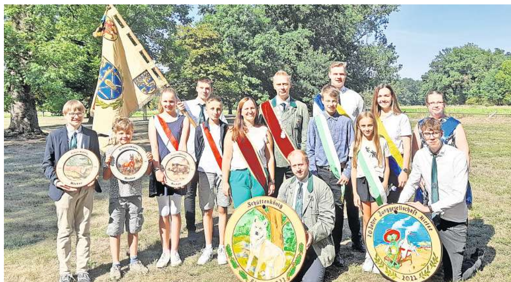
Auch die Königinnen und Könige aus dem vergangenen Jahr sind schon voller Vorfreude aufs Schützenfest.