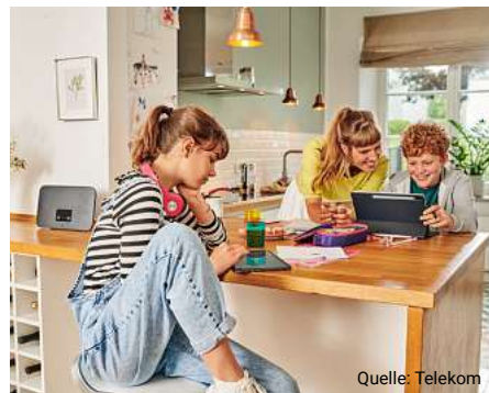
Für 15.250 Haushalte und Unternehmen baut die Telekom ihr Glasfaser-Netz aus.

Das Glasfasergebiet der Telekom in Peine 23245101_002623