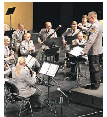
Bietet ein abwechslungsreichen Programm: Das Heeresmusikkorps Hannover.