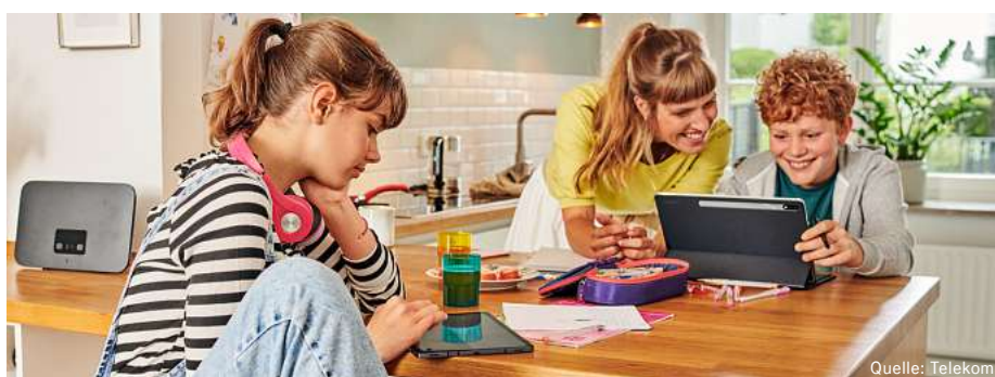
Für 15.250 Haushalte und Unternehmen baut die Telekom ihr Glasfaser-Netz aus.

Wichtig zu wissen: Sowohl Hauseigentümer*innen, Verwalter*innen und auch Mieter*innen können den Anstoß für den Glasfaser-Anschluss geben. Die Telekom kümmert sich dann in Abstimmung mit den Kund*innen um die weiteren Schritte, damit der Anschluss reibungslos funktioniert. Das Verlegen der Glasfaser zum Haus ist in der Regel innerhalb eines Tages erledigt.