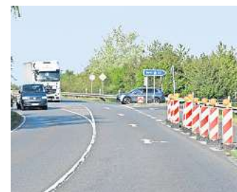
Peine-Ost: Schon seit längerer Zeit stehen Baken auf dem Autobahn 2-Zubringer in Richtung Berlin.

der Verkehrssicherheit an unfallbelasteten Stellen im Straßennetz“, heißt es auf der Internetseite der GDV.