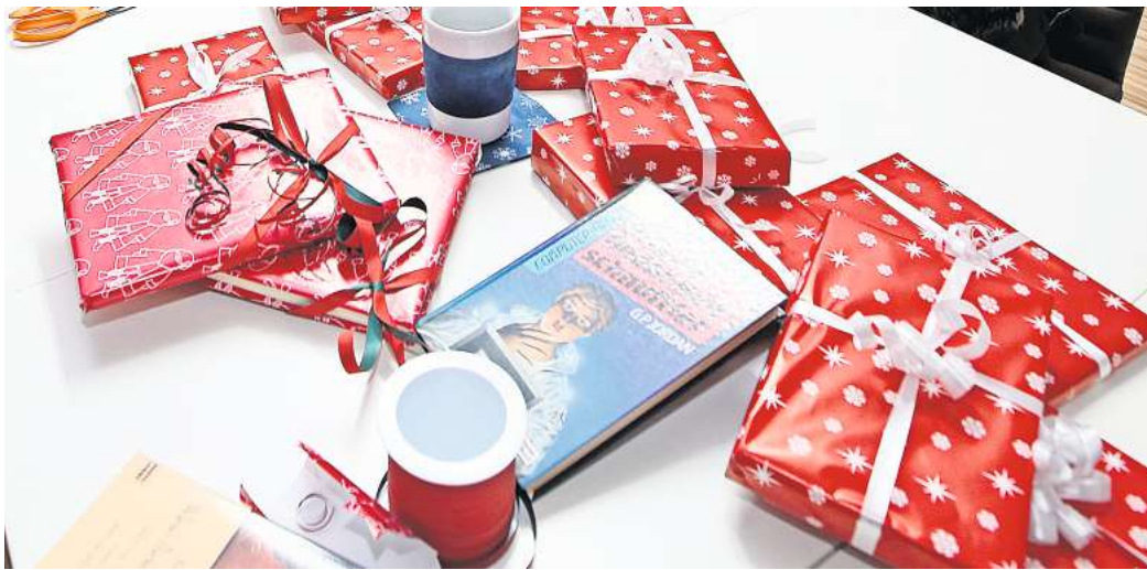
Haben Sie schon damit begonnen, Weihnachtsgeschenke zu kaufen?

Peine. Fast jeder dürfte dieses Gefühl kennen: Eben noch saß man im T-Shirt in einem Eiscafé und nur einen gefühlten Augenblick später steht man bereits vor den ersten Spekulatius- und Lebkuchen-Packungen in den Supermärkten. Das Weihnachtsfest nähert sich mit großen Schritten, doch bis vor Kurzem fiel die Vorfreude auf das Fest der Liebe noch schwer: Die Temperaturen in der Region erreichten vor einigen Tagen noch teilweise Werte über 20 Grad Celsius – und bei herrlichem Sonnenschein wird so mancher den Gedanken an Weihnachten und den Geschenkekauf noch weit von sich geschoben haben. Doch der Kälteeinbruch im Wochenverlauf rückt den Winter und das nahende Weihnachtsfest nun wieder mehr ins Bewusstsein.