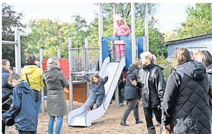
Große Freude bei der Einweihung: Die Kinder probierten die neuen Spielgeräte aus.