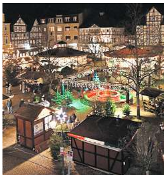
Weihnachtsmarkt in Peine: Die Beleuchtung wurde dort 2022 vor dem Hintergrund der Energiekrise mit verkürzten Zeiten eingeschaltet.

Mitmachen und Media-Markt-Gutschein gewinnen