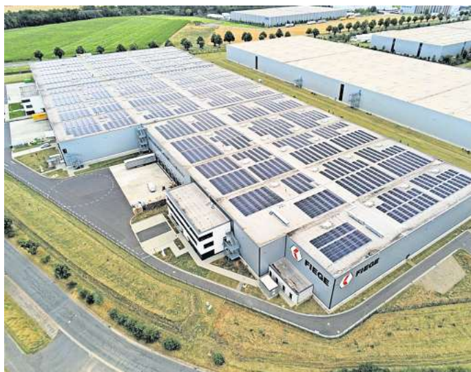
Kraft der Sonne: Das Familienunternehmen Fiege produziert in Peine ab Sommer 2024 durch die unternehmensweit größte Photovoltaik-Anlage Strom.

Durch die Belegung der gesamten Hallenfläche mit PV-Modulen sichere die Anlage