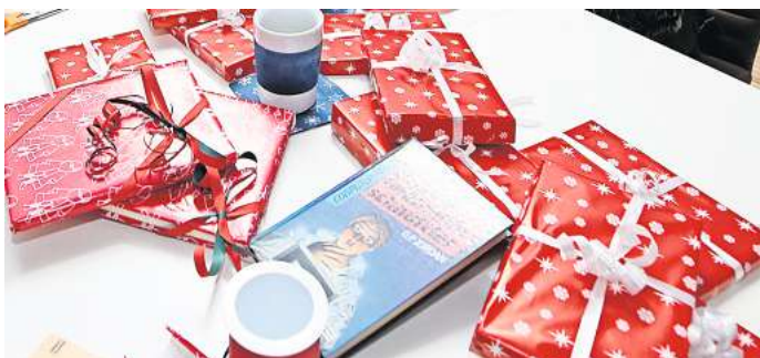
Wie viel Geld geben Sie dieses Jahr pro Kind für Weihnachtsgeschenke aus?

Peine. In zwei Wochen ist Weihnachten. Das Fest der Liebe und der Familie kommt mit großen Schritten schnell näher. Was ursprünglich mit Licht, Freude und Hoffnung verbunden war, wird immer mehr zum Fest der Konsumflut. Die Innenstädte sind in diesen Tagen voller Menschen, die auf der Suche nach dem passenden Geschenk die Geschäfte stürmen. Auch die Online-Shops melden von Jahr zu Jahr immer neue Rekordzahlen beim Verkauf. Weihnachten ist für die meisten Händler die Zeit, wo der höchste Umsatz gemacht wird. Während sich viele ältere Menschen in erster Linie über das Zusammensein mit der Familie und ein gutes Essen freuen, leuchten die Augen der