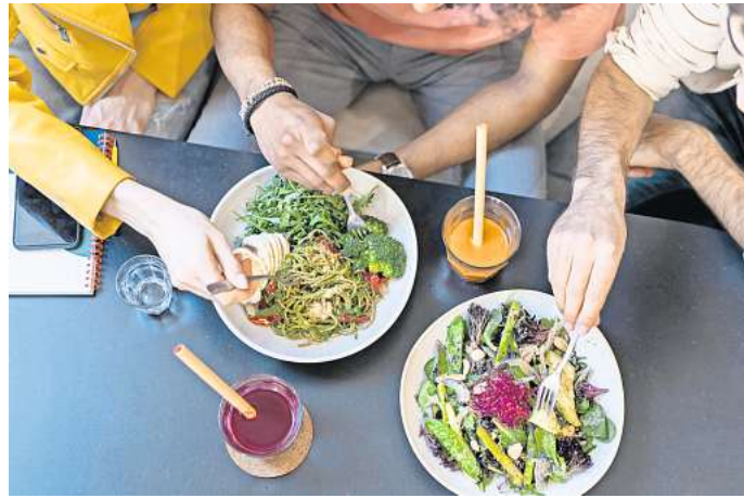
Vegetarisch oder pflanzlich genießen? Viele Städte in Deutschland bieten dafür eine besonders große Auswahl.

Die gut 314.000 Münsteraner und Münsteranerinnen haben die Wahl zwischen neun vegetarischen und 14 veganen Restaurants. Mit 7,17 Restaurants dieser Ausrichtung pro 100.000 Einwohner und Einwohnerinnen landet die Stadt, auf dem vierten Platz des Rankings. Unter den 23 Restaurants nennt Holidu das Lokal Krawummel aufgrund der besonders guten Google-Bewertungen als Tipp. Das Krawummel, das mit dem Untertitel „different dining“ wirbt, bietet seit 2013 Menüs aus Pflanzen-Power. Vom Burger über Bowls bis zum Cupcake schlemmst du hier vegan.