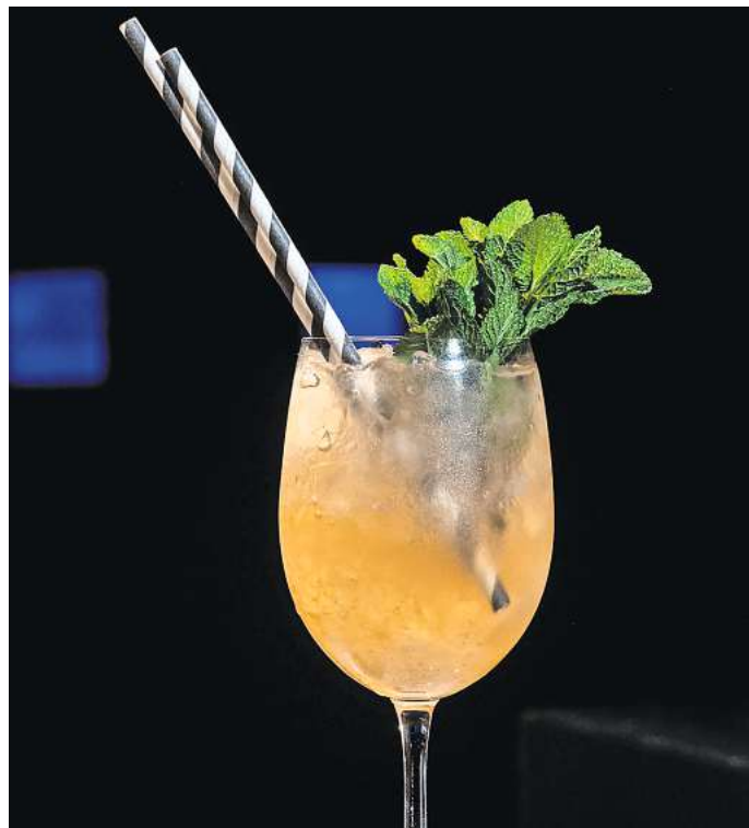
Ein leckeres Getränk im Urlaub, aber bitte ohne Alkohol: Immer mehr Menschen greifen zu alkoholfreien Alternativen. PETER HELLER