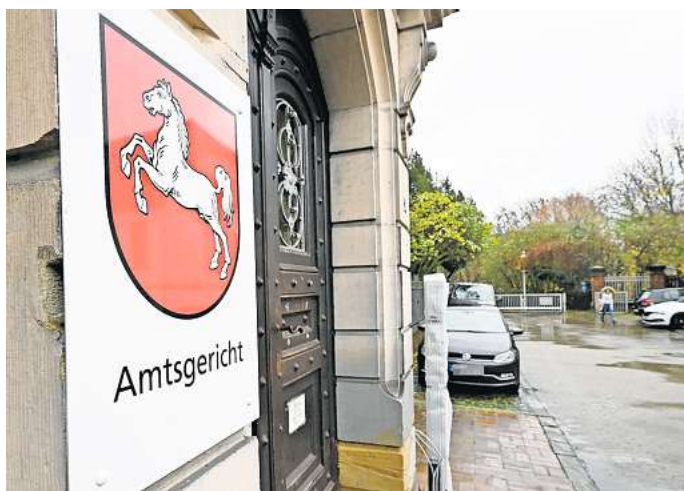
Wegen massiver Beleidigungen und Bedrohungen von Nachbarkindern und deren Mutter musste sich ein 53-Jähriger vor dem Amtsgericht Peine verantworten.

Die alleinerziehende 36-jährige Mutter und Nachbarin des Angeklagten wohnt seit 2021 in der Wohnung und leidet nach eigenen Angaben stark unter den Vorfällen. „Meine Kinder reagieren verängstigt auf den Nachbarn und trauen sich nicht