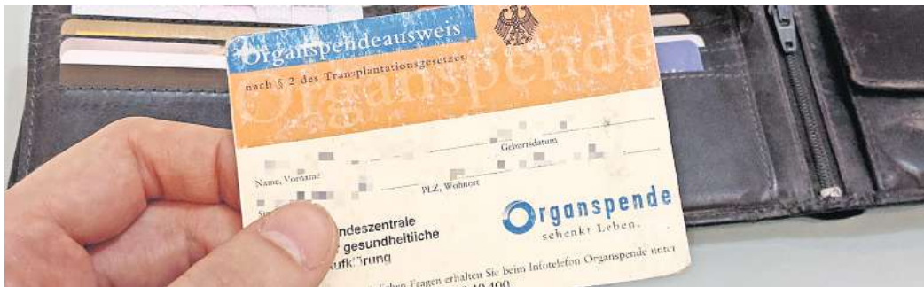
Organspendeausweis: Eine Organspende ist nur möglich, wenn der Spender zu Lebzeiten eingewilligt hat.

Weiterhin ist in Deutschland die Zustimmung zu Lebzeiten Voraussetzung für eine Organspende. Der Bundestag hatte sich 2020 gegen eine sogenannte Widerspruchslösung ausgesprochen, die etwa in den Niederlanden oder in Großbritannien angewendet wird. Vieles spricht für die Organspende, etwa die Vorstellung, nach dem Tod mit sei-