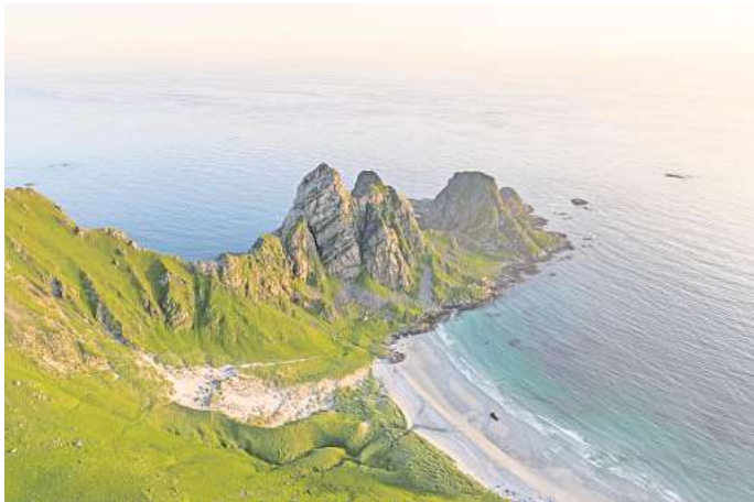
Die Vesterålen liegen noch nördlicher als ihre bekannten Nachbarn, die Lofoten.

Als wichtigste Inseln der Vesterålen werden Andøya, Langøya, Skogsøya und Hadseløya genannt, dazu kommt noch der westliche Teil von Hinnøya sowie der nördliche Teil von Austvågøya. Insgesamt ist die Inselgruppe über 3000 Quadratkilometer groß und es leben nur etwa 30.000 Menschen hier. Möchtest du die Vesterålen vom südlichsten bis zum nörd-