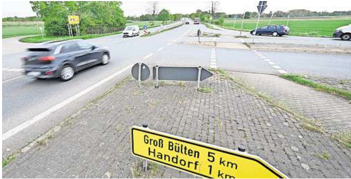
Die Abfahrt der B65 nach Handorf: Hier kommt es immer wieder zu Unfällen.

Nur ein kleines Stück weiter nordöstlich gibt es schon einen weiteren Unfallschwerpunkt: an der sogenannten FTZ-Kreuzung. FTZ steht für Feuerwehrentechnische Zentrale. Hier treffen die Bundesstraßen 65 und 444 sowie die Werner-Nordmeyer-