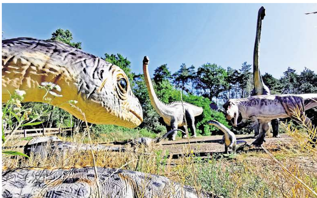
Auch für den Dinopark Müncheshagen gibt es Eintrittskarten zu gewinnen: Lebensgroße Rekonstruktionen von Dinosauriern und anderen Urzeittieren sind dort zu sehen.

Tickets gewinnen: Einfach den QR-Code mit dem Handy scannen.