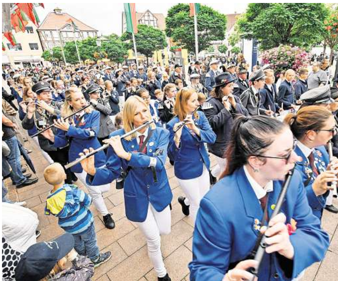
Ab kommendem Freitag geht's in Peine rund: Das Freischießen steht unmittelbar bevor.

10.45 Uhr: Vereinigte Spielmannszüge und Fahnenabordnungen der Korporationen bringen Fahnen vom neuen zum alten Rathaus. 11 - 12 Uhr: Platzkonzert auf dem Marktplatz. ab 14.30 Uhr: Begrüßung der Gäste der Stadt Peine zur Eröffnung des Freischießens im alten Rathaus. ab 14.45 Uhr: Aufmarsch aller