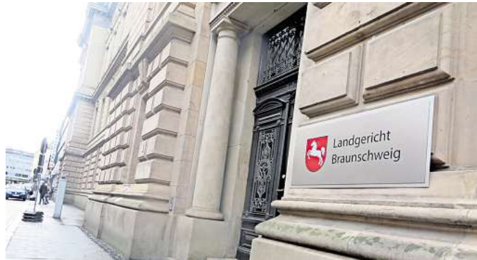
Das Landgericht Braunschweig: Hier wird der Fall verhandelt.