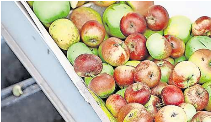
Geerntete Äpfel: Nutzen Sie Früchte aus dem eigenen Garten für Marmelade, Mus oder Kuchen?

Wie halten Sie es? Machen Sie Früchte noch selbst ein wie die Großeltern? Kochen Sie Marmelade oder kommt bei Ihnen Kuchen mit Früchten der Saison auf den Tisch? Wer an unserer PAZ-Umfrage teilnimmt, kann einen 50-Euro-