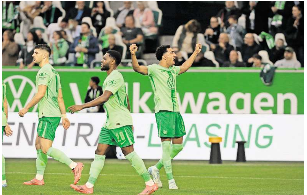
Feiert der VfL Wolfsburg gegen Union seinen ersten Heimsieg? hallo-Leser können für dieses Spiel Karten gewinnen.

Direkt zur Verlosung: Einfach den QR-Code mit dem Handy scannen.