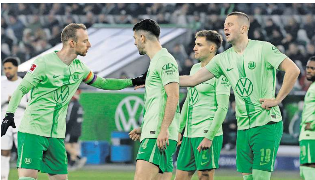
Für das Spiel des VfL Wolfsburg gegen Holstein Kiel können Leser 2x2 Eintrittskarten gewinnen.

Bereits 2018 standen sich beide Mannschaften in einer packenden Relegation gegenüber: Wolfsburg sicherte sich den