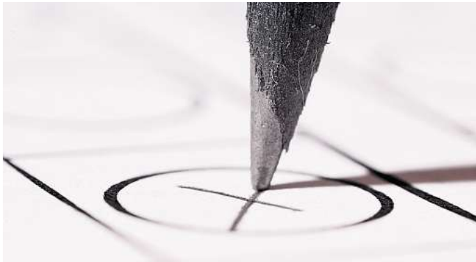
Vorgezogene Bundestagswahl: Der Termin ist am 23. Februar 2025.

Anders ist der Fall, wenn man sich bestimmte Altersgruppen anschaut. Junge Menschen bis 29 Jahre sehen sich im Schnitt eher links, wie 33 Prozent angaben. In der politischen Mitte ver-