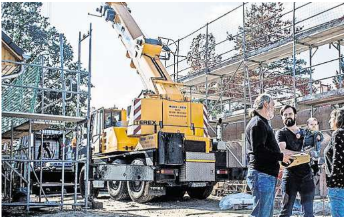
Alles im Plan? Zahlungspläne dürfen Abschlagszahlungen nur nach tatsächlichem Baufortschritt auf der Baustelle einfordern.