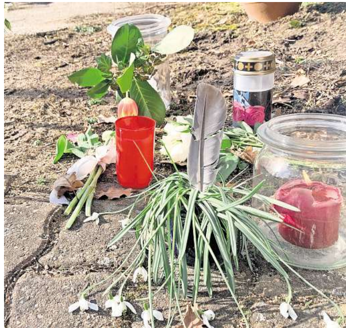
Die 300-Seelengemeinde Rietze steht unter Schock. Am Freitag war eine 38 Jahre alte Frau schwer verletzt in ihrem Haus aufgefunden worden und erlag später ihren Verletzungen.

Beamte der Polizeiinspektion Salzgitter/Peine/Wolfenbüttel führten gemeinsam mit einem Rechtsmediziner und Forensik-Spezialisten des Zentralen Kriminaldienstes umfangreiche Spurensicherungen vor Ort durch. Ziel der Untersuchungen ist es, die genaue Todesursache sowie die Umstände, die zu den