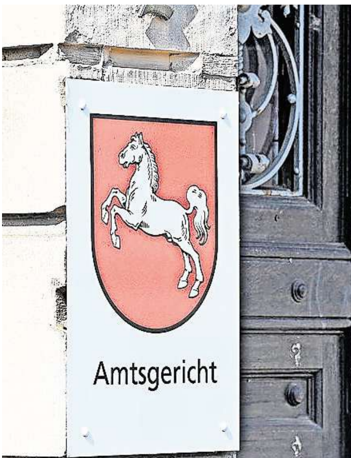
Verhandelt wurde der Fall am Amtsgericht Peine.

In ihrem Plädoyer sah die Staatsanwältin den Tatbestand der gefährlichen Körperverlet-