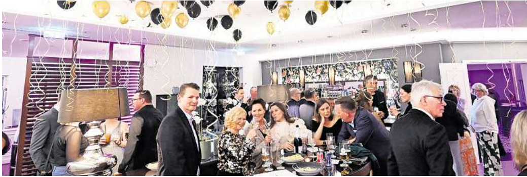
Die siebte Charity-Night war ausverkauft.

Und nun war es endlich wieder soweit: Die vielen Partygäste konnten, wie bereits im letzten Jahr auf zwei Tanzflächen zu unterschiedlicher Musik von DJ Helge und DJ Steffen tanzen und