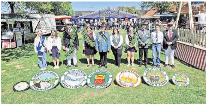
Schützenfest 2025 in Stedum-Bekum: Die Majestäten.

Nach dem traditionellen Königsfrühstück am Sonntag wurden dann die Schützenscheiben im Dorf aufgehängt. Dazu mar-