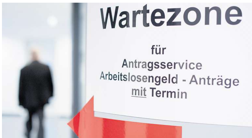
Ein Mann geht in den Wartebereich für den Antragsservice Arbeitslosengeld.

Im Landkreis Peine waren im Juni insgesamt 4.511 Menschen arbeitslos gemeldet, 40 mehr als im Vormonat und 199 mehr als