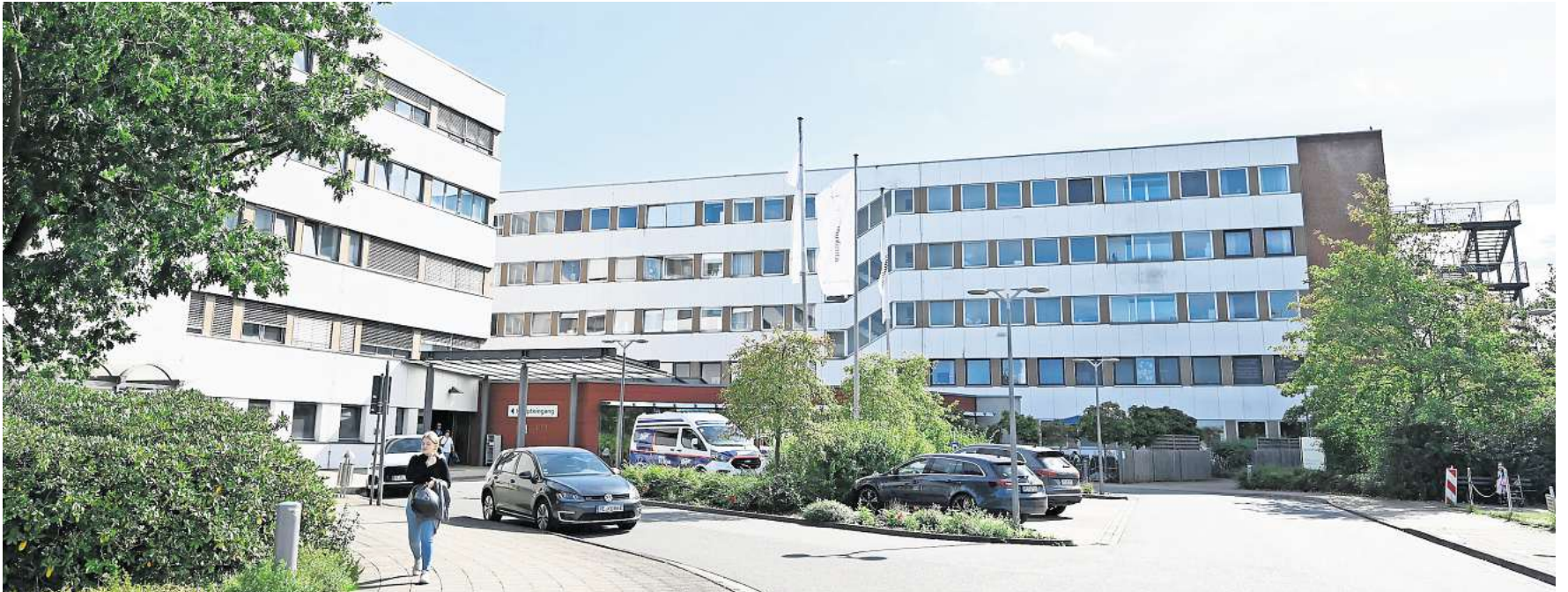
Klinikum Peine: Ein Knackpunkt sind die Baustoffe im alten Gebäude, das nach Fertigstellung des Neubaus abgerissen werden soll.